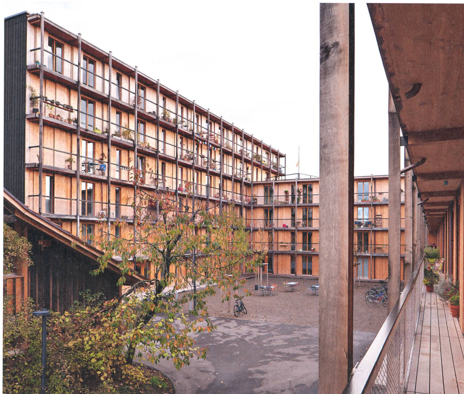
Hagmannareal in Winterthur weberbrunner und Soppelsa Architekten