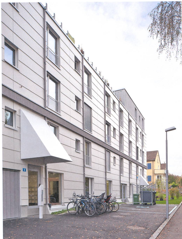
Haus Waldmeisterweg in Zürich Lütjens Padmanabhan Architekten