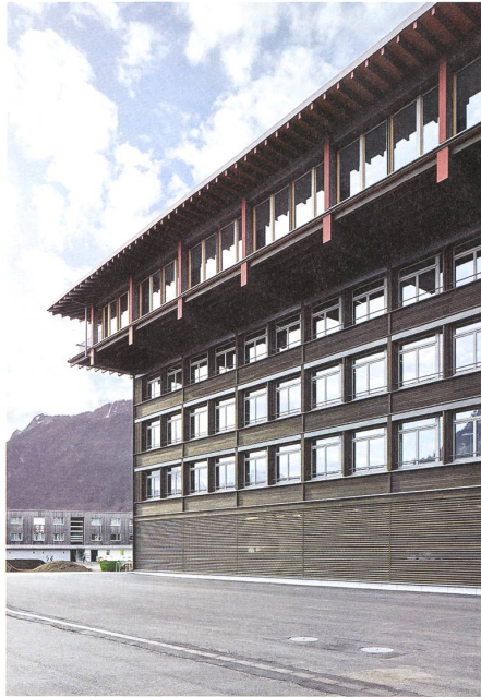
Mit schwebender Leichtigkeit fügen Meili, Peter & Partner mit Holz ein Bauwerk, das in seiner Ausdruckskraft japanische, aber auch barocke Züge trägt. → S. 6