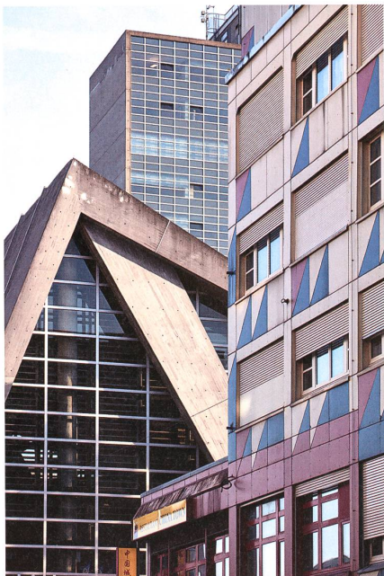
Die Zukunftsstadt Biel ist auch eine Architekturstadt – und sie plant ihre Entwicklung aktiv. Fokus Biel: → S.54