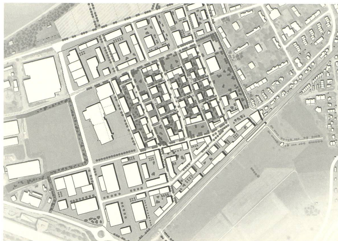
2. Stufe: KCAP Architects & Planners, Zürich mit Yewo Landscapes, Wien

Das Siegerteam um Hosoya Schäfer mit Agence Ter und Denkstatt setzt mit seinem Konzept bei der heute teils landwirtschaftlich geprägten Realität des Ortes an und fragt, wie dieser Charakter auch in einer urbanisierten Situation noch zum Tragen kommt. Ein interessanter Ansatz, denn er begreift Freiraum, Bebauungsstrukturen, Aneignung und Zeit als ineinandergreifende Entwurfsbestandteile und versucht, daraus zukunftsfähige Strukturen, aber auch überraschende Bilder für die Agglomeration zu gewinnen, die nicht reflexartig das geläufige Bild der «europäischen Stadt» kopieren. Als zentrales Entwurfsthema reichte dieser Gedanke dem Begleitgremium jedoch nicht, und er spielt im Resultat daher nur noch eine untergeordnete Rolle. Die ursprüngliche Idee lebt noch im ersten Entwicklungsschritt, der Investition in eine teilausgebaute «Salinenallee» und ein kleines Gemeinschaftszentrum, das zu einem frühen Zeit-