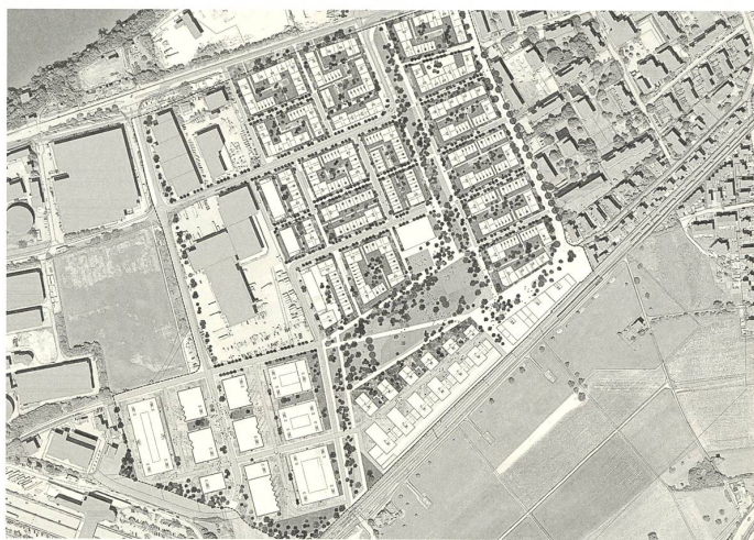
1. Stufe: Helsinki Zürich Office, Zürich mit MDP Michel Desvigne Paysagiste, Paris