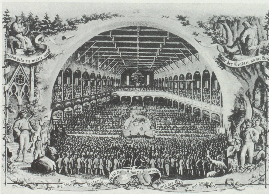
Das Innere der Halle des eidgenössischen Sängertages in St. Gallen bei der Hauptaufführung 1856. Lithographie von Johann Baptist Isenring von Lütisburg (1786–1860). (Aus Rimli, «650 Jahre Eidgenossenschaft», Zürich 1941.)

Hauser 1989: A. HAUSER, Das Neue kommt. Schweizer Alltag im 19. Jahrhundert . Zürich 1989.