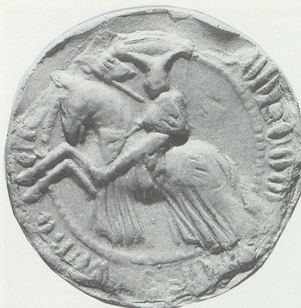
Siegel von Hugo II. von Werdenberg-Sargans. Dem treuen Parteigänger von König Rudolf von Habsburg gelang der Überfall auf Bischof Friedrich von Montfort bei Balzers im Jahr 1289. (Historisches Museum St.Gallen.)

Schwieriger zu beurteilen ist das politische Wirken der geistlichen Montforter: Erkannten sie die Bedeutung der damals aufstrebenden gesellschaftlichen Kräfte, der Bürger in den Städten, der Bauern in den Talgemeinschaften als der neuen wirtschaftlichen und auch militärischen Kräfte, die auch neue Rechte verlangten? Die Montforter gerieten mit ihrem Ziel der Errichtung einer Landesherrschaft in einen ausgewogenen Gegensatz zum ersten Habsburger König, der, von den gleichen Voraussetzungen der hochadligen Landespolitik ausgehend, mit allen Mitteln, mit juristischen, verwaltungstechnischen und auch mit kriegerischer Gewalt, die Selbständigkeit und Gegnerschaft eines Teils des Adels zum Reich bekämpfte. In diesem vielfältigen Mächtenspiel bildeten sich ständig neue Koalitionen aus den