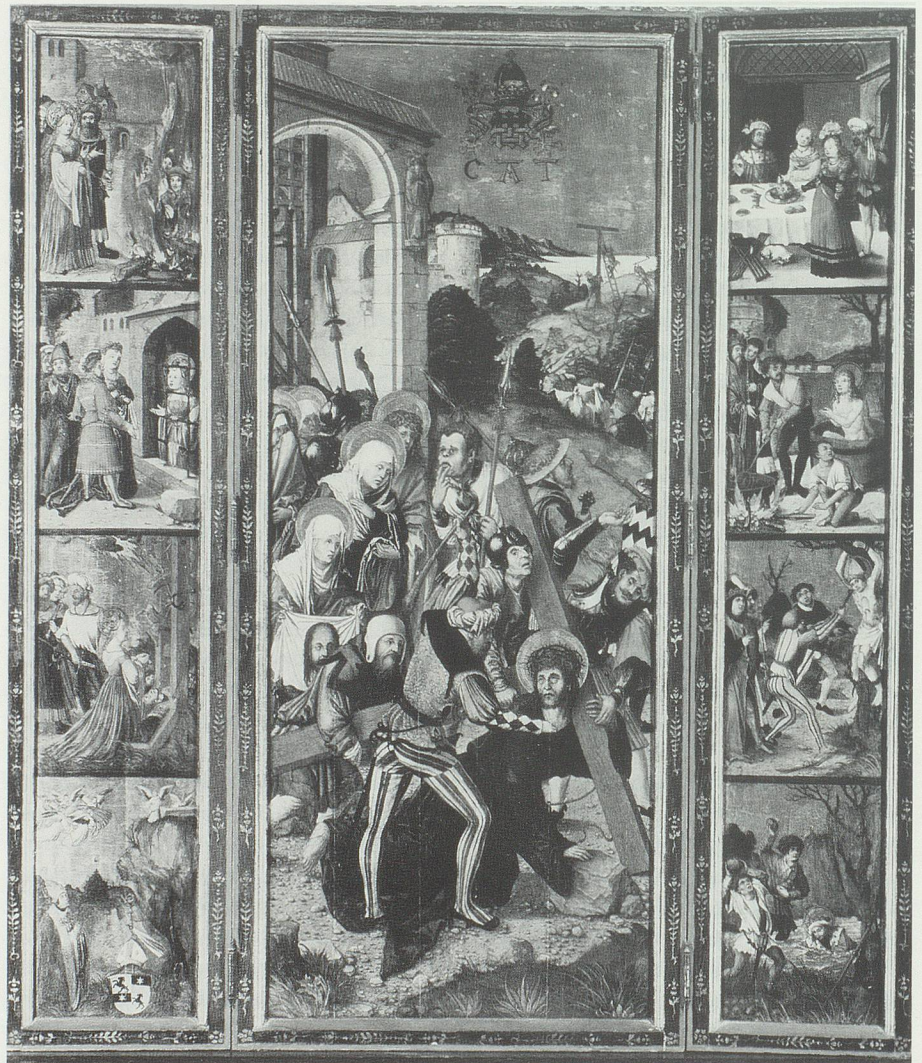
Beim Katharinenaltar in der Kathedrale von Chur wurde Bischof Friedrich begraben. Die drei Tafeln des heutigen Altars mit den Bildern zur Katharina-Legende wurden um 1510 gemalt und gehören zu den bedeutenden Flügelaltären der Schweiz.

der aptye gient [auf die Abtei verzichtete] vnd im si uff gëb mit der herren willen. Vnd kament des überân. Vnd ward apt Ruomen darumb vil gehaissen. Apt Ruoman râtgeben vnd die im haimlich waren kilchen ze lihen vnd silber ze geben vnd andre ding, das laider wider dem rechtem waz.» 27 Man kann sich leicht denken, wieviele gegenseitige Angriffsflächen das Bemühen sowohl des Königs wie auch des Montforters bot, möglichst umfassend Rechte und Besitzungen an sich zu ziehen. 28 Der entscheidende Streitpunkt im Jahre 1287 lag im Ansinnen des Königs, dass der Abt Klosterlehen an Rudolfs Söhne erteilen solle. Nach verschiedenen Kriegshandlungen, «blutigen Gefechten, Belagerungen und bei allgemeiner Ver-