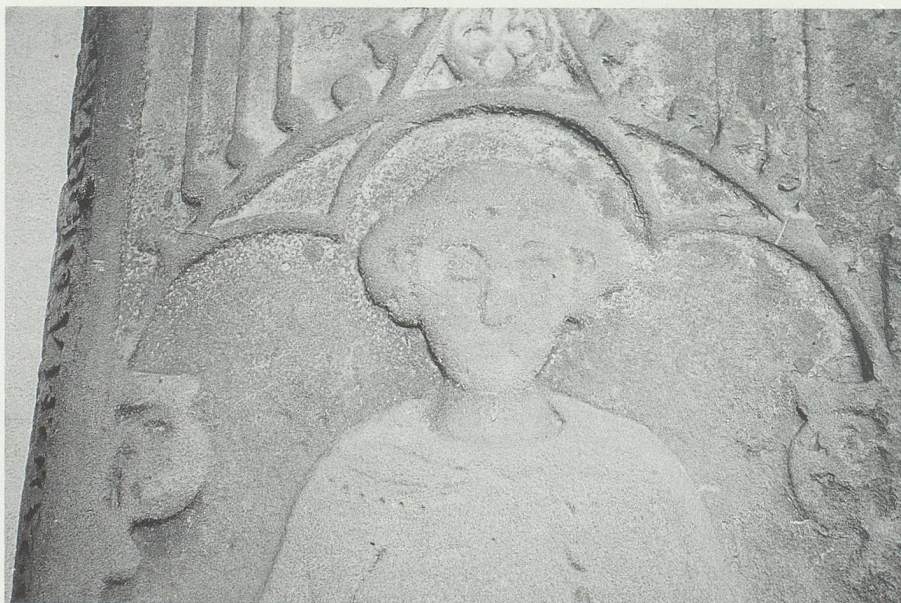
Beim Eingang der Churer Kathedrale aufgestellte Grabplatte des Domdekans Albero von Montfort († 1311). Der Montforter hatte sich für die Freilassung von Bischof Friedrich eingesetzt.

So werden der Todessturz von Bischof Friedrich und die Fluchten und Kriegszü-