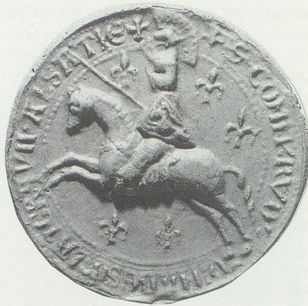
Siegel von König Rudolf von Habsburg. (Historisches Museum St.Gallen.)

Bruder Wilhelms Aussichten waren in diesem Sommer 1290 kaum besser als die des gefangenen Friedrichs. Wilhelm war das eigentliche Haupt des Widerstandes und Auslösers des Krieges gegen die Habsburger gewesen. Seine Wahl verdankte er einer politischen Aktion seiner Familie, die Absetzung seines Vorgängers war mit Geldmitteln erleichtert worden. 26 Der Montforter Abt sollte die nach den Streitigkeiten der Gegenäbte verwahrlosten Verhältnisse der Abtei wieder in Ordnung bringen. Welche anderen Interessen noch auf dem Spiel standen, lässt Kuchimaisters Bericht erahnen: «Nun was bi den ziten ain herr in dem closter der waz von monfort, vnd hiess grauf wilhelm, des bruoder warent Graff Ruodolff von monfort vnd Graff uolrich von Bregentz vnd Graff hug von der Schêr daz waren layen. [. . .] Also warb Graff fridrich ain apt Ruom [Abt Rumo] daz er von