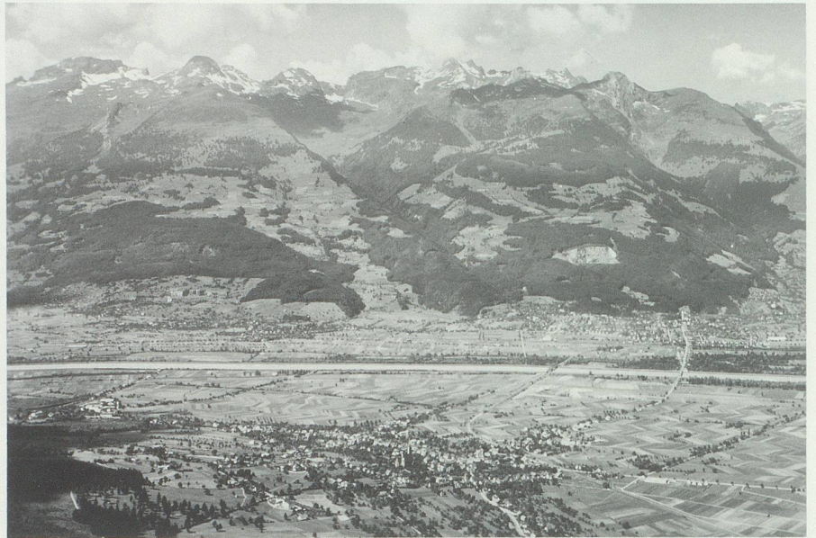
Blick von Liechtenstein aus über den Rhein nach der werdenbergischen Seite mit Buchs und Sevelen, im Vordergrund Schaan, in der Mitte Strassenbrücke (rechts) und Eisenbahnbrücke.

Die natürliche Grenze des Rheins und der Luziensteig wurde auch zur politischen und konfessionellen Trennlinie. Das westliche Rheintal wuchs in die Eidgenossenschaft hinein, besser: wurde von dieser erworben. Die Landschaft vom Ellhorn rechtsrheinisch talab bis zum Eschnerberg blieb ausserhalb der Eidgenossenschaft, aber auch ausserhalb des ausgreifenden habsburgischen Herrschaftsbereichs, und vermochte sich dank der äussersten Randlage als kleines Fürstentum in den Wellen obenauf selbständig zu erhalten. Dennoch verlief im Grunde sogar die politische Geschichte diesseits und jenseits des Rheins durchaus parallel: Beide Gebiete waren in früheren Jahrhunderten der Willkür der Herren ausgesetzt, wurden im Absolutismus entsprechend regiert. Die fürstlichen