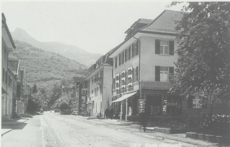
Bahnhofstrasse in Buchs mit Kaufhäusern, in welchen auch die liechtensteinische Bevölkerung gern einkaufte. Vorne rechts das Kaufhaus «Modern» in den 1930er Jahren.

hausverbot wurde in der Volksabstimmung auch deutlich bestätigt. Balzers, Triesen, Triesenberg und Gamprin wiesen immerhin ablehnende, das heisst migrosfreundliche Mehrheiten auf. 64 Die Gewerbegeossenschaft dankte den Stimmbürgern für diesen «Sieg des Idealismus über den Materialismus» 65 , womit sie den liechtensteinischen Einzelhändlern und Handwerkern Arbeit und Verdienst zu erhalten hoffte. Dass sich wegen eines provokativen Flugblatts, das Liechtenstein zum Anschluss an die Schweiz aufrief, ein Zeitungsstreit mit Duttweiler mit vorübergehender Konfiskation einer Nummer von dessen Zeitung «Die Tat» durch die liechtensteinische Regierung ergab 66 , gehört zu den Kuriositäten der Warenhausepisode.