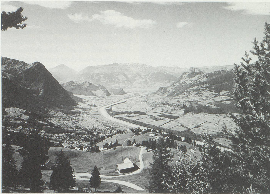
Blick von Liechtenstein in Richtung Balzers, Wartau und Sargans: Wäre Liechtenstein nach 1938 an Hitlerdeutschland angeschlossen worden, so wäre die deutsche Wehrmacht auf die Mittagsspitze, vor die Luziensteig und an den Rhein bis aufs Ellhorn zu sitzen gekommen – direkt vor und über der Sarganser Pforte.