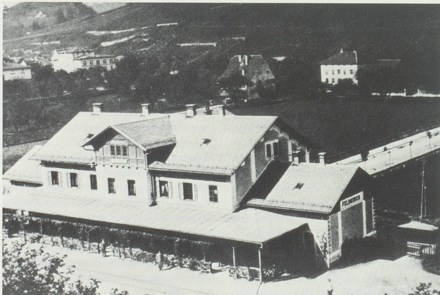
Der alte Bahnhof Feldkirch um 1920/30. Die Feldkircher wünschten im Zuge des liechtensteinischen Zollanschlusses an die Schweiz die Verlegung der Hauptzollämter und des Transitbahnhofs nach Feldkirch.

Die Buchser waren nicht ganz unglücklich. Ihr Hauptinteresse war dank zähem Einsatz des Initiativkomitees gewahrt. Den Zollanschlussbefürwortern verbat man nachträglich das «Nasenrumpfen» über die Werdenberger und wies den Vorwurf «öder Kirchturmpolitik» auf sie selber zurück. 41 Die eigene St.Galler Kantonsregierung wurde getadelt, weil sie «die Liebe zum Vorarlberg auch auf Liechtenstein übertragen» und darob den um seine Existenz kämpfenden Bezirk Werdenberg vernachlässigt habe. 42 Mit eidgenössisch-patriotischer Wehmut nahm man mit dem ausgehenden Jahr 1923 Abschied von einer historischen Epoche, während welcher «seit mehr als 500 Jahren die schweizerischen Grenz-wachen den Rhein von Salez bis zum Fläscher Berg [. . .] bewacht» hätten. 43 Und zum Silvester findet man sich in Buchs-Werdenberg mit dem «unerwünschten» Geschenk des liechtensteinischen Zollanschlusses ab: «Nun heisst es [. . .] abzuwarten, wem bei diesem Geschäft die reifen Früchte in den Keller getragen werden.» 44 Versöhnlich wünscht der «Werdenberger und Obertoggenburger» zugleich namens des Werdenberger Volkes,