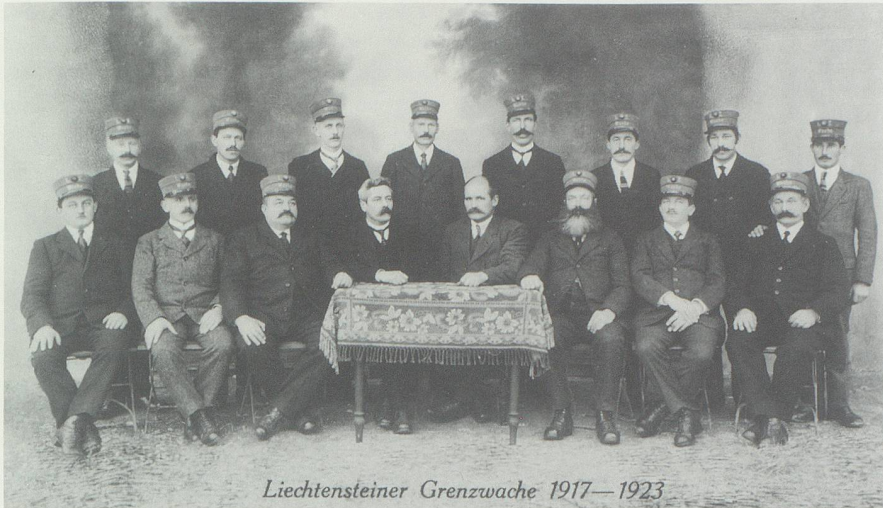
Liechtensteiner Grenzwaache 1917—1923

Liechtenstein hatte vom Herbst 1919 (nicht 1917) bis Ende 1923 als eigenständiges Zollgebiet auch eine eigene, 16 Mann starke Grenzwaache.