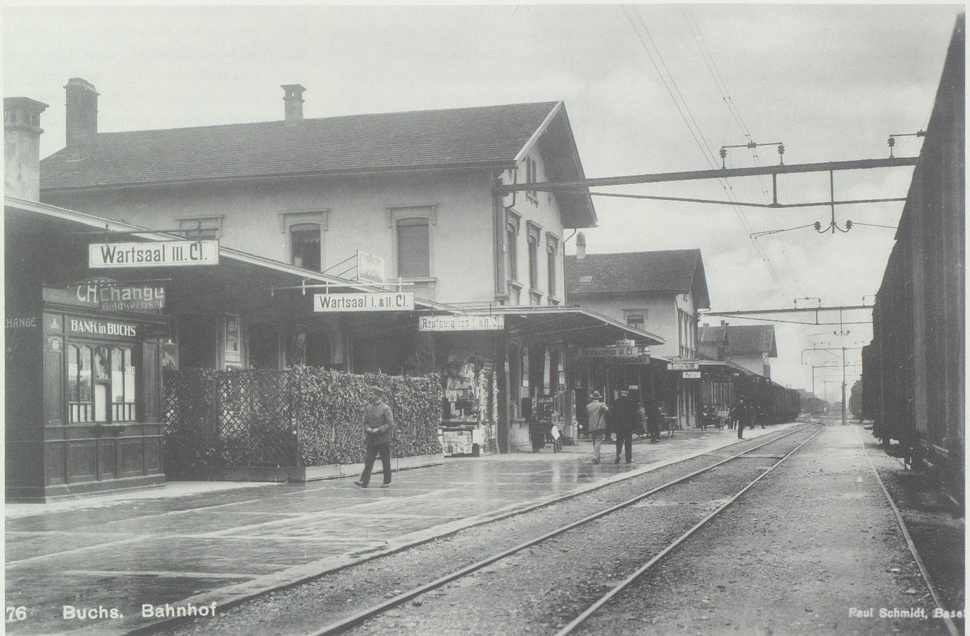
Der Bahnhof Buchs um 1920/30. Von einem liechtensteinischen Zollanschluss befürchtete man in Buchs den Verlust der österreichischen und schweizerischen Grenzzollämter und damit auch des internationalen Transitbahnhofs in Buchs.

leicht zu überwachende nasse Grenze des Rheins gegen eine neue, unübersichtliche Landgrenze einzutauschen: Die letzten Jahre hätten zur Genüge gezeigt, dass die neue Zollgrenze innerhalb Liechtensteins «ein wahres Dorado für den Schmuggel und den Übertritt von schriftenlosem Gesindel» biete.