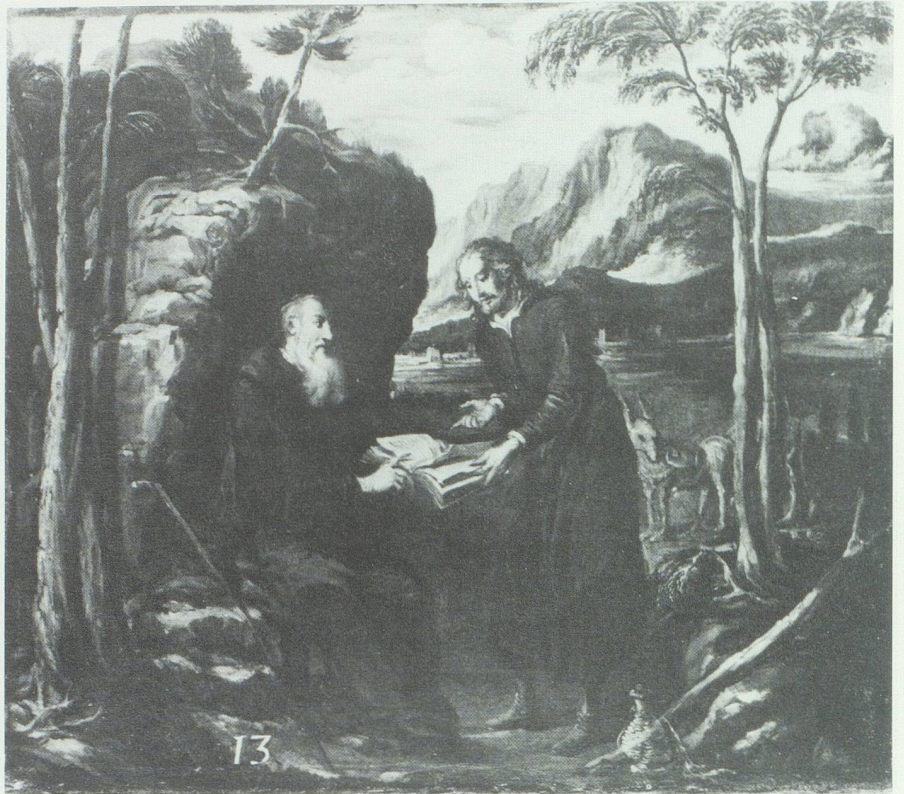
Der heilige Gallus macht den Diakon Johannes mit der monastischen Lebensweise und dem Verständnis der göttlichen Schriften vertraut. (Bild aus Duff 1977/87, Anhang Nr. 13.)

ste dieser Namen, der schliesslich auf das ganze Bergmassiv und seinen höchsten Gipfel übertragen wurde, bezeichnete ursprünglich eine Alp beim Säntiser See, die einem Sambatinus ( Sambutinus ) gehörte, wobei dieser lateinisch-romanische Personennamen in Rätien gut belegt ist. 12 Nach dem Zeugnis dieser Namen wurden die Alpen auf der Appenzeller Seite der Bergkette zwischen Hohem Kasten und Kreuzbergen vom Rheintal aus genutzt, längst bevor der übrige appenzellische Raum gerodet und besiedelt war. Trotz ebenfalls bestehender Schwierigkeiten der gewählten Route konnte Gallus auf den Alpen im Raum Säntiser See am raschesten Anschluss an die lateinisch-romanische Welt finden, in der Grabs damals lag.