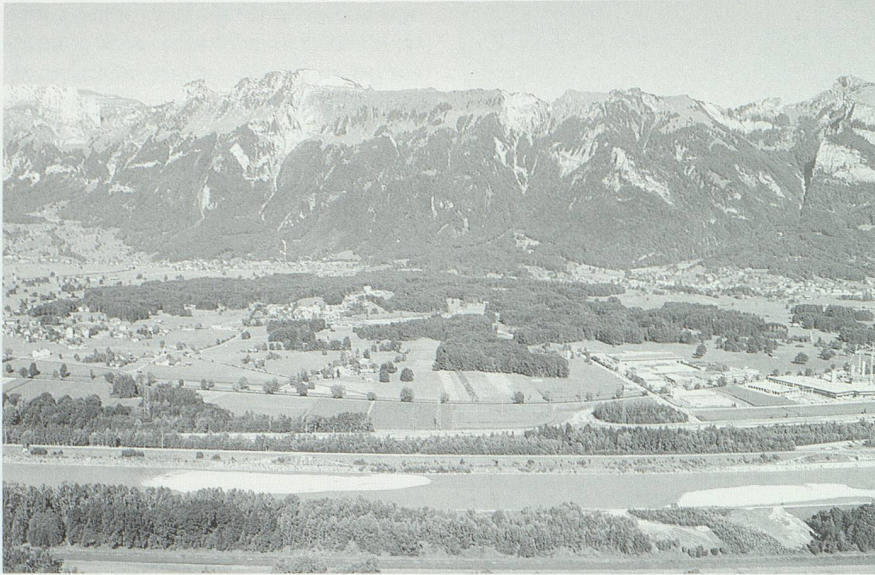
Der Raum Sennwald, in den Gallus auf der Flucht vor dem Herzog Cunzo herniederstieg. Dabei scheint er den Weg über die Saxerlücke (im Bild oben links) gewählt zu haben; denkbar wäre immerhin auch ein Abstieg über die Alp Rohr (oben rechts, links vom Hohen Kasten) oder über die Kamoralpen (rechts ausserhalb des Bildes). Der Schlosswald in der Bildmitte stellt den letzten Rest der «silva vocata Sennius» dar.

schem Schmuck umgab. So wurde sie beliebt und in zahlreichen Abschriften weit hin verbreitet und gelesen. Die Fakten liess Walahfrid selbstverständlich bestehen, wenn auch gelegentlich eine seiner Neuformulierungen schon beinahe einer eigenen Interpretierung gleichkommt. 5 Der Bericht von der Flucht des heiligen Gallus nach Grabs ist in den Fragmenten der Vita vetustissima leider nicht erhalten. Es kann aber keinem Zweifel unterliegen, dass er auch in dieser ältesten Fassung vorhanden war. Inhaltlich stimmen die Erzählungen von Wettli und Walahfrid im wesentlichen überein.