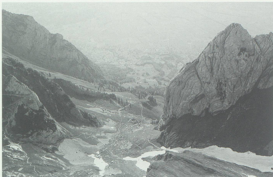
Die Saxerlücke mit Blick ins Rheintal.

Dorfbezeichnung die lateinische Fügung CAPUT RAPIDAE genannt. In der Lautentwicklung war daraus zur Zeit des heiligen Gallus wohl die Form *kavrávede geworden, an welche – wie bei vielen romanischen Namen Graubündens und der Alemannia Romana – ein von der lateinischen Grundlage her in diesem Fall nicht gerechtfertigtes analogisches -s angehängt wurde. Die Form *kavrávedes wies jedoch eine unübersehbare phonetische Schwäche auf und war daher für lautliche Umgestaltungen anfällig. Die erwähnte Schwäche bestand in der Wiederholung der Lautfolge av . Sie liess sich rein phonetisch leicht beheben durch die Metathese (Lautumstellung) des ersten, in nebetoniger Silbe stehenden av zu va bzw. wa (unter dem Einfluss des vorangehenden k ). Trat diese Metathese ein, entstand *kwarávedes, das heisst jene Form, die wir als direkte Grundlage der weiteren Entwicklung des Namens erkannt haben. Die genannte phonetische Schwäche konnte jedoch nicht nur durch eine Metathese in der ersten Silbe behoben werden. Die metathetische Umgestaltung konnte auch die zwei letzten Silben treffen, die dadurch ihre Konsonanten vertauschten: *kavrávedes > *kavrádevs. Das so entstandene Resultat entspricht weitgehend den Formen der Wettihandschrift sowie des Grossteils der Walahfrid-Handschriften. Allerdings tritt der Typus in den Quellen immer mit qua -Anlaut auf, was nach dem Dargelegten lautlich nicht zu rechtfertigen ist, da die Metathese ja gerade nicht die erste Silbe