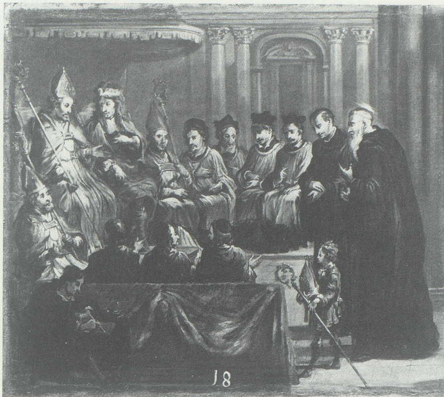
Bischofswahl in Konstanz. Diakon Johannes aus Grabs wird auf Fürsprache von Gallus ins hohe Amt berufen.