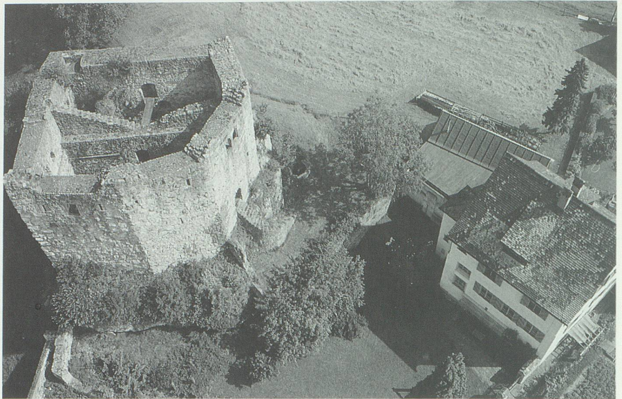
Ruine Forstegg bei Salez. Auf diesem ehemaligen Saxer Herrnsitz wurde um 1600 die Manessische Handschrift aufbewahrt.

Als Mutter der vil schoenen minne , das ist Christus, 37 nimmt sie die Sünder barmherzig unter ihren Schutz, sie allein vermag den Zorn Gottes zu besänftigen und die Menschen zur wahren Liebe zu führen. Eberhard erfindet in seinem Lied keine neuen Bilder. Die Hörer kannten sie aus lateinischer Hymnenliteratur und deutschsprachiger Mariendichtung. Die sinnliche Betonung Marias als Braut und Geliebte des Herrn weist aber auf eine neue Religiosität hin, die im 14. Jahrhundert als ekstatische Brautmystik nicht zuletzt bei den Dominikanern ge- und erlebt wird. Ein Nachfahre Heinrichs und Eberhards spielt schliesslich noch einmal eine Rolle in der Geschichte der Manessischen Liederhandschrift: Johann Philipp von Hohen-