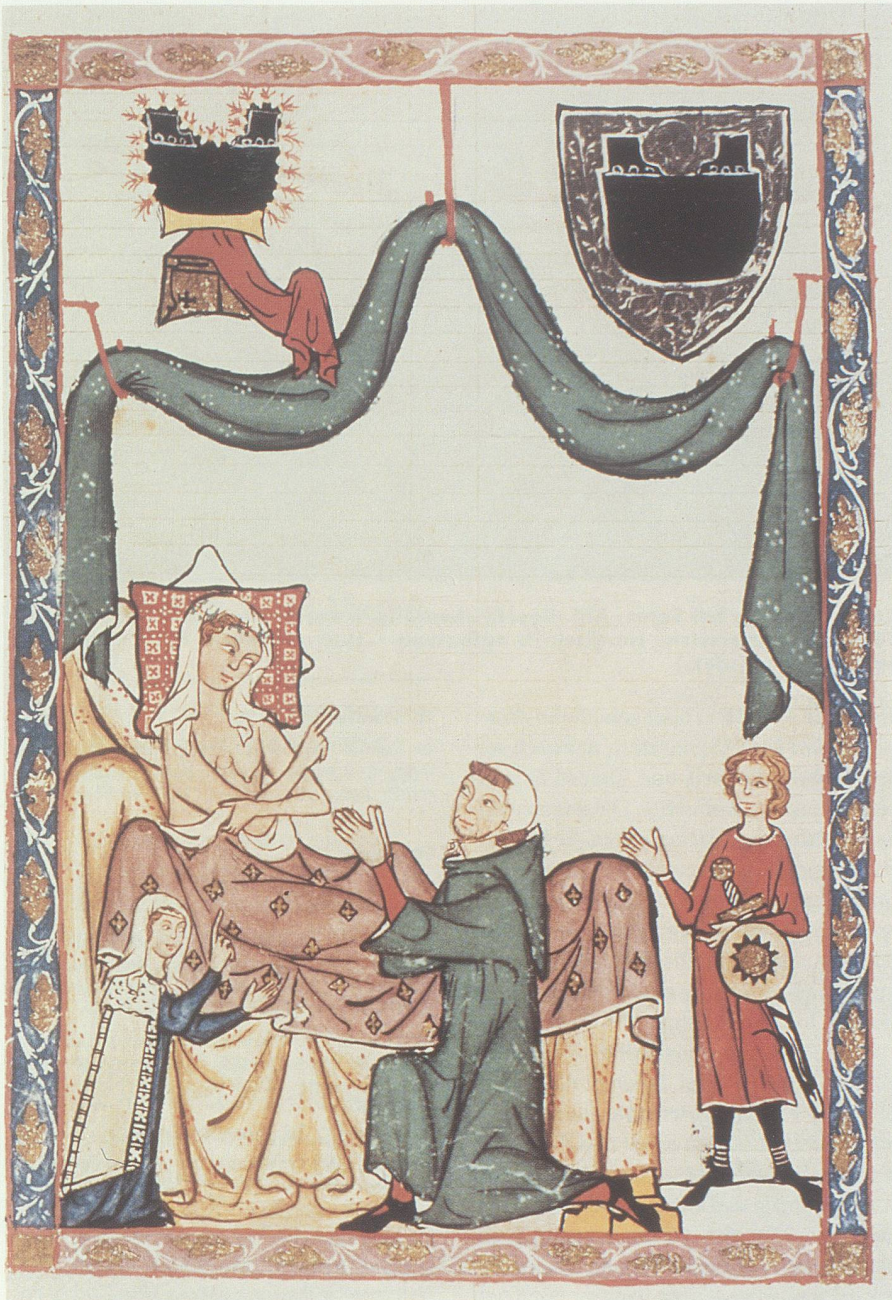
Meister Heinrich Teschler. Codex Manesse fol. 281v. Das Bild stammt vom gleichen Maler wie die Miniatur Eberhards. Es zeigt deutlich den Humor und die offensichtliche Fabulierlust des Künstlers.

gegen Gottes Gebot ass. Die hast Du von der Strafe befreit mit tugendhaftem Bemühen. Was immer Dir jemand an Lob schrieb, das ist die Unbeständigkeit eines Schattens gegenüber der Grösse Deiner Würde, die keine Zunge je verkünden könnte. Zu einem guten Ende kannst du das törichte Beginnen Evas wenden.) 36