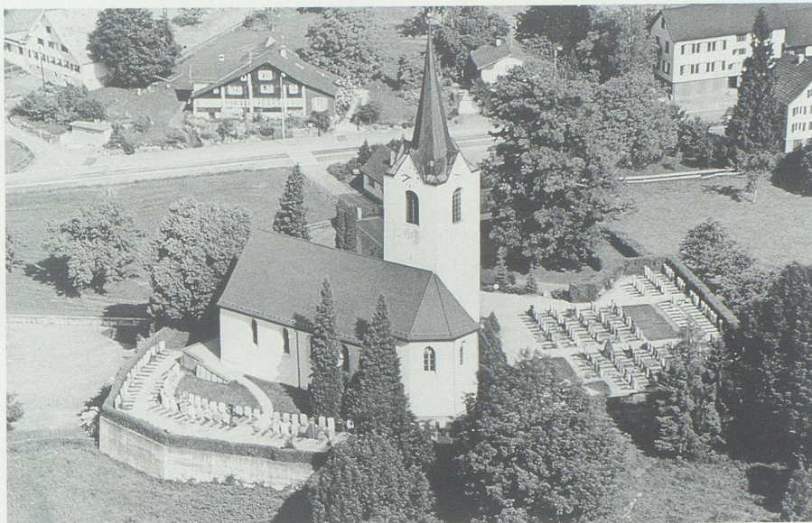
Gesamtansicht vor der Restaurierung von 1991. (Flugaufnahme 1987.)