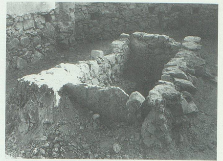
Eine unbekannte, leere Gruft im Chor.

Seitens der Kirchenvorsteherschaft wurde der Wunsch geäussert, eine Kopie der 1529 entführten Muttergottesstatue anzufertigen, um sie in einer Chornische aufzustellen. Eine erstaunliche, aber zugleich erfreuliche Gesinnung. Ob das Vorhaben gelingen wird, steht zum Redaktionsschluss