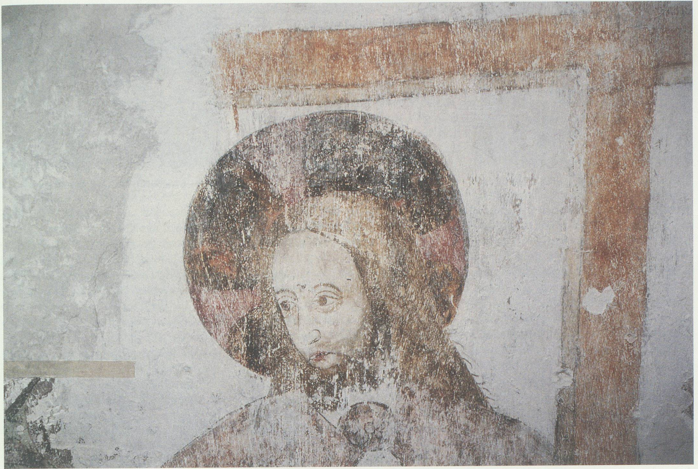
Die zum Teil freigelegten Wandmalereien im Chor erweisen sich als von vorzüglicher Qualität.