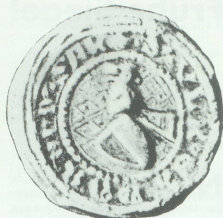
Siegel des Ulrich Eberhard von Sax.

die für die staufische Macht und Politik von grosser Bedeutung waren. Dem Besitzer der Herrschaft Misox, einem saxischen Stammland, kam eine eigentliche Schlüsselstellung der Nord-Süd-Achse zu. Anfang des 13. Jahrhunderts dehnten die Saxer ihren Besitz nach Norden aus und beherrschten nun auch den Verkehr im St. Galler Rheintal, einer wichtigen Etappe auf der Route Bodensee-Italien.