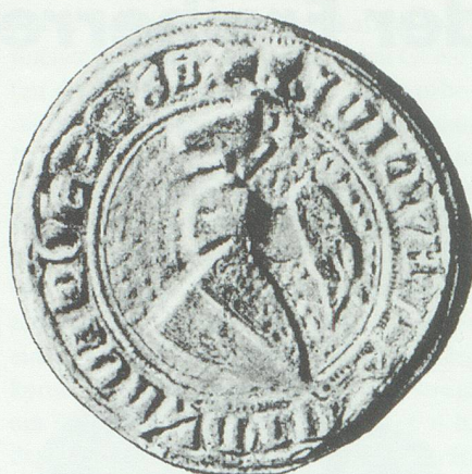
Siegel des Ulrich Brancho von Sax.