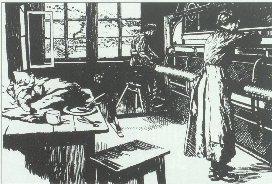
Im Heimstickermilieu wuchsen die Kinder praktisch neben der Stickmaschine auf. Voralberger Stickerfamilie um 1896. (Aus Tanner 1985, S. 165.)

Aus allen 15 St.Galler Bezirken mit damals noch 83 Gemeinden waren auf die «Fragezettel» der Gemeinnützigen Gesellschaft insgesamt 242 Berichte eingegangen. Die Resultate waren besorgniserregend: 2356 Kinder im schulpflichtigen Alter – sie entsprachen rund 15 Prozent aller Schülerinnen und Schüler, aus deren Schulen die Fragen beantwortet worden waren – arbeiteten im Sticklokal neben ihrer Schulzeit als Fädler; 65,5 Prozent davon, also