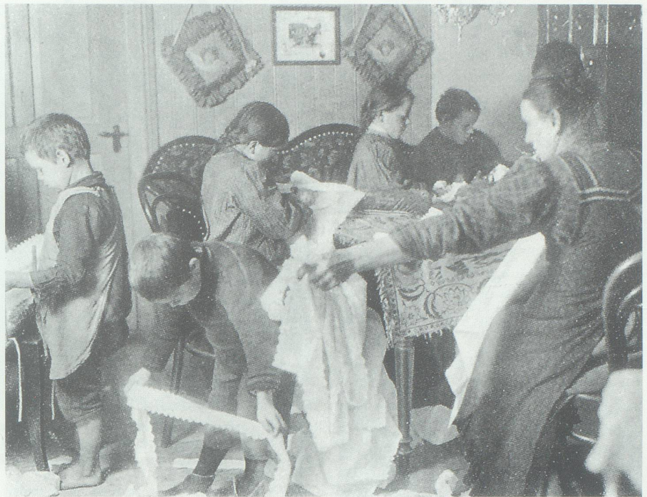
Mutter und Kinder beim Ausschneiden. Die Einbindung in die Erwerbsarbeit gehörte zu den ersten Lebenserfahrungen der Stickerkinder. Foto um 1900. (Aus Tanner 1985, S. 167.)

Lehrkräfte und Schulämter hatten zuhnden der Gemeinnützigen Gesellschaft erschreckende Berichte über die Folgen solcher Kinderarbeit verfasst. 36 Prozent der 2356 betroffenen Stickerkinder wurden als