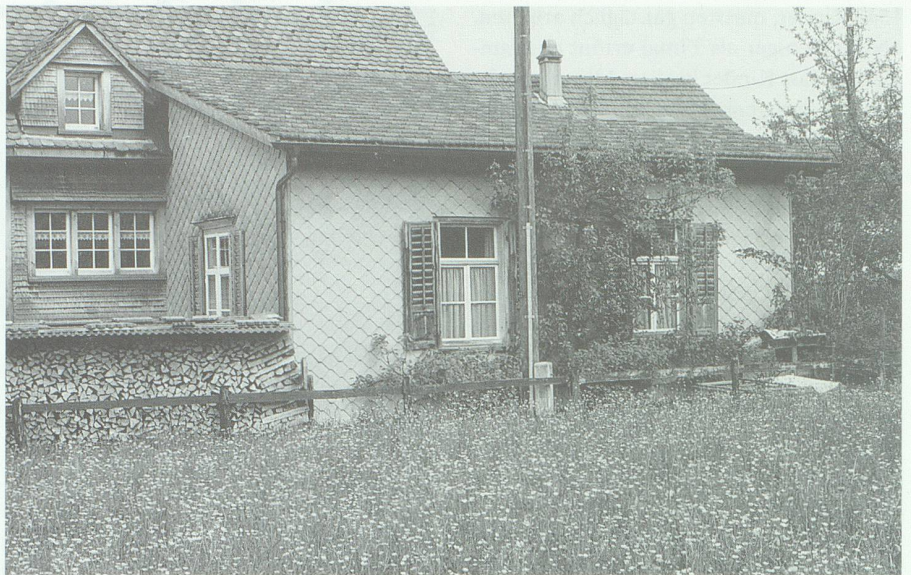
In den Anbauten vieler Häuser in den alten Dorfteilen des Werdenbergs waren früher die Sticklokale untergebracht. Kinderarbeit war in den Stickerfamilien um die Jahrhundertwende alltäglich.

Industrie-, insbesondere durch Stickerarbeit ersucht, die Lehrerschaft, Schul- und Bezirksschulräte und Waisenämter des Kantons aufzufordern, an der Hand bestehender Gesetzesvorschriften dem eingerissenen Übelstande verschärfte Aufmerksamkeit zuzuwenden, von den genannten Behördenstellen eventuell genaueren Untersuchung zu verlangen und nach den Ergebnissen derselben die geeignet erscheinenden Massregeln zu treffen». 15