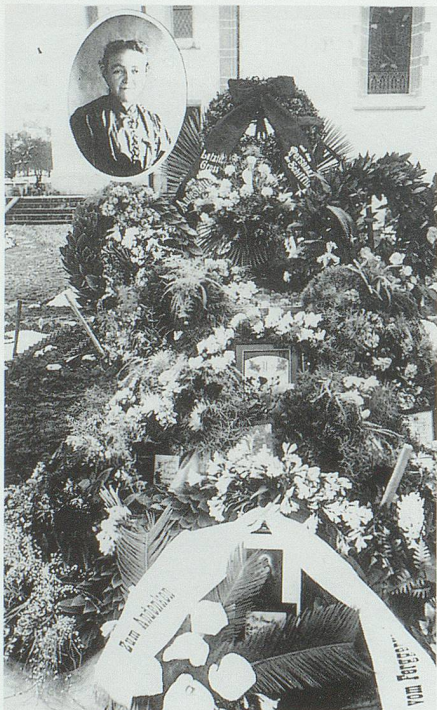
«Fromme» Bilder als Grabschmuck – ein Brauch, der in Grabs um 1940 abgeschafft wurde.

Zum Leichenzug versammelten sich die Verwandten beim Trauerhaus. Die nächsten weiblichen Verwandten gingen meistens ohne Geheiss ins Trauerhaus. Die nahen männlichen Verwandten, also die Mantelträger, wurden eingeladen, ins Haus zu kommen, wo sie mit einem Glas Wein und Brot bewirtet wurden. Bei grossen Verwandtschaften sollen bis zu hundert Personen im Haus gewesen sein. Wenn es Zeit wurde, vom Haus wegzugehen, wurden die Mäntel über die Achseln gelegt und mit dem einzigen Knopf zu-