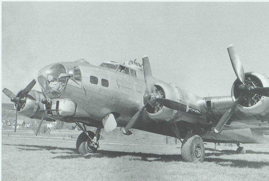
Insgesamt 158 Bomber des Typs B-17 (Bild) und B-24 gingen während des Zweiten Weltkrieges in der Schweiz nieder: 131 durch Landung oder Notlandung, 21 stürzten ab.

also etwa 7000 bis 8000 Fuss, so etwa, das machte mir etwas Angst, und überall lag Schnee. Dann wurde es offener, das war in der Gegend von Klosters. Wenn ich gewusst hätte, was unter dem Schnee war, wäre ich wahrscheinlich runtergegangen, aber so wusste ich es nicht, und dann waren da Bäume. Dann, bei Klosters, auf einmal, paff, war der linke Flügel voll von Öl vom linken Motor, der bis dahin noch lief. Da sagte ich: Das ist das Ende, mit nur einem Motor geht nichts mehr, und der Öldruck sank ebenfalls, jetzt war's soweit! Wenn da Gras gewesen wäre, hätte ich eine Bauchlandung gemacht, aber so nein! Ich drehte die Maschine gegen Norden, ich sah die Berge dort und dachte, dort ist's am besten, um die Maschine loszuwerden. So sprangen wir ab.