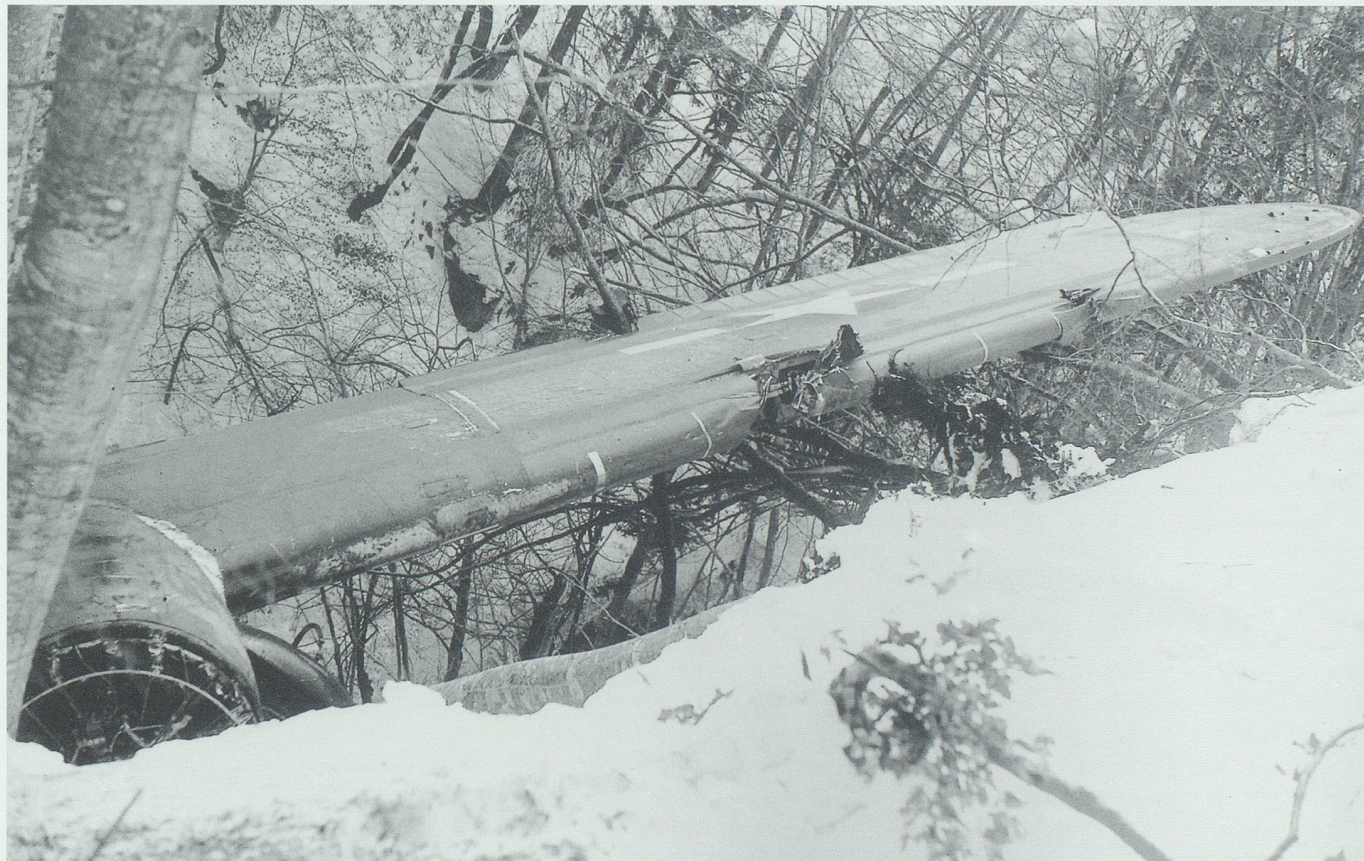
McLaughlins Maschine nach dem Absturz bei Wildhaus.

5 Einige Angaben zur Überfliegung des Flüela und zur Route sind unverständlich.