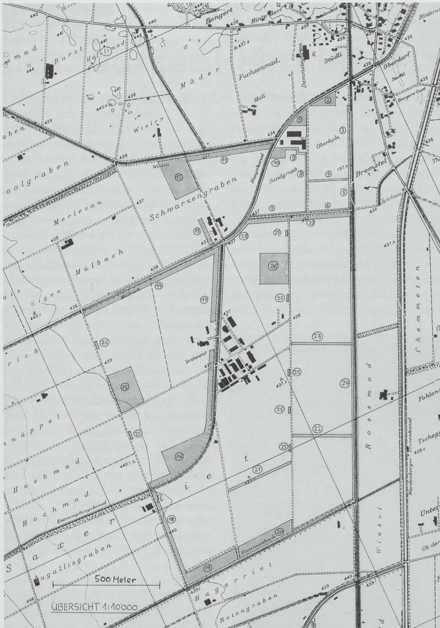
Auf gegen 22 Hektaren werden auf den Arealen der staatlichen Gutsbetriebe im Saxerriet naturnahe Flächen und Vernetzungselemente angelegt (auf dem Plan dunkel markiert). Die grösseren Kernflächen erreichen Ausmasse von bis zu über drei Hektaren. Plan aus dem Konzept vom 10. Februar 1997.

nahme konkrete Vorschläge zur inhaltlichen Ausgestaltung der rund 22 Hektaren umfassenden ökologischen Ausgleichsflächen. Gemäss diesen Vorschlägen erfolgte Anfang 1997 in enger Zusammenarbeit mit der NSGS die Detailprojektierung. Im Juli desselben Jahres genehmigte die St.Galler Regierung das Konzept und die Erhöhung des Anteils der ökologischen Ausgleichsflächen auf den Arealen der Strafanstalt und der Landwirtschaftlichen Schule von fünf auf die vorgeschlagenen zwölf Pro-