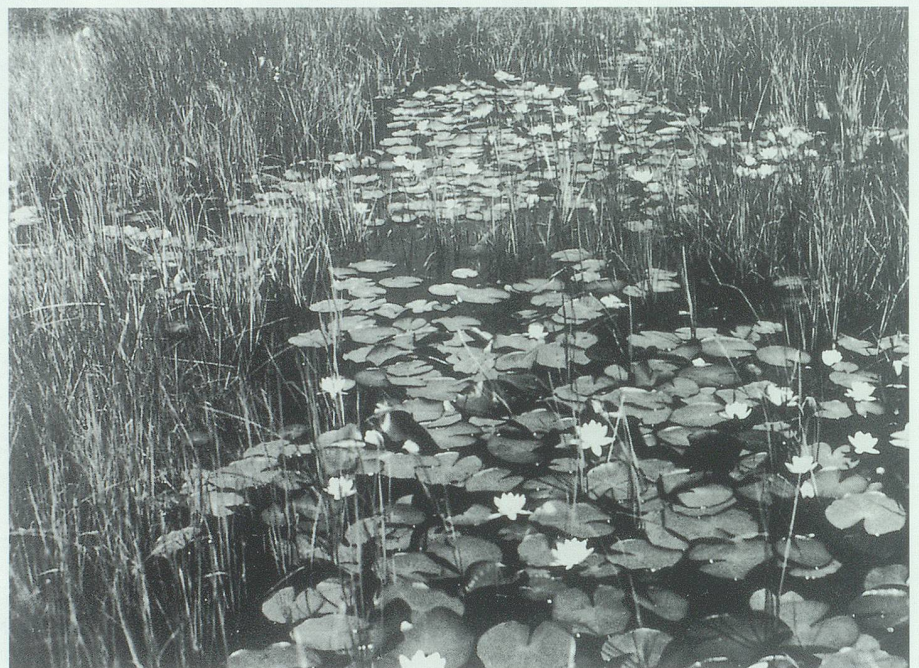
Torfstich mit Seerosen, 1927. Bis zur Gewässerkorrektur in den 1920er Jahren war das Saxerriet eine extensiv genutzte, naturnahe Riedlandschaft.

grösseren Teil im Gebiet des Saxerberges) sowie die Bereiche von Quellen wurden der Grünzone zugewiesen und sind somit ebenfalls langfristig gesichert. Die in der Politischen Gemeinde vor dem Abschluss stehende Zonenplanrevision (öffentliche Auflage im November/Dezember 1996) bringt zudem eine wesentliche quantitative und qualitative Optimierung der Schutzzonen und der Schutzbestimmungen.