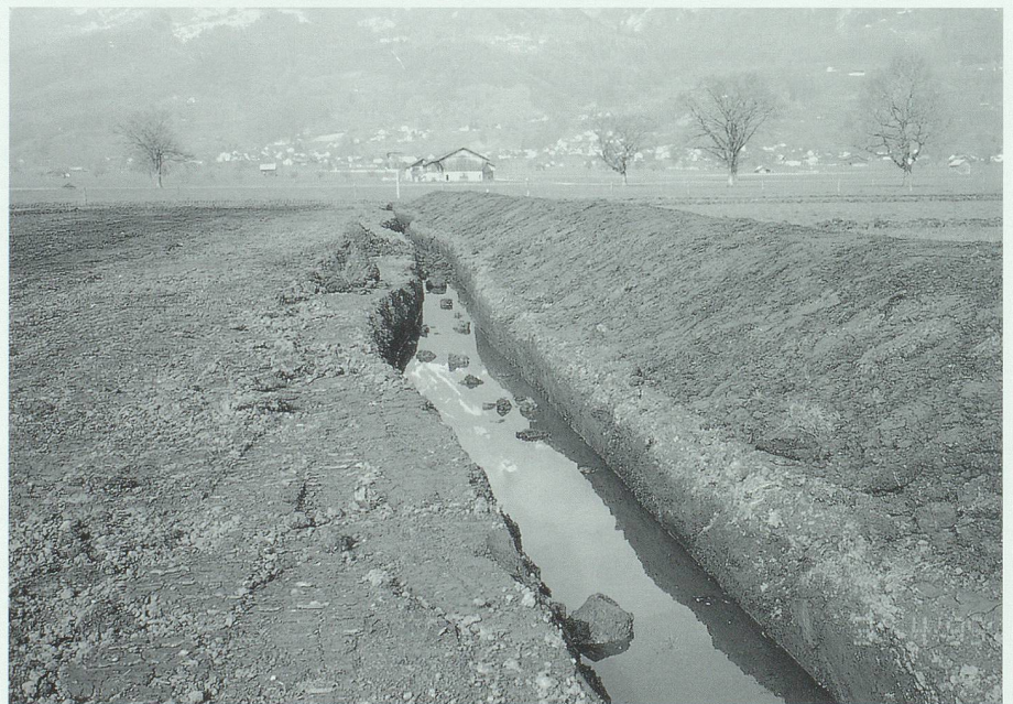
Offene Abzugsgräben sind mit den Meliorationen aus dem Saxerriet verschwunden. Mehr als zwei Kilometer Wassergräben wurden 1999 neu angelegt.

Im März 1999 wurde mit der Umsetzung des Projektes begonnen. Bis zum Herbst konnten die baulichen Massnahmen und die Bepflanzungen auf den sechs Kern-