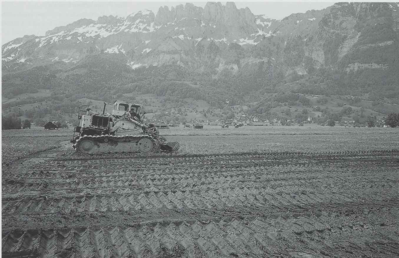
Für das Abtragen der nährstoffreichen obersten Humusschicht kam ein schweres Kübel-Raupenfahrzeug zum Einsatz. Das Abhumusieren schafft günstige Voraussetzungen für die längerfristige Wiederherstellung von Riedflächen.

schaft zu verstehen ist) massiv verändert. 10 Rund 54 Prozent der landwirtschaftlichen Nutzfläche werden als Naturwiesen bewirtschaftet, etwa 46 Prozent werden als Äcker und Kunstwiesen regelmässig umgebrochen (Stand 1997). Infolge der intensiven landwirtschaftlichen Nutzung wies das Gebiet bis zur Realisierung der Aufwertungsmassnahmen einen nur sehr geringen Bestand an naturnahen Flächen auf. Sie beschränkten sich auf Windschutzanlagen, einzelne Kanalböschungen (Hochstaudenvegetation) sowie auf naturnahe Elemente, die im Rahmen des Pilotprojektes «Ökologischer Ausgleich» nach 1991 realisiert wurden (ein Weiher, einzelne Niederhecken, eine Aufforstung am Rande eines Windschutzstreifens, Ackerrandstreifen). Artenreiche, flächige Lebensräume, wie sie für das Gebiet vor der Meliorierung typisch waren, fehlten praktisch vollständig, insbesondere Riedwiesen, naturnahe Bachläufe, stehende Gewässer und offene Abzugsgräben.