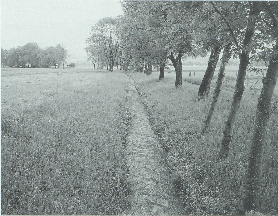
Vom Kanal zum Bach: Der schnurgerade Entsumpfungskanal vor der Renaturierung...