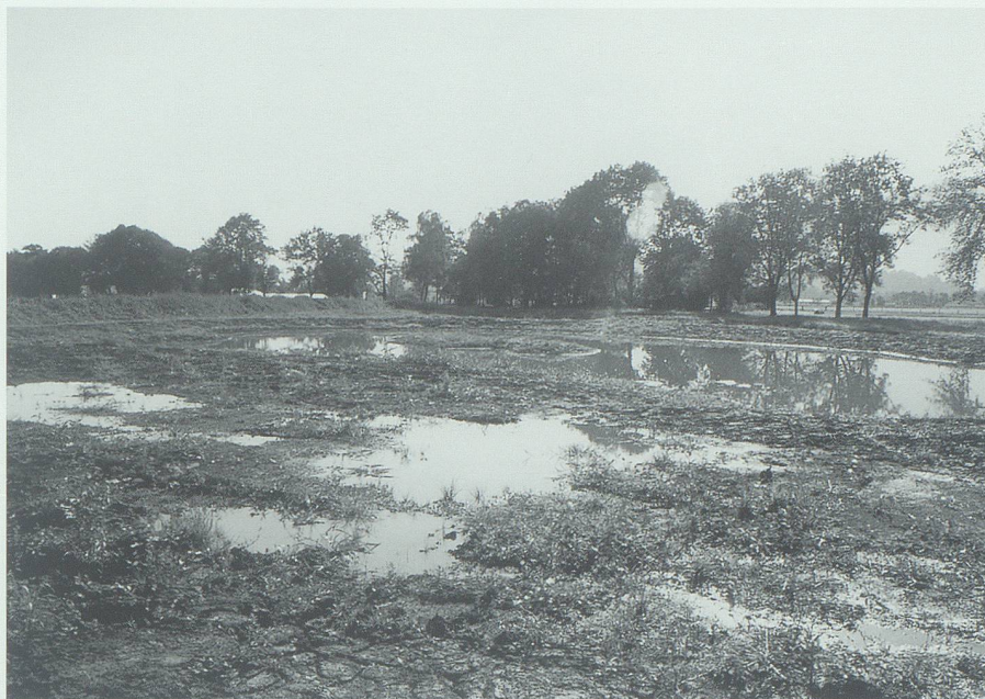
Flachgewässer und Schlickflächen im Umfang von insgesamt rund einer Hektare sind 1999 entstanden. Sie bieten neuen Lebensraum unter anderem für Amphibien sowie Rast- und Nahrungsplätze für durchziehende Watvögel.

Während Bachrevitalisierungen sonst häufig nur innerhalb des bestehenden Gerinneprofils verwirklicht werden können, bot sich hier dank des Einbezugs in eine der sechs grossen Kernflächen die eher seltene Möglichkeit, zusätzliches Land zu beanspruchen. Dadurch wurden grosszügige Ausweitungen des Gerinnes möglich, die der natürlichen Dynamik des Gewässers viel Raum lassen. Aus dem zuvor ein symmetrisches Profil aufweisenden Kanal wurde ein vielgestaltiger Bach mit bald steileren, bald flacheren Uferpartien, mit abwechslungsweise engeren Abschnitten, in denen das Wasser munter dahinsprudelt, und weiten Stellen mit gemächlichem Abfluss, mit Nebenarmen und Hinterwassern.