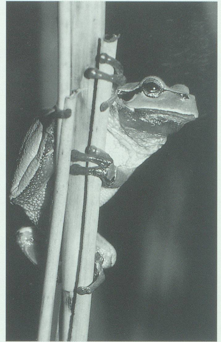
Ein erster Erfolg: Der Laubfrosch hat den Weg zu den speziell auch für ihn geschaffenen Biotopen bereits gefunden.

• Bemerkenswert und für die Situation im Gebiet typisch sind die Beobachtungen der beiden seltenen Arten Braunkehlchen und Feldlerche: Die mehrmaligen Beobachtungen von je einem bis zwei Exemplaren in der ersten Hälfte der Erfassungsperiode deuten auf Brutversuche hin. Das völlige Fehlen der beiden Arten ab Anfang/Mitte