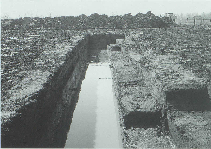
Naturnah und zugleich eine Erinnerung an eine frühere Nutzungsform: einer der fünf rekonstruierten Torfstiche. In kurzer Zeit werden sich hier vielfältige Lebensformen ansiedeln können.

cen, die die jahrzehntelange Intensivnutzung im Gebiet selber in Reliktbeständen überdauert haben oder die im weiteren Umfeld des Saxerriets noch vorhanden sind. Durch die Verbindung der grösseren Kernflächen mit linearen Vernetzungselementen werden die Zuwanderung und die Ausbreitung der verschiedenen Lebensformen ermöglicht und deren biologischer Austausch gefördert.