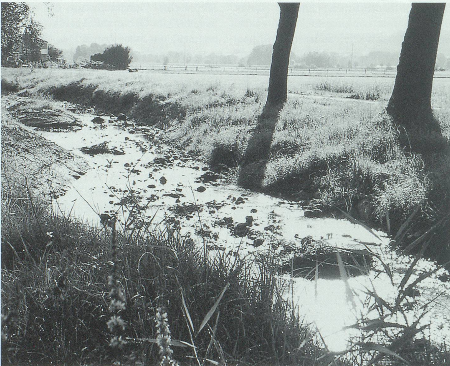
...und drei Monate später nach der Aufweitung und Umgestaltung des Gerinnes.

• Beobachtungen einzelner Arten zu Beginn der Erfassungsperiode bestätigen die Bedeutung des Gebietes als Rastplatz während des Vogelzuges. Daraus lässt sich zudem für verschiedene Arten – entsprechende ökologische Aufwertung vorausgesetzt – ein hohes Potenzial des Standortes als Brutgebiet ableiten.