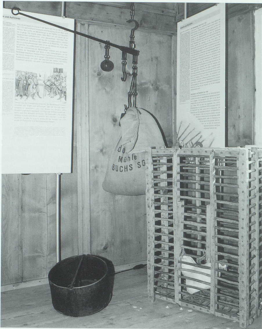
Kornmass, Fasnachtshenne und Stangenwaage erinnern an die Abgaben der Landvogtszeit.

als Sammler und Mäzen gebührend gewürdigt werden.