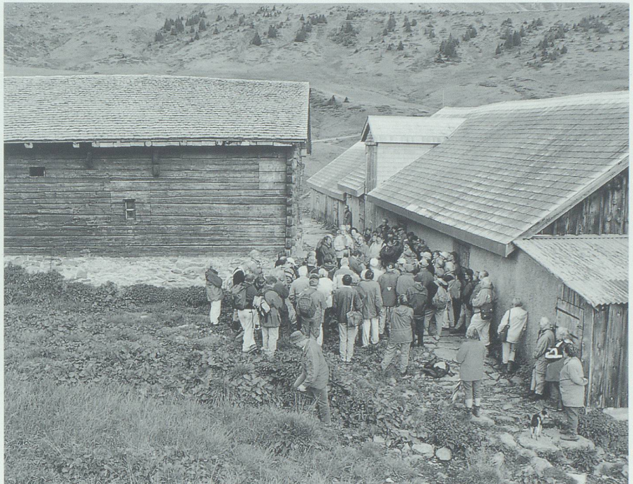
Die Exkursionen des Walser-Zyklus stiessen auf grosses Interesse. So liessen sich am 18. September 1999 über hundert Personen die Siedlungsgeschichte der Walser auf Palfris (hier beim Huis in Hinterpalfris) erläutern.

Seit geraumer Zeit macht uns die Erfassung und sachgerechte Lagerung der mittlerweile umfangreichen Dokumentationen Sorgen. Die zahlreichen Bücher, Schriften und Dokumente sind zwar erfasst, bislang jedoch bloss behelfsmässig an verschiedenen Orten gelagert und demnach für ein interessiertes Publikum nicht zugänglich. Dank eines grosszügigen Entgegenkommens der Firma Lippuner Klimatechnik, Grabs, zeichnet sich nun eine finanziell tragbare Lösung an sehr guter Lage ab. Vorgesehen ist, die geplante Dokumentationsstelle durch die HHVW und die Stiftung RMS gemeinsam zu tragen. Auch hier wird also eine enge Verknüpfung zwischen HHVW und RMS bestehen. Noch sind aber zahlreiche Fragen ungeklärt. So etwa die Finanzierung der