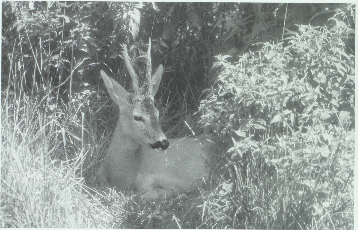
Auch er mag und braucht die erholsame Ruhe des Waldes.

Verjüngung des Bergwaldes sind die Folgen.