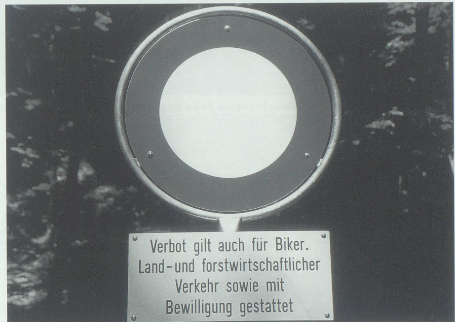
Der Erlass von Geboten und Verboten ist letztlich nichts anderes als die Folge von unbedachtem, uneinsichtigem oder rücksichtslosem Verhalten.

Wegen liegen gelassener Hundekot ist zudem unangenehm für andere Waldbesucher.