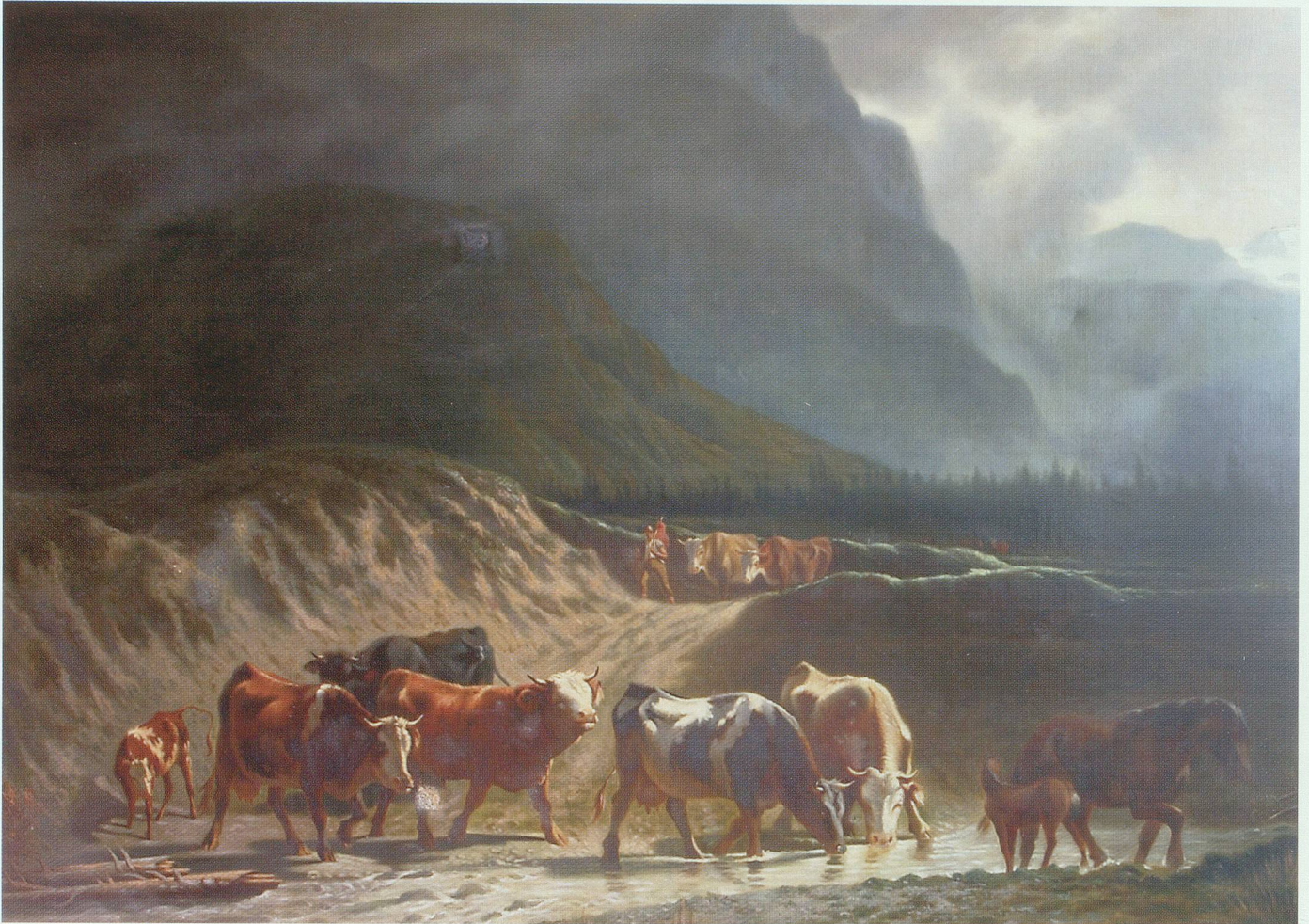
Der musisch begabte Keel war ein begnadeter Maler. Der Grossteil der von ihm hinterlassenen Bilder stammt aus der Zeit von 1838 bis 1851, in der er sich als Forstmann auf die Verwaltung der Waldungen des katholischen Konfessionsteils beschränkte. Gemälde in Privatbesitz.