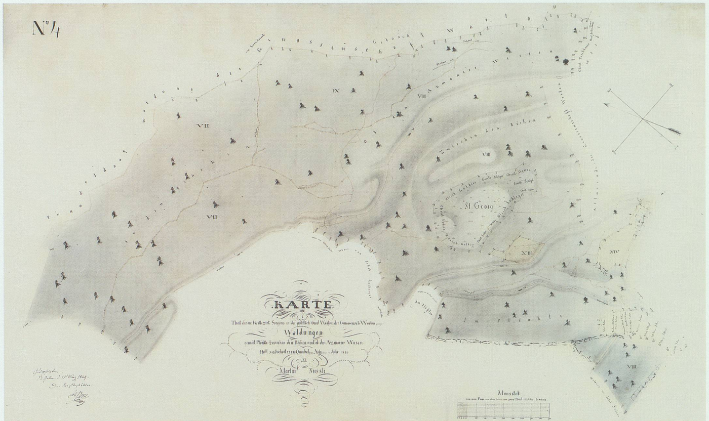
«Theil der im Forstbezirk Sargans in der politisch. Gmd. Wartau, der Genossensch. Wartau gehörigen Waldungen genannt Plänkle zwischen den Bächen und ob den Azmooser Wiesen.» Aufgenommen 1846; Genehmigungsvermerk von Johannes Bohl vom 15. März 1849. Im Staatsarchiv St.Gallen.

setzes rücksichtlich geregelter Kulturen und Nutzungen solcher Waldungen [jener der Gemeinden und Korporationen] eine allgemeine Anwendung keineswegs gefunden. Das Gesetz verlangt Vermessungen, Berechnungen und Wirtschaftseinrichtungen Behufs nachhaltiger Benutzung, was allerdings Zeit und Kostenaufwand erfordert. Bei den Waldeigentümern findet sich in der Regel hierfür wenige Neigung. Die betreffenden Verwaltungsräthe haben meist entweder selbst nicht die Überzeugung von der Nothwendigkeit der Sache, oder legen aus Scheu vor der Stimme ihrer Kommitenten, wie in Erwägung ihrer kurzen Amtsdauer, sonst nicht Hand ans Werk. Gesetzt, es wären auch diese Schwierigkeiten größtentheils zu beseitigen, so wäre es dennoch nicht möglich, im ersten Jahrzehnd, von Erlass des Forstgesetzes an, obbezeichnete Regulirung aller betreffenden Waldungen auszuführen, indem Zeit und Kraft der Bezirksförster und der bisher patentirten Forstgeometer zu beschränkt wäre.» Immerhin stellt die