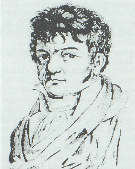
Heinrich Zschokke (1771-1848): Schriftsteller, Politiker und einer der bedeutenden Pioniere des neuzeitlichen Forstwesens.

wesens, des Schriftstellers und Politikers Heinrich Zschokke 6 , entnehmen: «Während die Hand des Fleißes jede Spanne urbaren Boden aufs höchste benutzte, selbst den Felsen mit Erde bedeckte, ihm Früchte abzugewinnen, lag in den Gebirgsgegenden des südlichen Deutschlands und der Schweiz der sechste, oft der vierte, zuweilen der noch größere Theil des Landes mit Gesträuchen fast mehr, als Wäldern bedeckt, ein ansehnliches und todtes Kapital da.» 7 Zschokke rügt damit also, dass man abgeholzte Flächen einfach sich selber überliess und für den Neuaufwuchs kaum etwas tat. Er geht denn auch ausführlich ein auf den «Wiederanbau der in schon vorhandenen Wäldern entstandenen Räumden und Blößen» und auf die «Wiederbeholzung kahlgeholzter Waldstriche, worauf von sich selbst kein gutes Holz mehr wachsen will». Und ganz im Geist ökonomisch-kommerzieller Überlegungen empfiehlt er, beim Anlegen solcher Waldungen «wird zuerst es darauf ankommen, daß man bestimme: Welche Holzart ist in der Gegend am nöthigsten? folglich am gesuchtesten und am besten bezahlt?» 8