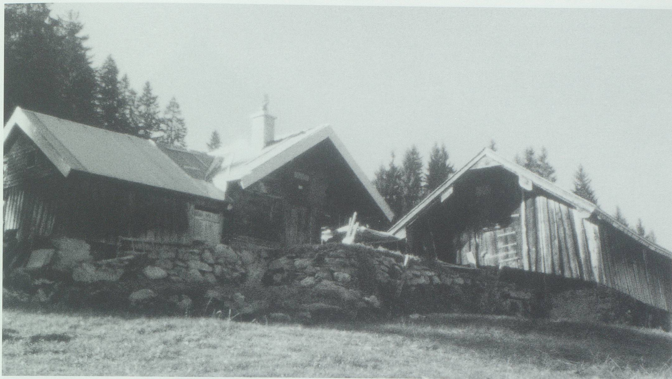
Die Algebäude auf der Gupfe vor dem Neubau des Viehschopfs in den neunziger Jahren.

zuzuhören und gefälligst auch über nicht Lustiges mitzulachen. Da wurde geprahlt mit Vieh, Ross und dem vielen in kurzer Zeit geführten Holz, da wurde über Gott und die Welt geredet, Dorf- und Bergklatsch ausgetauscht, über die Förster