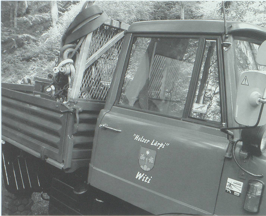
Mit 300 Franken Einsatz unter Josuas geschickten Händen aus «Schrott» wie «Phönix aus der Asche» erstanden: der Unimog mit dem Logo der «Holzer-Lärpi Witi».

Akkordarbeit zu verrichten, sondern geht die Sache gemächlich an und will auch die Waldromantik in freier Natur und die Geselligkeit unter Gleichgesinnten genießen – Freizeit pur eben!