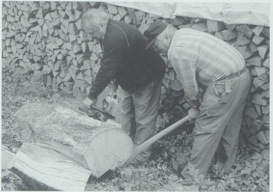
Auch das Abholz, die «Heierlig», wird mit der Motorsäge zerkleinert und ergibt bestes Heizmaterial.