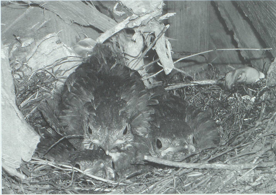
Zaungäste: Jungamseln, bald einmal flügge, betrachten aus ihrem sicheren Nest in der Spaltenbeige neugierig das Treiben auf dem Rüstplatz.