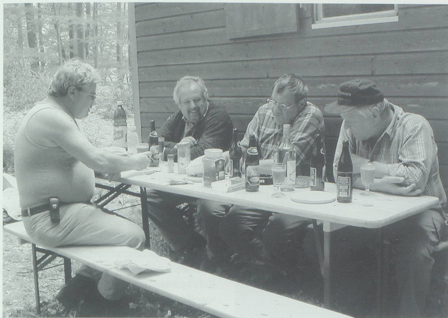
Arbeit macht Hunger: Trockenes Wetter und angenehme Temperatur erlauben die Mittagsverpflegung im Freien.

sechzig Zentimeter lange Tötze spalten. Diese Maschinen haben auch weniger Kraft als die grosse Spaltmaschine, die immerhin zwanzig Tonnen zu drücken vermag.»