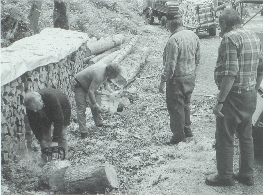
Die knorrigen Abholztötze werden eingesägt, mit gezielten Spalthammerstreichen bearbeitet und verladen.

ben, der ihm wegen irgendetwas Rache geschworen hatte, abgeladen worden war; die Spalten präsentierten sich als schöne Beige neben dem leeren Fahrzeug. Damit aber nicht genug: Als er seine Ladung mit Mühe wieder auf dem Karren hatte und ins Taldorf gefahren war, muss ihn ob der doppelten Arbeit der Durst wiederum geplagt haben. Er stellte sein Vehikel vor dem Schäfli ab und hielt dort