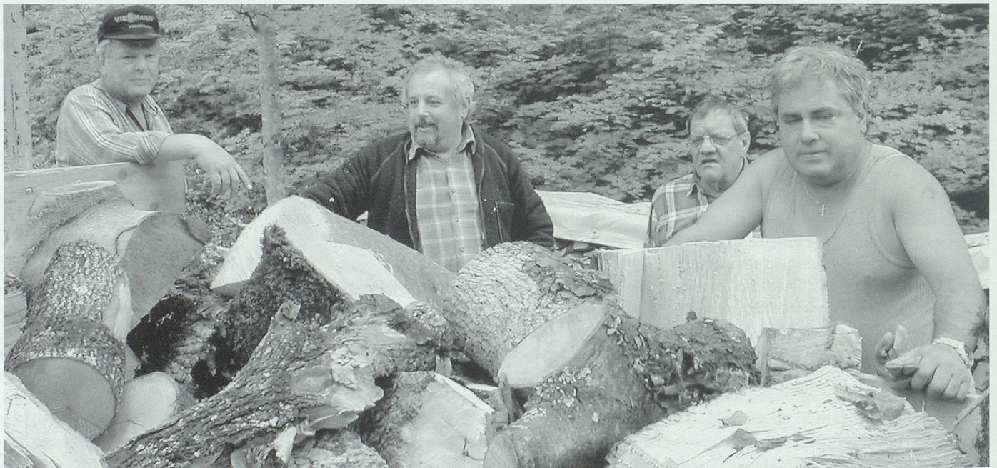
124 Spalten und Tötze sind verladen und bereit zum Transport; jetzt wartet die obligate Feierabendsitzung im Rebstock.