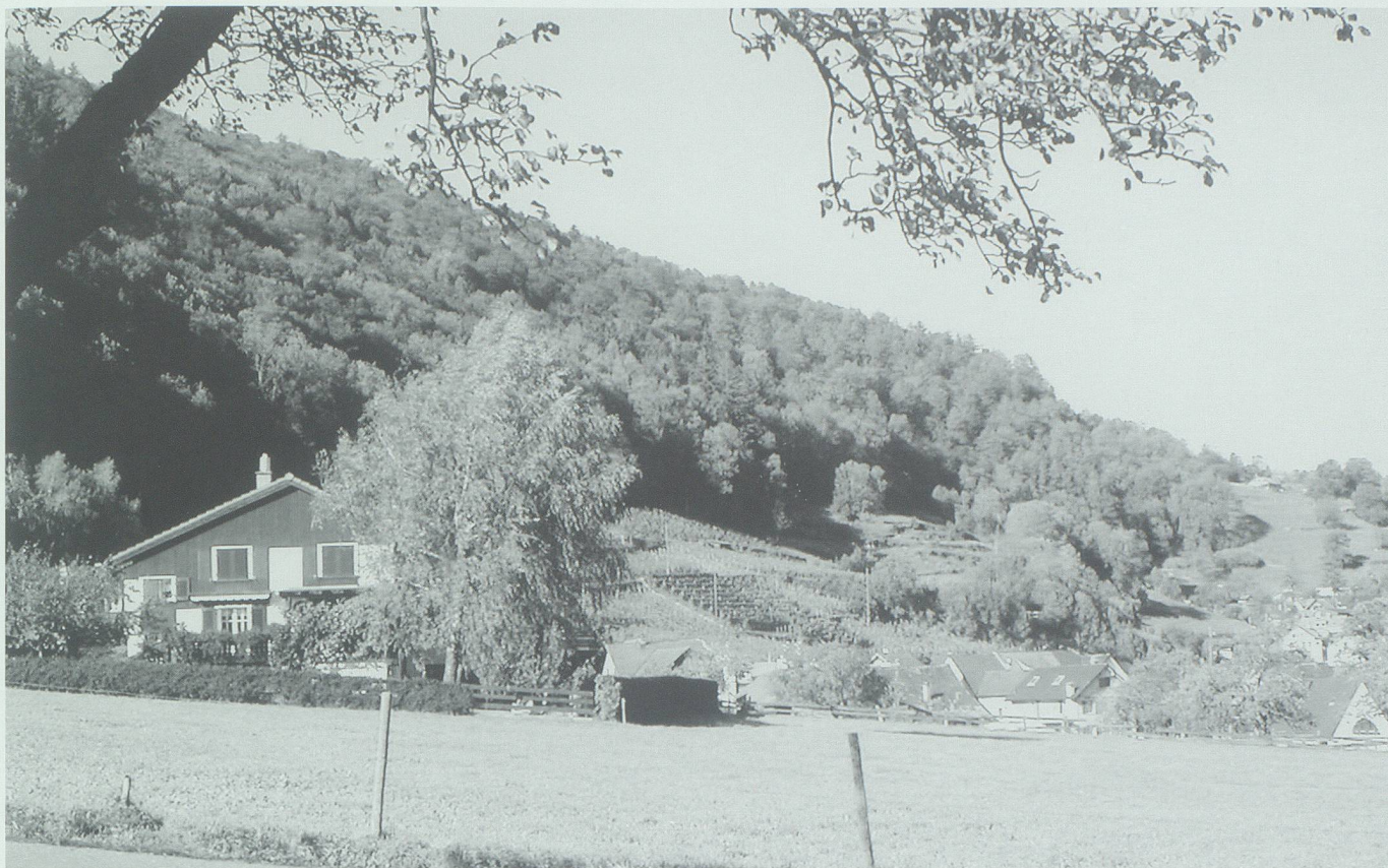
«Grünes Gold» für Christian Rohrer stammte auch aus dem Azmooser Eichwald oberhalb der Rebberge des Dorfes.