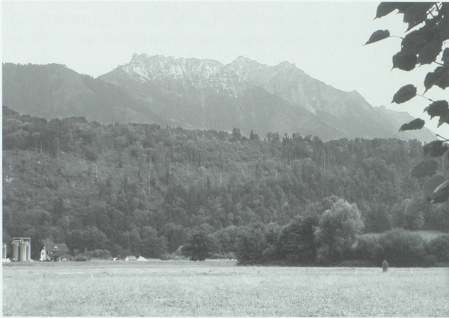
Der Schellenberg (Eschnerberg) und der Waldgürtel um die Drei Schwestern – Lieferanten für «das grüne Gold» des Christian Rohrer.

kam damit auch ein Schweizer Lieferant zum Zug. Im Jahr 1867 waren aber immer noch lange nicht alle Häuser unter Dach, denn am 20. Juni wurden vom Zwischenlager Buchs wieder rund 1000 Dachlatten nach Glarus gebracht.