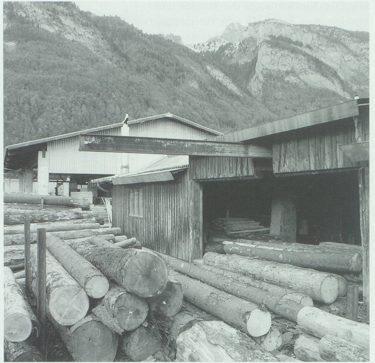
Eine der letzten als Vollerwerb betriebenen Werdenberger Sägereien ist die Sägerei Friedrich Göldi in Sennwald. Im Bild links das Vollgattersägewerk, rechts die Zuführung der Stämme auf die Säge.

Um eine einheitliche Sortierung und Mengenkontrolle für die Zwangsnutzungen der Kriegsjahre zu erreichen, wurde in jener Zeit überall die heute noch zum Grossteil gültige Art der Sortierung eingeführt. Dank der einheitlichen Einmessung wurde es möglich, Holz auch in weiter entfernte Gebiete zu verkaufen.