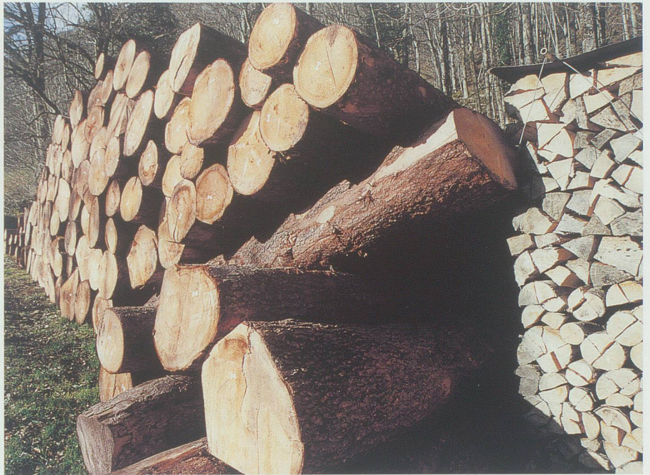
Zur Verwertung bereit: Trämel und Sterholz am Waldrand oberhalb Plona (Forstrevier Rüthi-Lienz).

Mit der stark wachsenden Bevölkerung musste der Nutzen auf immer mehr Bürger aufgeteilt werden. Deshalb mussten viele Ortsgemeinden den Holzteil kürzen