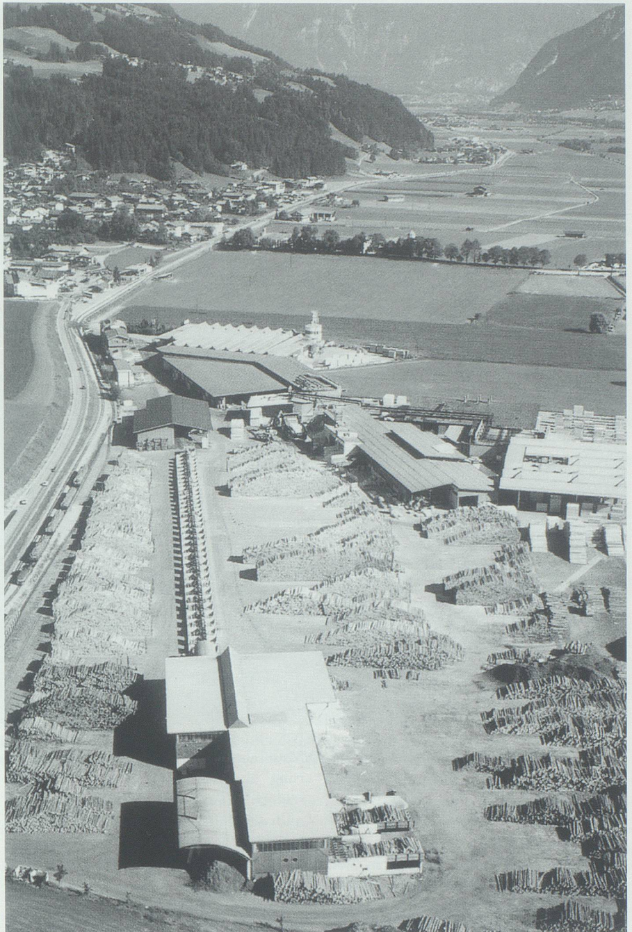
Das Spanerwerk der Firma Binder-Holz in Fügen im Zillertal (Österreich).

Ein grosses Manko besteht auch in der Weiterverarbeitung. Gerade in diesem Bereich würden gute Chancen für kleinere Betriebe liegen. Sie könnten mit Spezialprodukten im Markt Nischen füllen. Um in diesem sich schnell ändernden Markt bestehen zu können, braucht es aber innovative und bewegliche Betriebe. Ein durchschnittlicher Schweizer Betrieb verarbeitet heute pro Jahr etwa 1000 bis