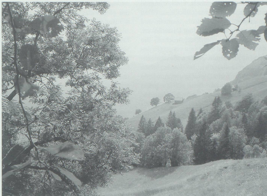
Der hilfsbereite Kobold am Walserberg, der durch den nicht geforderten Lohn – ein Paar neue Schuhe – vertrieben wurde, hauste auf Gresta.

Auf herzlose Weise beseitigte er diesen Übelstand für immer: Er schlug einen Grotzen 31 , löste die Rinde weg und legte sie, die innere Seite aufwärts, aufs Falwegli. Als dann das Kühlein wieder den verbotenen Weg ging und auf die schlüpf-