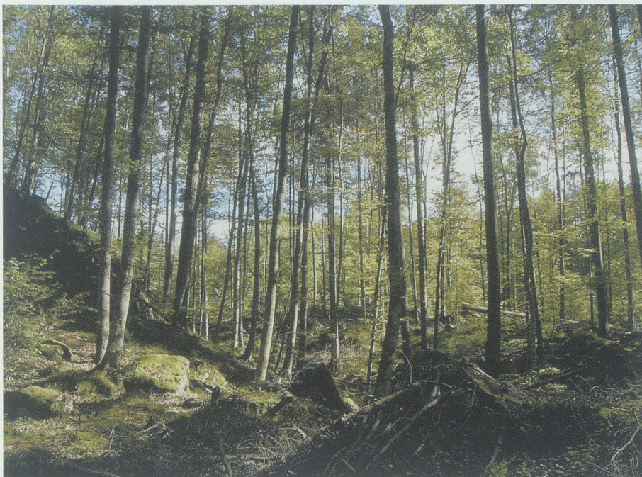
Auch im Salezer Schlosswald sollen sich einst Venediger als Goldsucher aufgehalten haben, die manche Kunst kannten, die andern verborgen blieb.

Jetzt warf er das Eichhörnchen in des Teufels Namen vor sich in den Schnee, stand ihm mit dem Schuhabsatz auf das Köpfchen und zerdrückte es: «Da hast du den Lohn, du unverschämtes Aas!» Er musste sich setzen und schnaufte eine ganze Weile tief.