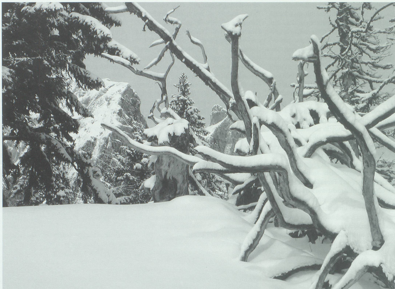
Die unheimliche Begegnung zwischen dem Chamm-Joas und einer Hexe in Gestalt eines Eichhörnchens trug sich im Gebiet Elabria-Paschga zu.

durch die Tobel und zündet den Marchenrückern, den gefallenen Frauen 24 beim Waschen ihrer Kindbettwäsche und den Sauen beim mitternächtlichen Tanz. 25