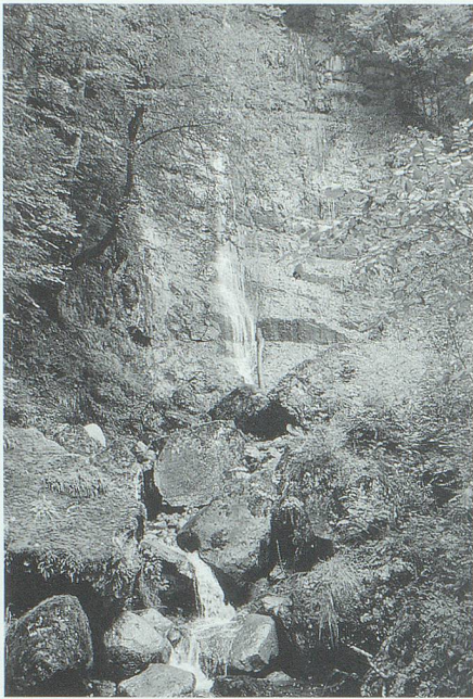
Der nächtliche Reiter am Geissbachfall im Buchserbach-Tobel sühnt als Spukgestalt den ungestraften Mord an seinem Köhler-Kumpel.

In Grabs wird erzählt, dass einmal ein Soldat aus Werdenberg, der Handgeld für fremde Kriegsdienste genommen hatte, mit einer Hexe auf einem Besenstiel aus Haselholz nach Grabs geflogen sei, sich am andern Morgen aber wieder auf seinem Posten in Holland befunden habe.