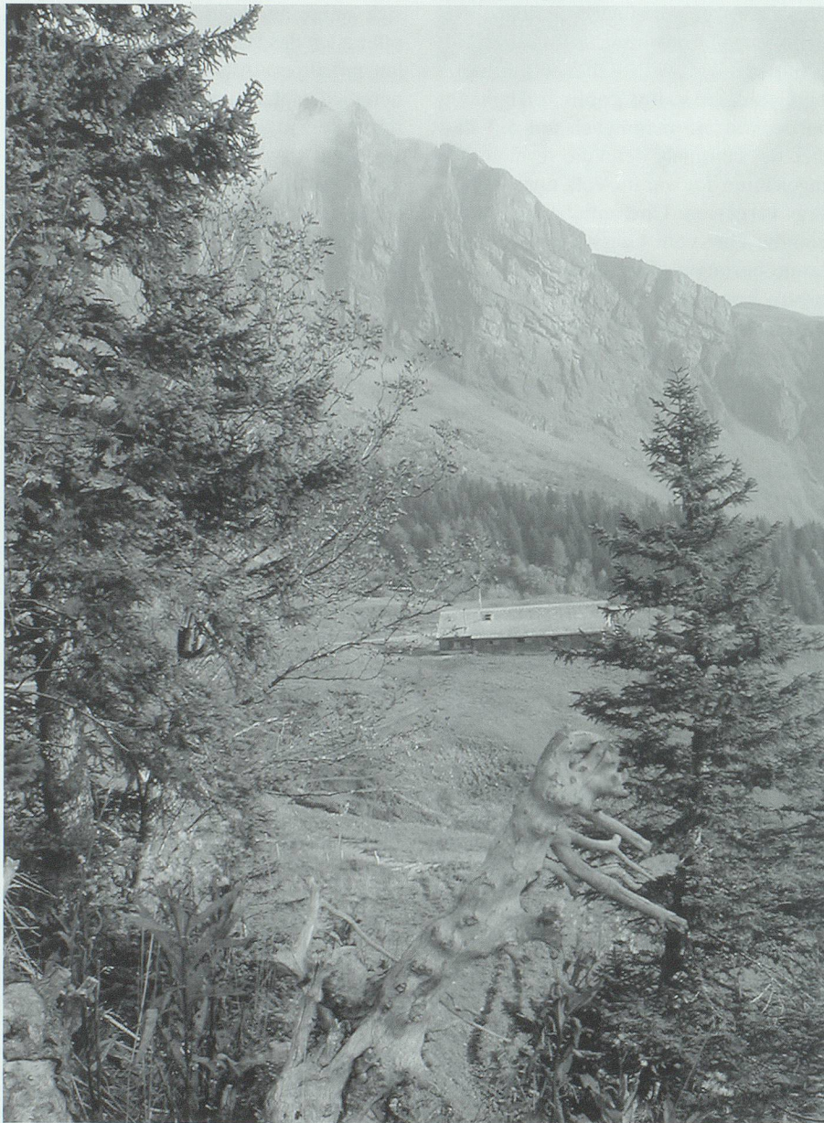
Das Dach des Scherms auf Elabria drohte einzustürzen, als der junge Chamm-Joas seinen Trag Eisen darauf abstellen wollte.

Im Vordergrund der Begegnungen mit dem Grääggi stehen wohl die zahlreichen Irreführungen. Die mit ihm gemachten Erfahrungen lehren die Zuhörenden, die Neugier im Zaum zu halten und sich nicht mit ihm einzulassen. Wer dies missachtet, den verführt das Grääggi und schadet ihm. 20