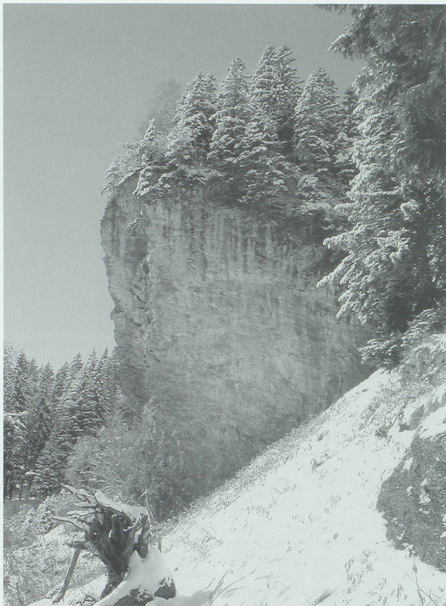
Noch immer schaut der versteinerte Hans Joas, ein markanter Felsblock in der Flida, traurig auf sein Pejadam hinunter.

liess das Gericht verstummen. Der Joggi drehte sich um, stieg die Treppe hinunter und kehrte mit dem am Rathaus angelehnten «Stock» in der Hand den steilen Spinaweg hinauf nach Hause zurück. 44