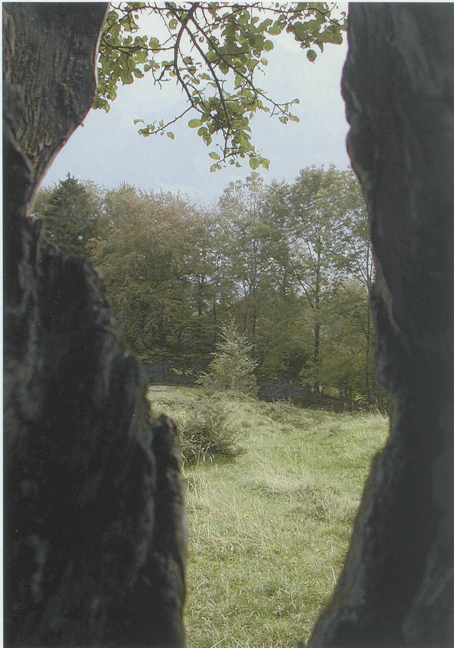
Durchsicht durch einen hohlen Holzapfelbaum in der Steighalde (Wartau): War hier der Baumplütscher am Werk?

das andere mache er schon selber. In einem Jahr sei es dann bereit, dann richte er dem Drachen das Gitzi in den Rachen, das wolle er probieren. – Der Rat gefiel allen.