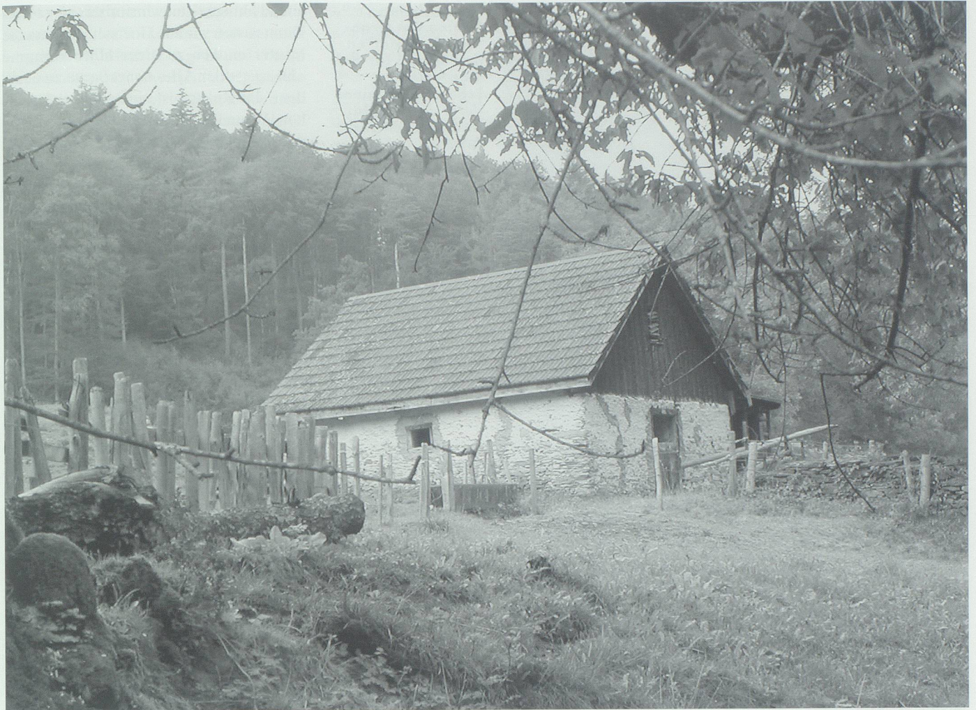
Beim Böschen, dem früheren Runggalu, schläft noch immer ein fürchterlicher Drache, der das stolze Dorf Azmoos bedroht. Wehe, wenn er eines Tages aufwacht!

Er blies so stark und so lange, dass er tot niedersank. Katharina, des Pfarrers Köchin, hörte und erkannte die Stimme ihres Geliebten, sprang in die Kirche und meldete den Betenden, was sie vernommen hatte. Die Männer eilten mit Hellebarden und anderen Kriegswaffen hinauf und nahmen den Toggenburgern nach blutigem Streiten das geraubte Vieh wieder ab. Die Stätte, wo dieser Kampf stattgefunden hat, heisst heute noch Schlachtboden. Noch lange nachher soll man dort alte Waffen gefunden haben. 60