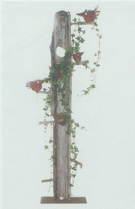
Eine Dachrinne als Vogelruheplatz – für einmal aus einer anderen Perspektive.