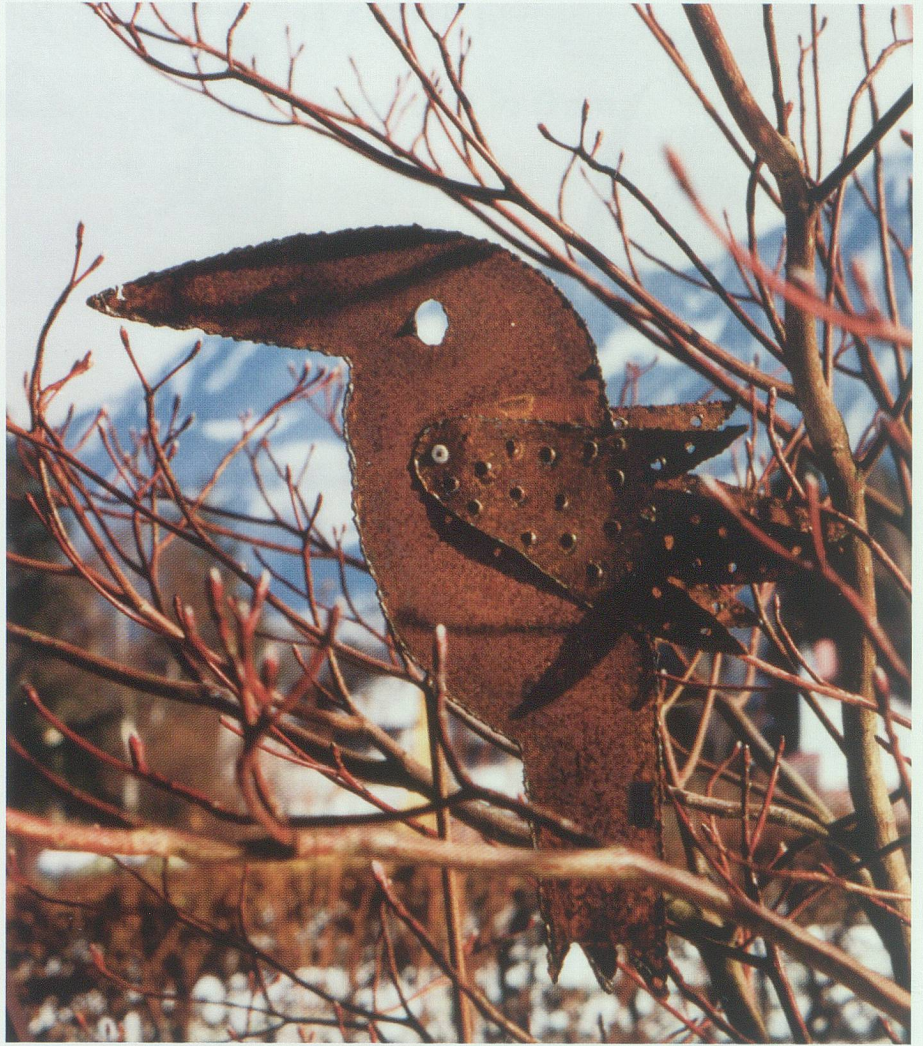
Der Futtervögel – Nicles Wahrzeichen.