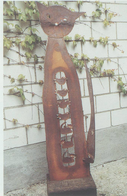
Die schwangere Vogelräuberin.