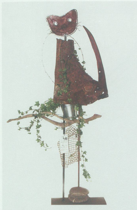
Die Rheinkatze – fast alle Teile sind Rheinfundstücke eines einzigen Tages.