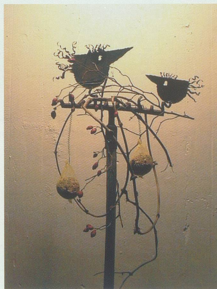
Zwiesprache auf dem Futterrechen.