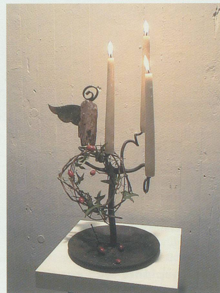
Beflügelte und illuminierte Mistgabel.