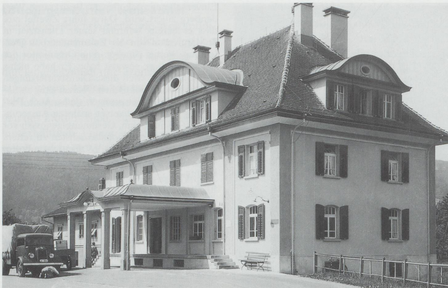
Das alte Zollamt von St.Margrethen: Eine wichtige Drehscheibe in der Flüchtlingsaffäre.

sönliche Bereicherung nachgewiesen werden können. Bitter für beide Angeklagten war, dass der Vorwurf der Bestechlichkeit niemals eindeutig entkräftet wurde. Kein Wunder, hielten sich Gerüchte darüber noch jahrelang. 21 Wir werden uns daher der finanziellen Lage Dutlers, soweit anhand der nur spärlich vorliegenden Belege überhaupt noch möglich, später zuwenden.