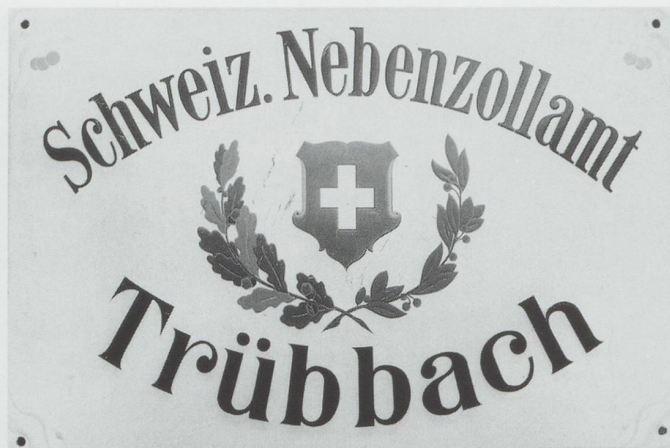
Die kleinen Zoll- und Nebenzollämter am liechtensteinisch-werdenbergischen Grenzabschnitt sind in der Zwischenkriegszeit, als Liechtenstein schweizerisches Zollanschlussgebiet wurde, aufgehoben worden.

Mit dem Vergleich kam Dutler zwar um eine Verurteilung wegen Amtsehrverletzung herum, ansonsten war das Resultat jedoch niederschmetternd. Auch die Berufung auf seinen früheren Vorgesetzten Grüniger half nichts. Rechtsanwalt Schwendener schreibt: «Grüniger ist in der Sache allzusehr interessiert, als dass sein Zeugnis irgendwie entscheidend ins Gewicht fallen könnte.» 34