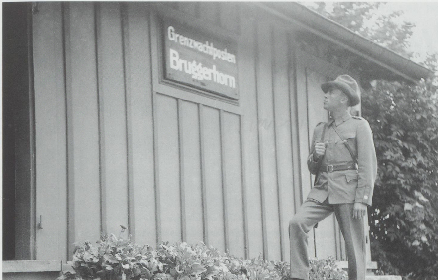
Ausser dem eigentlichen Zollamt St. Margrethen bestanden auch Nebenzollämter (zum Beispiel Monstein-Au) sowie Grenzwachtposten wie in Bruggertorn. Aufnahme nach 1937.