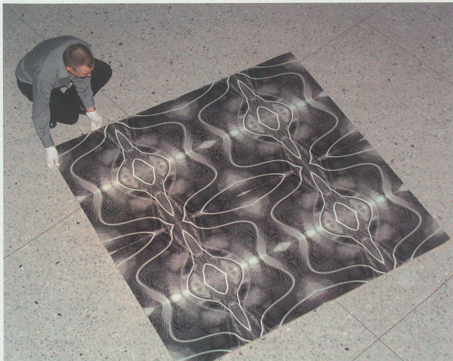
Fast ein Vexierbild: Zur Ausstellung «Wasser-Landschaften» im Jahr 2004 hat Sepp Köppel seine Fotografien erstmals digital bearbeitet.

schaften» (2004) konnte Köppel einen schönen Batzen an diese Institution überweisen.