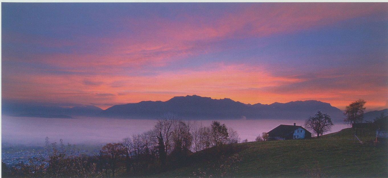
Morgen am Berg.

Da freut es ihn natürlich, dass er an der Berufsmittelschule des Berufs- und Weiterbildungszentrums Buchs Foto-