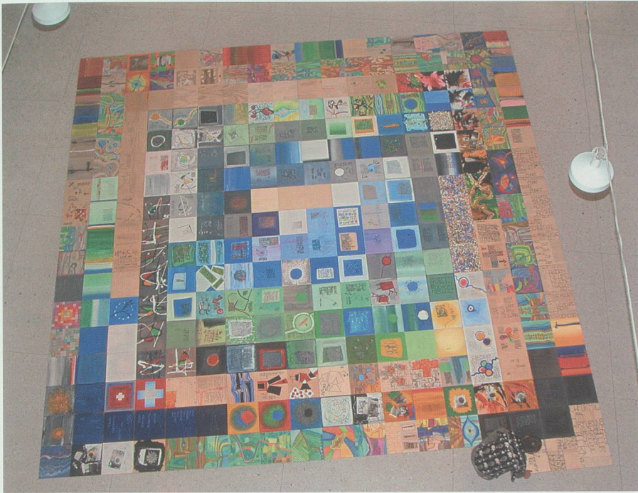
52,85 Quadratmeter Tagebuch: Sepp Köppel beim Auslegen der 366 Tafeln im BZB-Licht-hof in Buchs.

in Koteys Geburtsstadt Accra die Schul- und Berufsbildung. Auch aus dem Verkauf an der Ausstellung «Wasser-Land-