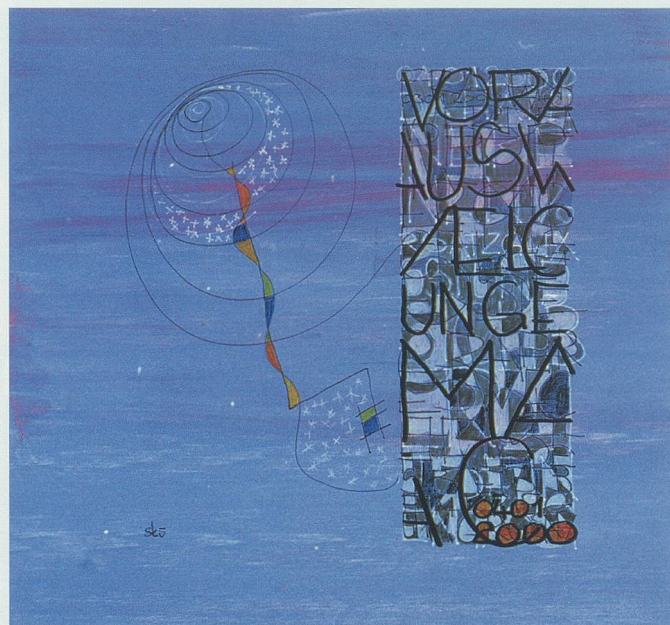
Ein Tag im Jahr 2000: Eine der 366 Tafeln, die zu einem übergroßen Tagebuch gehört hat.