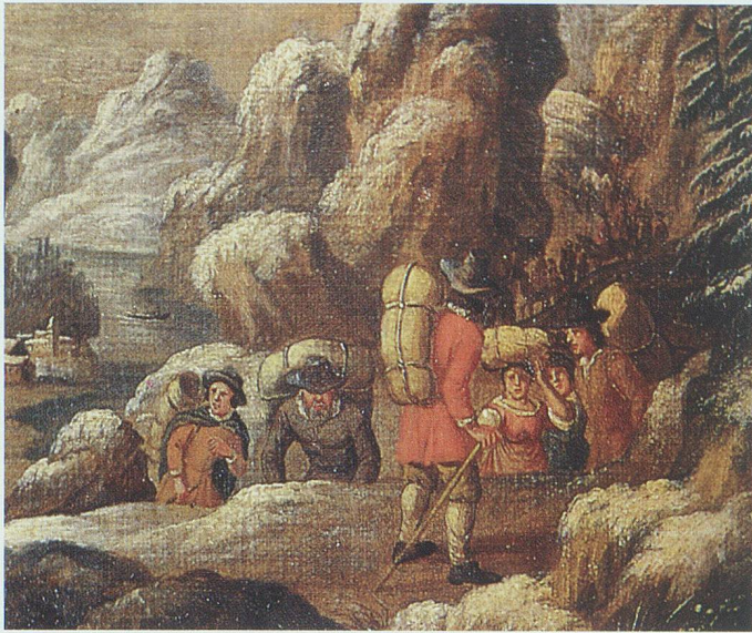
In Ermangelung von Saumpferden gelangte der «verkaufte Kernen» während der Hungersnot von 1770/71 durch Trägerkolonnen von Kleven (Chiavenna) über den Splügenpass in die Ostschweiz.