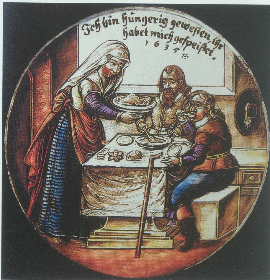
Barmherzigkeit und Nächstenliebe gegenüber Hungernden wurden durch die Abgabe von Suppe, Mus und Brot bis in die Neuzeit gepflegt. Glasmalerei aus dem 17. Jahrhundert.

Gänzlichliches Missraten der Ernte führte 1438 wiederum zu einer grossen Teuerung. 11 Aus dem Hitzesommer 1474 ist ein eher seltsames Phänomen überliefert, das wieder als «Theuerung» einer Mangelzeit vorangegangen war: Infolge der lang anhaltenden Dürre trockneten die Brunnen und Bäche aus, so dass «die Mühlen still standen, ob schon überaus viel und gutes Korn ge-