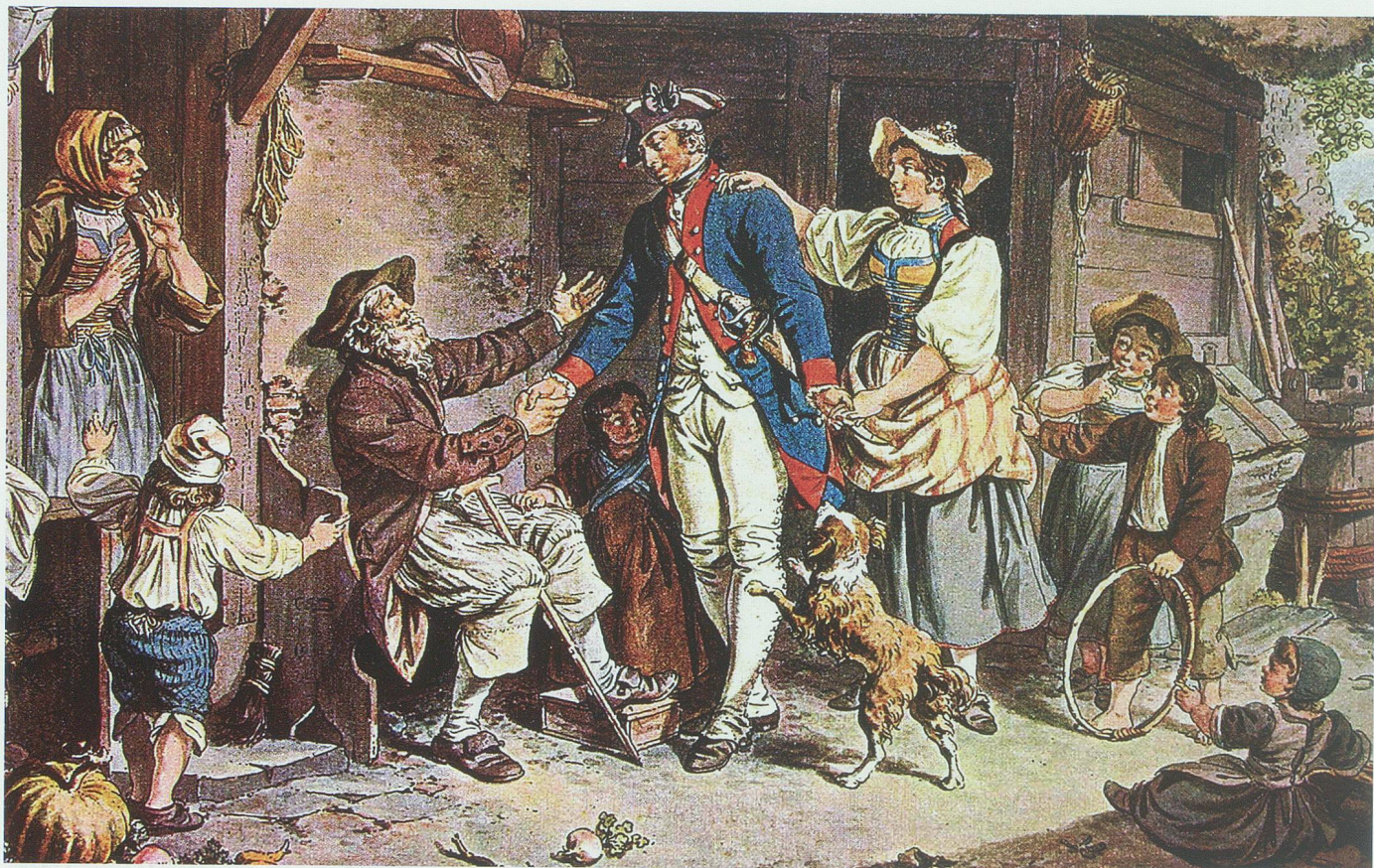
Ende des 17. Jahrhunderts betrachtete mancher Hungernde die Dienste um fremden Sold als Segen. Heimkehr eines Schweizer Gardisten aus französischen Diensten. Ausschnitt aus einem kolorierten Kupferstich von Siegmund Freudenberg (1745–1801). Kunstmuseum Basel