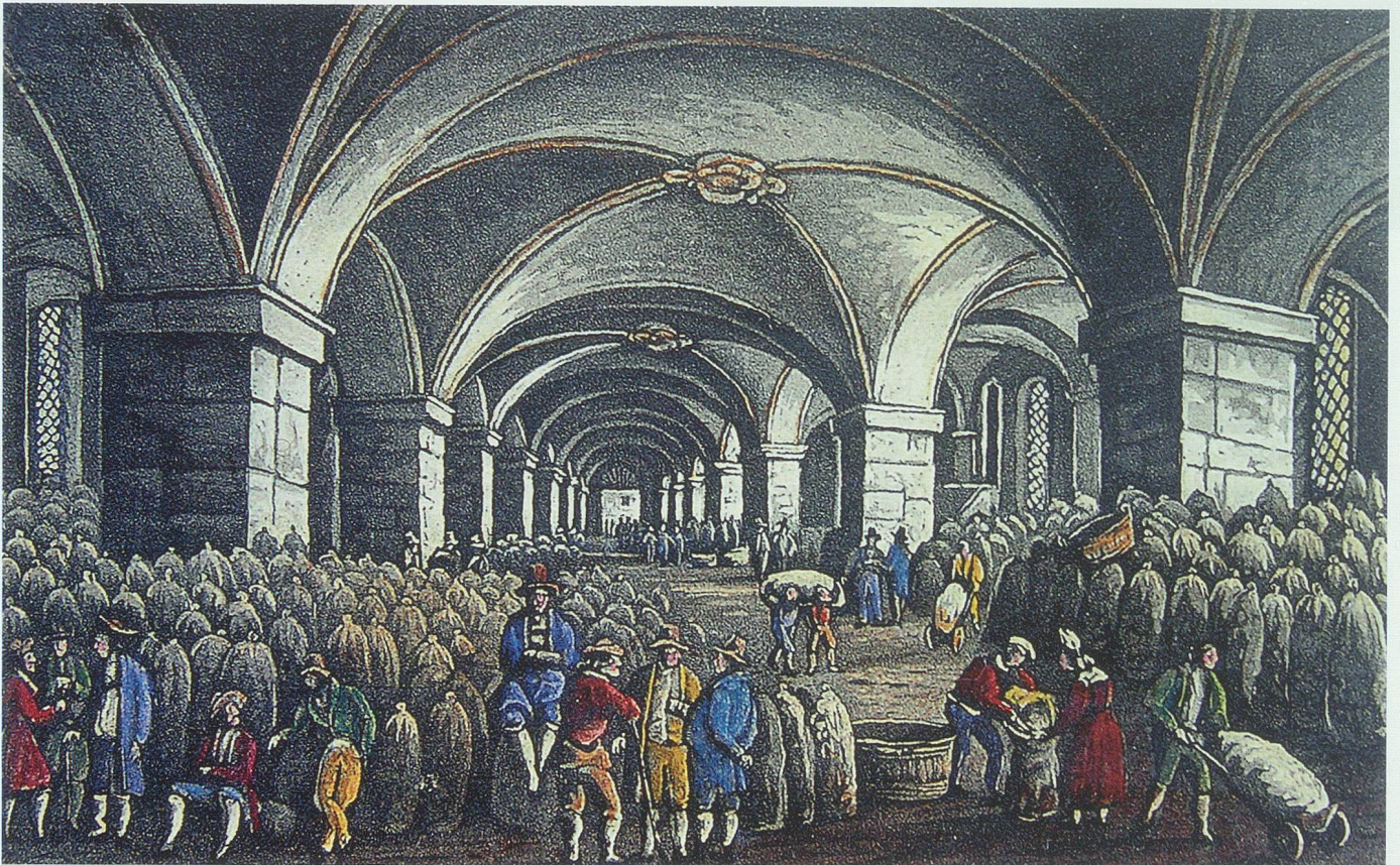
Schon 1748 hatte Abt Coelestin das Kornhaus in Rorschach erbauen lassen, um für die Vorrathshaltung Platz zu schaffen. Aquatinta von Johann Baptist Isenring um 1835. Bild aus Baumann 2003

In etlichen Gegenden herrschte die Not fürchterlich, die Leute wurden vor Hunger schwarz und mager; sie hatten keine Kraft mehr zum Arbeiten und nährten sich mit Nesseln und Heu. Die allgemeine Entkräftung, die die Betroffenen zunehmend apathisch werden liess und in manchen Fällen – oft sogar