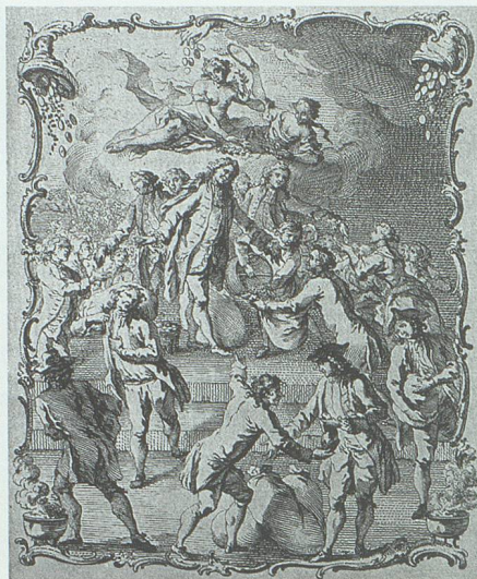
Kornverteilung während der Hungerkrise von 1771: «Denkmal ächter schweizerischer Frömmigkeit» – ein zeitgenössischer Kommentar, der der Wirklichkeit allerdings kaum entspricht.

Zu Recht aber gebührte dann dem Jahr 1811 das Prädikat eines Segensjahres, wodurch es sich unter der Bezeichnung «Eilferjahr» erhalten hat. «Zwar beunruhigte ein in der Nacht des 27. Februar erfolgter Erdstoss manches Gemüth, welches dagegen das frühzeitig eintretende Frühlingswetter mit allen Reizen des Lenzes erfreute. Die Getreidefelder und Obstbäume prangten im Sommer in herrlichster Fülle und reiften so frühe, dass Anfang Juli schon Brod aus diessjährigem Korn, neuer Most zu Ende Juli, und neuer Wein am 16. September genossen werden konnte. Die Qualität des Weins ge-