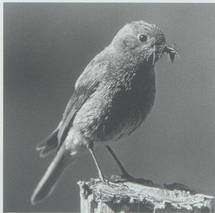
Der Hausrotschwanz kann bei uns immer öfter auch im Winter beobachtet werden.

Andererseits vermuten Forscher in Grossbritannien, dass der Rückgang der Ringdrossel, der auf der britischen Insel mit 60 Prozent in nur zehn Jahren besonders dramatisch ist, auf Futtermangel zurückzuführen ist. Zwar werden mehr Jungvögel als früher hochgezogen, doch die Verfügbarkeit der Nahrung im Juli und August ist für die Vögel durch den Temperaturanstieg stark zurückgegangen. Regenwürmer und Schnecken ziehen sich bei höherer Temperatur und Trockenheit vermehrt in den Boden zurück und können von den Ringdrosseln nicht mehr erreicht werden. So war die Konstitution der Vögel, speziell der Jungvögel, vor der Abreise ins Winterquartier