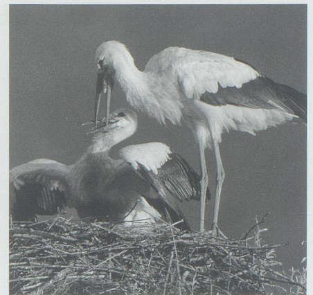
Seit über hundert Jahren brütete der Weisstorch 2007 wieder in Liechtenstein.

Die Klimaerwärmung macht aber auch dem Wintertourismus zu schaf-