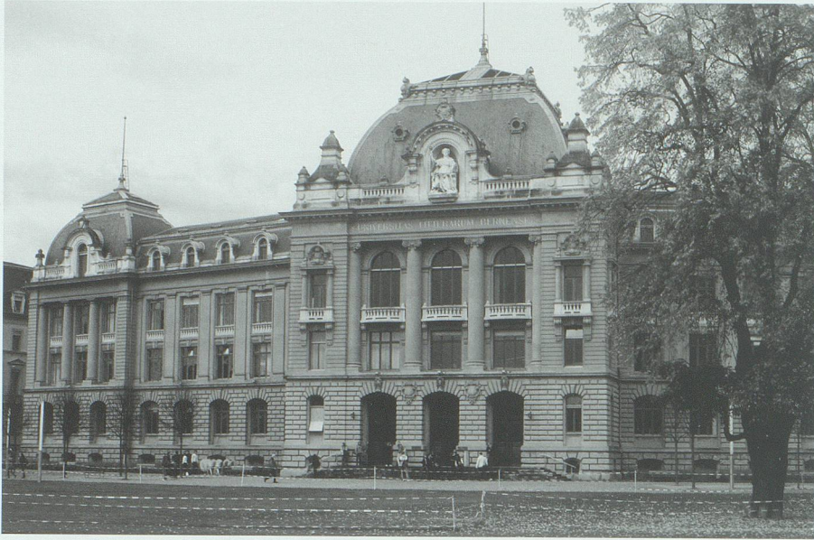
Ab 1873 Carl Hiltys Wirkungsort als Staatsrechtsprofessor: die Universität Bern.