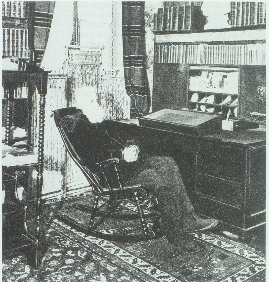
Carl Hilty in der Zurückgezogenheit der letzten Lebensjahre.

Interessant scheint zunächst, wie sehr uns – und dies ist eine vielleicht unerwartete Perspektive – die Gestalt und das Werk Hiltys an das Geistesleben Amerikas , vor allem Neuenglands, im