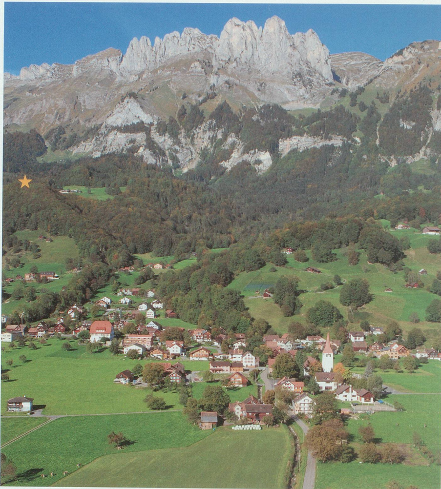
Um 1206/07 errichtete Heinrich II. von Sax die Burg Sax (mit Stern markiert) als Herrschaftssitz und bald danach die Eigenkirche Sax als Grablege. Luftaufnahme 2006

Klostervogtei im Werdenberg beruhte. Ausserhalb der Einsiedler Grundherrschaft in den Sennius und Salectum genannten Wäldern des Frühmittelalters errichtete er um 1206/07 die Burg Sax als Herrschaftssitz und später die Eigenkirche Sax als Grablege. Die Gerichtsvogtei eines Reichsklosters und der Burgenbau in einem Reichsforst brauchten wohl die Zustimmung der Staufer Kaiser, die zwischen 1208 und 1213 auch die Vogteien der Klöster Pfäfers und Disentis den Saxer Freiherren überliessen. Zu einem unbekanntem Zeitpunkt erhielten sie auch Gams, denn 1393 24 verkaufte Ulrich Eberhard I. von Sax mit seiner Burg auch Dorf und Kirche von Gams ( minen kilchensatz und das dorf, lüt und güeter ze