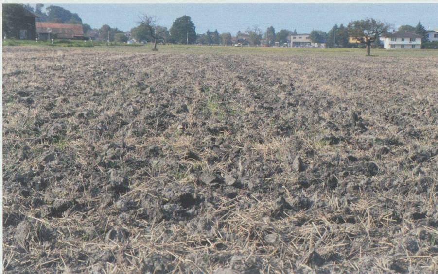
Endstation Monokultur oder Beginn einer neuen Praxis? Gerade im kleinteiligen Werdenberg kann Anbau klimaaktiv werden.

Energie zu erzeugen, Wasser zu konservieren, zu filtrieren und zur Wiederverwendung aufzubereiten. Es gilt, nicht nur ohne externe Stromzufuhr auszukommen, sondern sogar Energie für die Gemeinschaft zu produzieren.