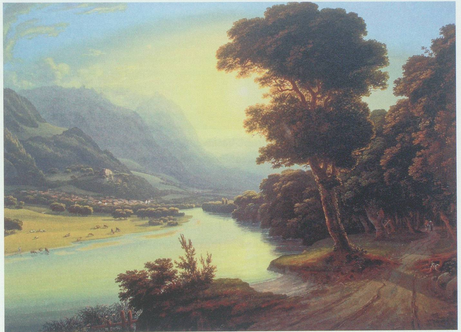
Das Alpenrheintal, wie es einmal war: Liechtenstein, vom Werdenberger Rheinufer her gesehen, gegen Süden: romantisiert, während die industrielle Revolution in Europa und Amerika schon voll im Gange war. «Blick auf Vaduz» 1833, Johann Jakob Schmid.

Mit seiner niedrigen Bevölkerungsdichte und einem hohem erneuerbarem Ressourcenpotenzial ist das Werdenberg in einer guten Lage, zu einer internationalen Modellregion zu werden – einer Klima- und Energieregion, so wie sie unter dem Schirm der Internationalen Bodensee-Hochschule im Forschungsprojekt «BAER» verfolgt wird. 1 Die Region Werdenberg-Liechtenstein hat die Chance, eine Oase der Vernunft zu werden, in der die Landwirtschaft wieder reichhaltig produktiv wird und erneuerbare Energien lokal gewonnen werden. In solch einer Oase kann dem Verbrauch nichterneuerbarer Energien Einhalt geboten werden. Anstelle der Öl-, Erdgas- und Kohleverbrennung und des investitionsverschwendenden, lebensgefährlichen Abbaus und der Spaltung von Uran muss auf erneuerbare Energien umgerüstet werden. Im Boden muss Humus massiv angereichert und der Bodenver-