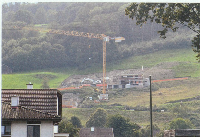
Das Bild zeigt, wie die Siedlung im Werdenberg in Gefahr ist, sich weiter und weiter auszudehnen: Hangbebauung.

der Flur oft fehlplatzierten, flachdächigen Bauten versuchen sie, aus dem grossen Katalog der Baumaterialien und mit modischen Formen neue Gebilde zu schaffen, bereit für den nächsten regionalen Architekturpreis oder für ein Titelblatt im Baujournal. Heute heisst es aber, die Schönheit nicht im Einzelkampf der Bauformen zu suchen, sondern sie wieder tief in der Land- und Siedlungskultur und deren Produktivität zu verankern. Die Basis für unser Leben bilden nun einmal der Boden, das Wasser und die Artenvielfalt – und gesunder Boden bedeutet Artenvielfalt. Viele Weiden sind heute verarmt. Anstelle von tiefer, humusreicher, von Mikrobewesen wimmelnder Erde fin-