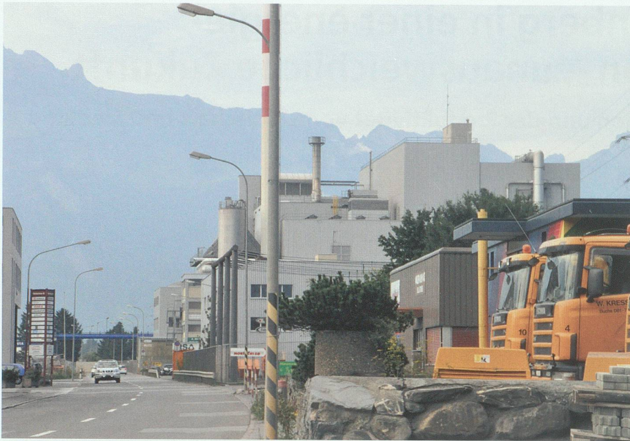
Das Alpenrheintal, wie es zu werden droht, basiert auf veralteten Vorstellungen eines «Fortschritts des Ausverkaufs»: Industriegebiet Buchs, nach Norden gesehen.

spielten lange eine zentrale Rolle in der Konstruktion einer sozialen Wirklichkeit. Die Landschaft der Heimat, oberflächlich gut bewahrt, hilft uns, die Tatsache der dramatischen Wende auszublenken – aber die Veränderungen, die sich jetzt anbahnen, greifen zu tief, um noch länger verborgen zu bleiben.