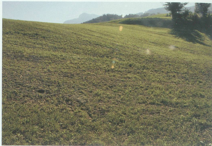
Die Wüste Weide: die moderne humusarme Landwirtschaftsbrache – zu oft gemäht, zerkaut, überdüngt.

Energiebedarfs. 3 Wegen ungelöster Sicherheits-, Entsorgungs- und Versorgungsprobleme sowie eklatanter Unfallrisiken bringt auch die Atomenergie keine Hoffnung. Nur erhöhte Effizienz, Minderung des Energieverbrauchs und ein massives Hochfahren der erneuerbaren Energieerzeugung können hier helfen.