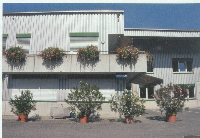
Liebevoll gepflegte Landschaft der Verzweiflung: Asphaltpflanzen im Werdenberg.