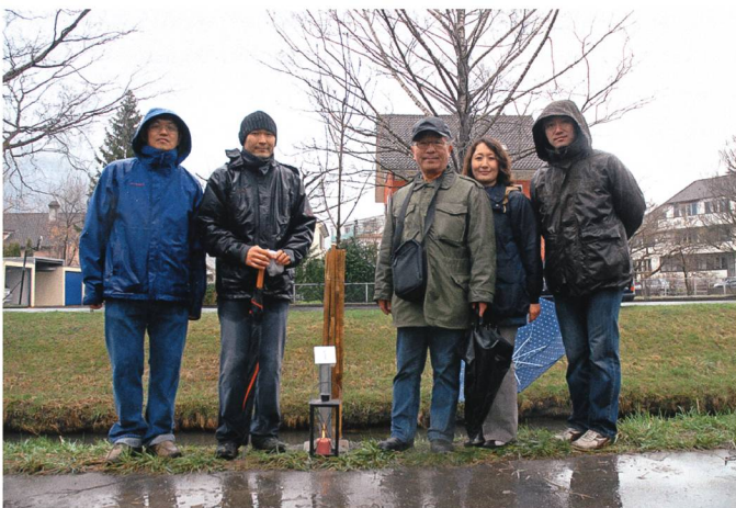
Die Japanische Zierkirsche der Japaner.