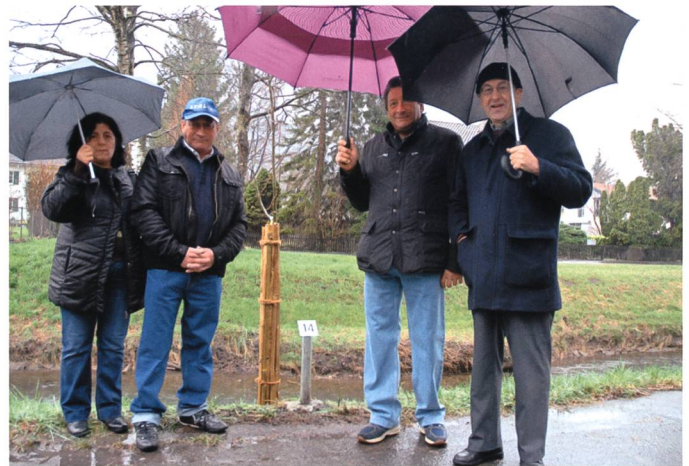
Die Sommerlinde (Tiglio) der Italiener.

gleichbedeutend mit der Lebensweise ihrer Volksgemeinschaft. 8