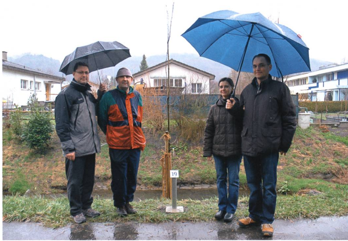
Die Ungarische Eiche (Tölgy) der Ungarn.