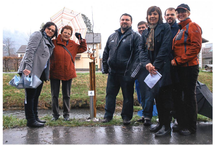
Die Rotbuche (Bukva) der Bosniaken.