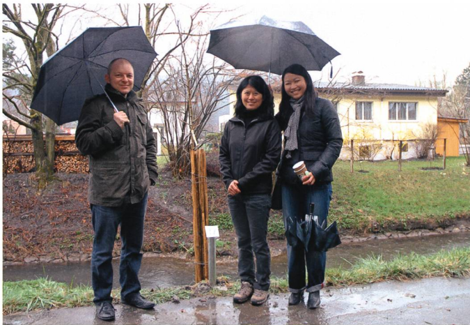
Der Ginkgobaum der Chinesen.