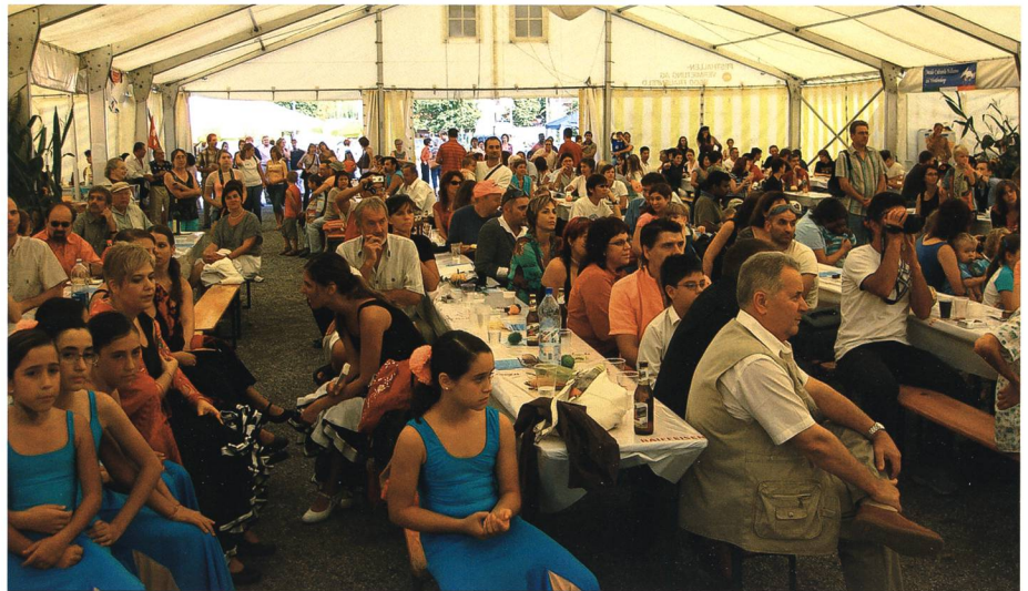
«Leben im Völkermeer»: Das Publikum genießt 2006 die Darbietungen von Migranten im grossen Hauptzelt auf dem Marktplatz beim Werdenberger See.

Innerhalb der öffentlich-politischen Debatte gehört die Migration zu den dominierenden Themen. Es wird insbesondere darüber gestritten, wie sehr die Integration durch die Behörden organisiert und finanziert werden soll. Die eine Seite des politischen Spektrums betont hierbei mehr das Fördern und befürwortet eine aktive, nützliche Strukturen zur Verfügung stellende Integrationspolitik zum Beispiel in Form von unentgeltlichen Sprachkursen. Auf der andern Seite wiederum wird ver-