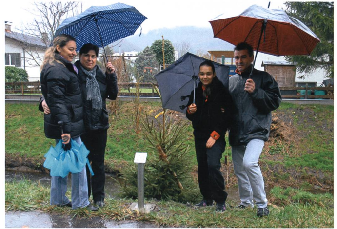
Die Rottanne (Pinheiro) der Portugiesen.

den, andere Treffpunkte auf, als die von der älteren Generation gegründeten Vereine. Sie bevorzugen Bars, Restaurants oder Diskotheken, die zum Teil auch von Migranten zweiter Generation geführt werden. Kartenspiele oder volkstümliche Anlässe verlieren für die älteren Secundas und Secondos an Attraktivität. 14