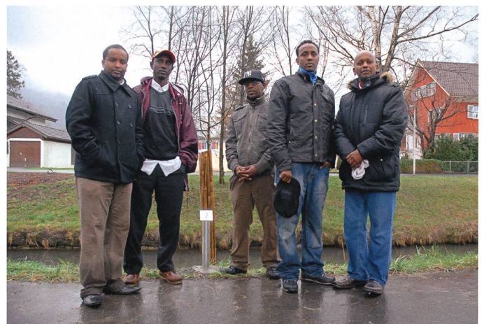
Die Zitterpappel (Xarar) der Somalier.