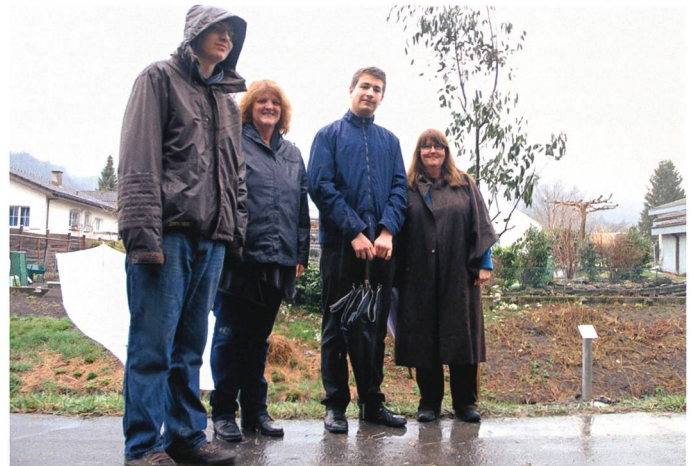
Der Eukalyptus (Eucalyptus) der Australier.

sein beim Dialog zwischen Wertegemeinschaften.