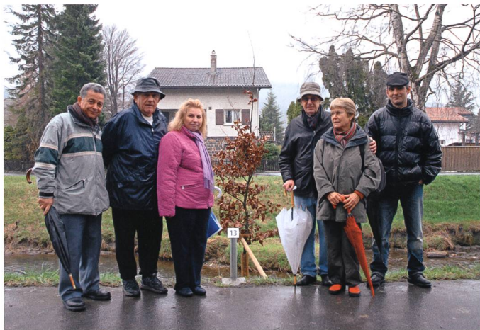
Die Rotbuche der Griechen.