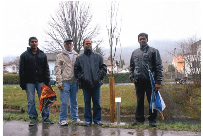
Der Spitzahorn (Maple) der Tamilen.

eine wiederum ist die gemeinsame Nationalität konstituierend, wie zum Beispiel bei türkischen Vereinen. Aber auch eine ethnisch begründete Identität wie etwa bei Kosovo-Albanern kann als Impulsgeber für den Zusammenschluss in einem Verein dienen. 5