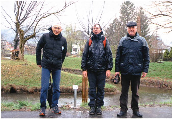
Die Zitterpappel (Peuplier tremble) der Franzosen.