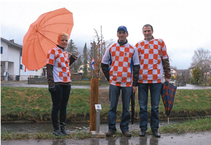
Die Zerreiche (Hrast) der Kroaten.