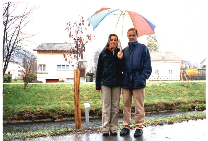
Die Traubeneiche der Serben.

als Mitglieder auf. Gründe dafür sind auf unterschiedlichen Ebenen zu finden. Fehlende Sprachkompetenz, kaum vorhandene Informationen über das lokale Vereinsangebot oder aber auch mangelndes Interesse an Vereinsaktivitäten sind nur einige Hürden für zugewanderte Personen, einem Schweizer Verein beizutreten. 3