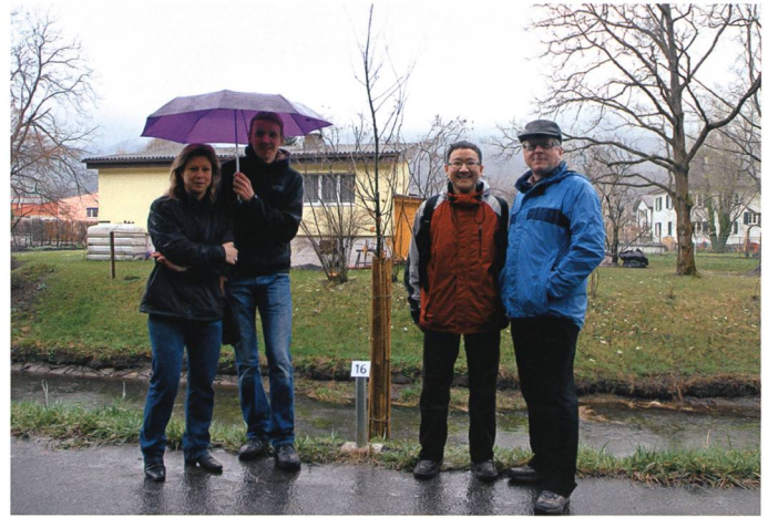
Die Stieleiche der Deutschen.