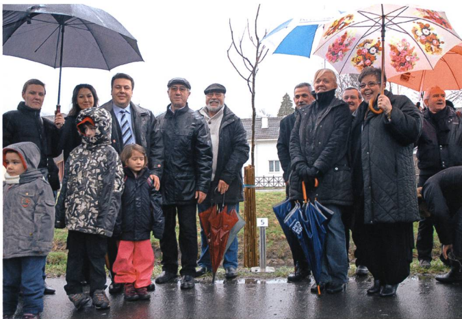
Der Walnussbaum (Ceviz) der Türken.