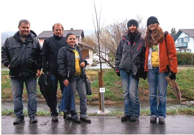
Die Sommerlinde (Tilia) der Brasilianer.