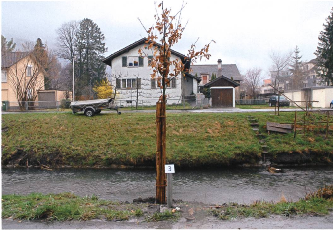
Die Stieleiche (English Oak) der Engländer.