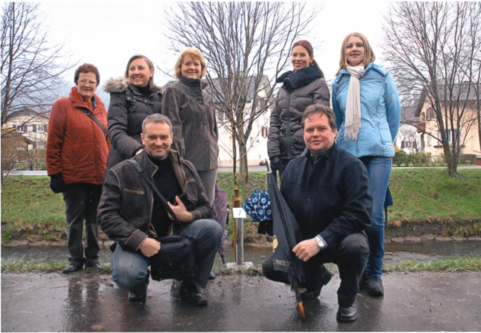
Die Weissbirke der Russen.