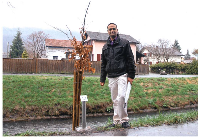
Die Zerreiche (Chajarat al-ballut) der Jemeniten.