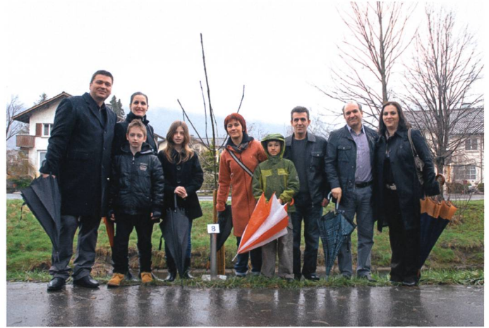
Die Esche (Frashri) der Albaner.