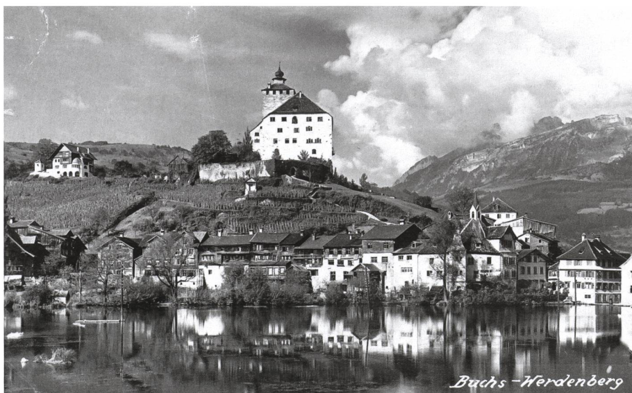
Schloss und Städtchen Werdenberg, seit jeher Postkartensujet und Identifikationsobjekt für die ganze Region. Postkarte um 1910.

«Statistik» tönt recht trocken und vor allem nach Zahlen. 4 Rahns Statistik enthielt zwar Jahrzahlen zur Datierung der Kunstwerke, ist aber doch nach heutigen Begriffen ein Inventar. Die Beschreibungen der einzelnen Bauten, zwischen zwei bis drei Zeilen und mehreren Seiten pro Gebäude, sind nach Kantonen und dann alphabetisch nach Ortschaften gegliedert. Aufgenommen