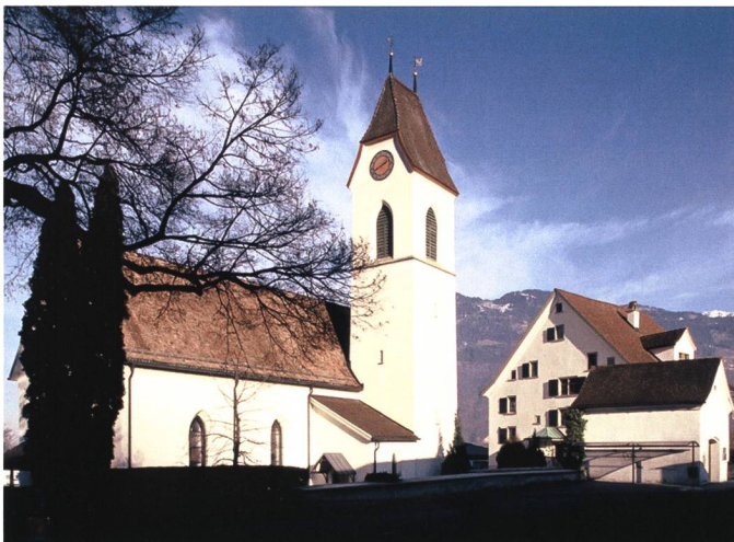
Kirchenbezirk Sevelen mit Beinhaus und Pfarrhaus.