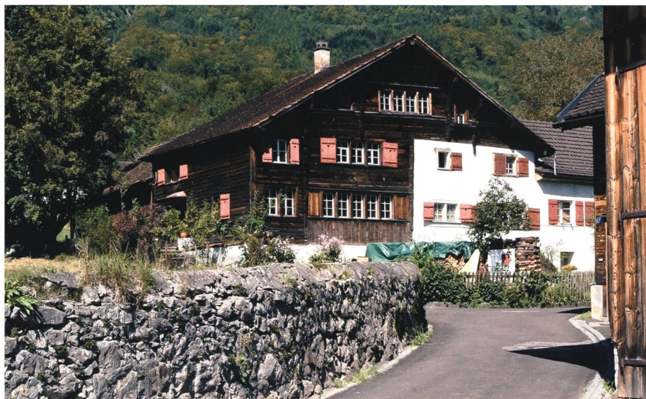
Jahrhundertealte Strickbautradition, hier in Sennwald, Läu 7.

Objekte verschafft. Dazu gehören neben kunsthistorisch interessanten Gebäuden samt ihrer Ausstattung auch Brunnen, Bildwerke sowie historisch interessante Verkehrs- und Militäreinrichtungen. Der Zeithorizont der