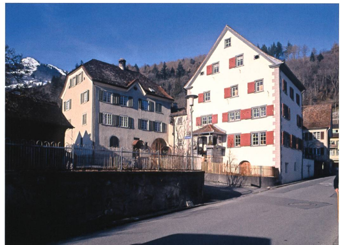
Imponierendes Ensemble an Steinbauten in Azmoos.