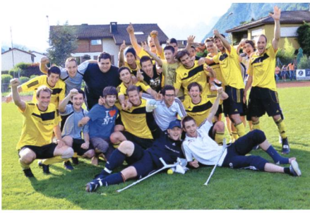
5. Juni: Die erste Mannschaft des FC Sevelen hat den Aufstieg in die 2. Liga geschafft und hat Grund zum Feiern.

5. Der FC Sevelen, der erst vor Jahresfrist den Aufstieg in die 3. Liga geschafft hat, wird Gruppensieger und steigt in die 2. Liga auf.