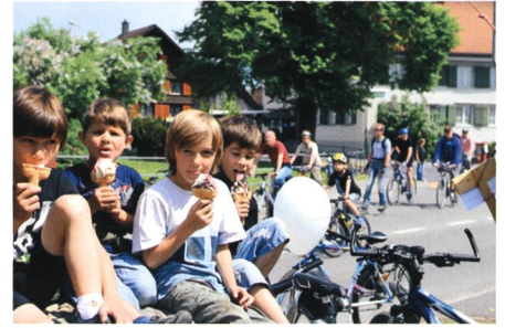
1. Mai: Herrliches Wetter lässt den 6. Slow Up Werdenberg-Liechtenstein zum grossen Fest des Langsamverkehrs werden.

10. Das Kantonsgericht St.Gallen eröffnet den Konkurs über die Genossenschaft