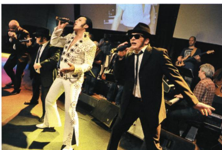
20. Mai: In der Lokremise in Buchs feiern die Music Productions Werdenberg Premiere mit «Elvis & the Blues Brothers».