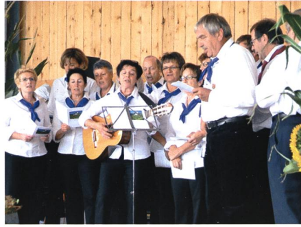
27. August: Beim ersten Wartauer Winzerfest tritt auch der Wartauer Winzerchor zum ersten Mal auf.