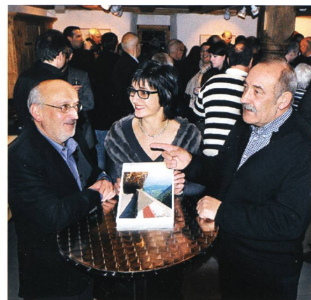
3. Dezember: Gut gelaunt präsentiert das Redaktionsteam den 24. Jahrgang des Werdenberger Jahrbuchs.

4. Die Interessengemeinschaft Einkaufszentrum Buchs (Igeb) und der Gewerbe- und Industrieverein (GIV) Buchs geben bekannt, dass sie sich mit einer gemeinsamen Organisationsstruktur befassen. Bis im Frühjahr 2011 soll den Mitglie-