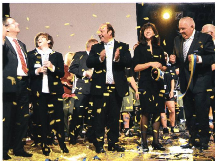
3. September: Zelebrieren da die Offiziellen zur Eröffnung der 16. Wiga ein bisschen die «Leichtigkeit des Seins»?