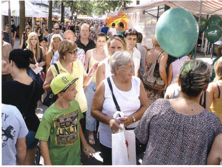
20. August: Die 29. Auflage des Buchserfestes lockt bei herrlichem Sommerwetter Tausende auf die Bahnhofstrasse.