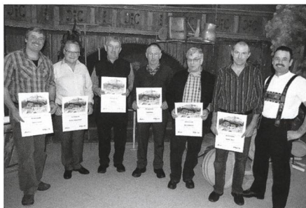
4. Februar: Die Alpsektion Sarganserland und Werdenberg-Rheintal würdigt treue Dienste für die Alpwirtschaft .

11. In Salez findet die Delegiertenversammlung des Werdenberger Feuerwehr-