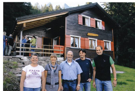
13. August: Der Ski- und Bergclub Gauschla kann den Abschluss des Umbaus der Clubhütte auf Elabria feiern.

13. Der Wartauer Ski- und Bergclub Gauschla weicht mit einem gemütlichen