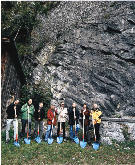
19. Oktober: Vertreter des Kantons und der Gemeinden Sargans und Wartau beim Spatenstich unter der Hohwand.

20. Es wird bekannt, dass die diesjährigen Nobelpreisträger für Chemie , Akira Suzuki und Ei-ichi Negishi, seit Jahren mit der Buchser Firma Sigma-Aldrich zusammenarbeiten. 2005 waren die beiden Professoren im Werk in Buchs zu Besuch.