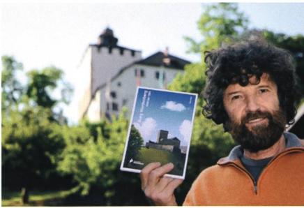
13. Mai: Das Buch «Burg Werdenberg 1200 bis 1280» von This Isler vermittelt neue Forschungsergebnisse.