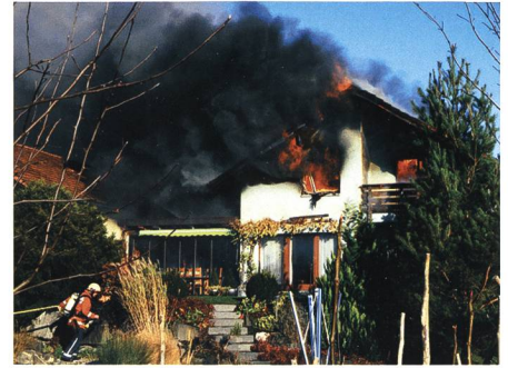
13. November: Beim Brand eines Wohnhauses in Rans wird das Obergeschoss vollständig zerstört.

14. Der Kabarettist Emil besucht sein «Göttikind» , das Werdenberger Klein-