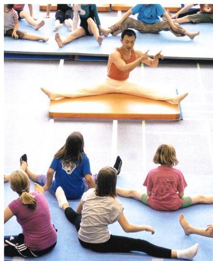
24./25. Juni: Mit einem zweitägigen Fest feiert Sevelen die Schul- und Sportraumerweiterung Gadretsch.

24./25. In Sevelen wird die Schul- und Sportraumerweiterung Gadretsch eingeweiht. Stargast der Feierlichkeiten ist der ehemalige Weltklassesportler Donghua Li, der mit den Kindern eine Turnstunde abhält.