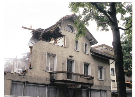
1.–17. Juni: An der Buchser Bahnhofstrasse muss eine Reihe traditionsreicher Häuser der Überbauung «Blickpunkt» weichen.

1.–17. Im Zentrum von Buchs laufen die Abbrucharbeiten auf den Liegenschaften Buchmann/Asch, Ködderitzsch und Hotel Rätia . Die alten Gebäude müssen der Grossüberbauung «Blickpunkt» weichen.