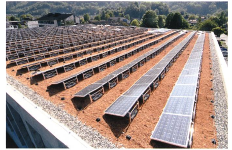
5. Mai: Die Fotovoltaikanlage auf dem Dach macht das Seveler Schul- und Sportzentrum Gadretsch zum Sonnenkraftwerk.