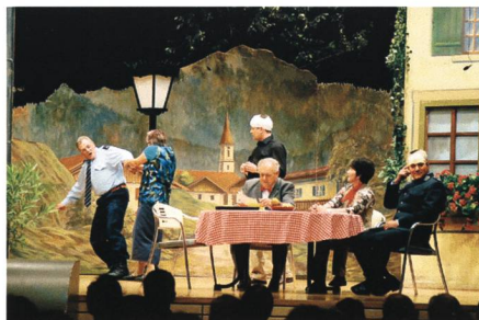
16. Oktober: Die Heimatbühne Werdenberg eröffnet ihre Spielsaison mit dem Bauernschwank «De Guggel-Chrieg».

19. Die Schlüsselstelle der alten Schollbergstrasse zwischen der Hohwand und dem grossen Steinbruch auf Gemeindegebiet von Wartau und Sargans wird wieder begehbar gemacht. Die Arbeiten dafür beginnen heute mit einem symbolischen Spatenstich.