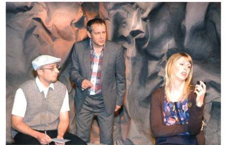
6. Mai: Die fabriggli-Eigenproduktion 2011 entführt die Zuschauer mit viel Witz in ein kleines irisches Dorf.

Bad Rans, die in Sevelen ein Luxushotel plant. Die Genossenschaft reicht beim Bundesgericht Beschwerde ein.