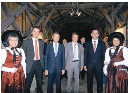
2. Juli: Honoratioren von hüben und drüben feiern den Abschluss der Renovation der alten Rheinbrücke Sevelen–Vaduz.