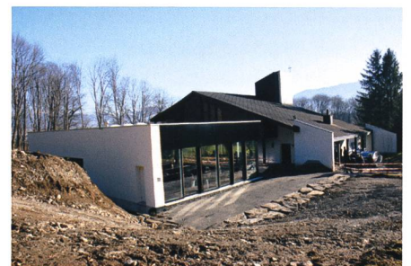
16. Januar: Die Katholische Kirchgemeinde Sennwald hat mit dem Antoniusstübli ihre bauliche Infrastruktur erweitert.