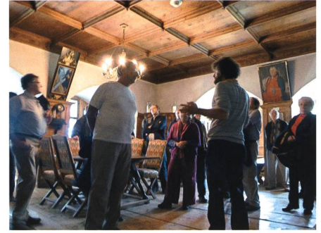
27. August: Die Historiker-Tagung über «Gesellschaft und Recht im Alpenheintal» führt auch aufs Schloss Werdenberg.

Fest den Umbau der Clubhütte auf Elabaria ein. Das Clubhaus wurde mit einer Bio-Pflanzen-Kläranlage ausgestattet.