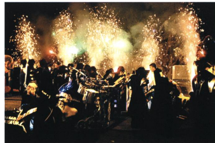
10. März: Mit der üblichen Verspätung der alten Fasnacht beginnen auch in der Gemeinde Wartau die närrischen Tage