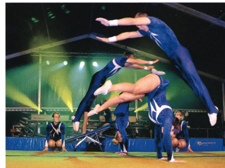
17. September: Absolut stilsicher und fit feiert der Turnverein Oberschan sein 125-jähriges Bestehen.