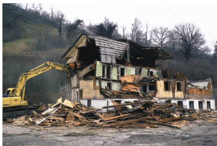
31. Januar: Die Tage des alten Bad Rans sind definitiv gezählt – derweil das Parkhotel-Projekt ins Stocken gerät.

31. Heute wird das Restaurant Bad Rans in Sevelen/Rans definitiv abgebrochen . Bereits im vergangenen Jahr war mit den Abbrucharbeiten begonnen worden, doch sie wurden danach wieder sistiert.