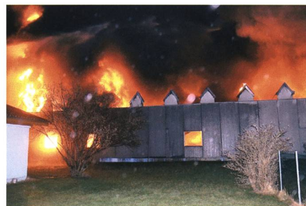
9./10. Januar: Innerhalb weniger Stunden zerstört ein Brand die Produktionshalle der Firma Wollimex in Sevelen.

15. Der Werdenberger Eisenbahn-Amateur-Klub feiert sein 50-jähriges Bestehen . Mitglieder und deren Angehörige