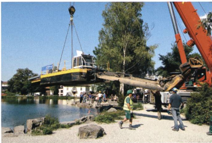
19. Mai: Am Werdenbergersee wird der Saugbagger für die Seesanieung angeliefert und gewässert.