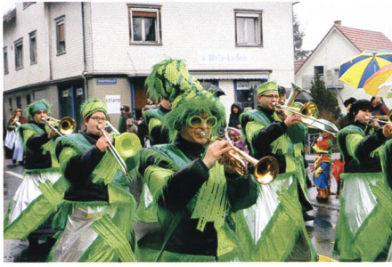
19./20. Februar: In Gams sind an diesem Wochenende in der Guggernacht und beim Umzug die Narren los.

26. An den Schweizer Meisterschaften der Jugendringer gewinnt der RC Oberriet-Grabs viermal Gold, einmal Silber und dreimal Bronze.