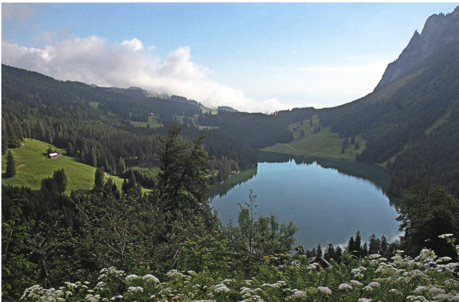
Voralpsee vom Nausfusswegli am Mittelberg: Hier hauste einst ein schrecklich böseartiger Lindwurm; links Bachbodenzimmer.

Als es durch die Walsergasse hinaufgeht, blitzt es auf der Chammegg und auch herunter durch den Wald – Blitz auf Blitz, und ein Krachen folgt dem andern. Gleich giesst und schüttet es wie aus Kübeln und Zubern und oben im Eichwald, da wird es lebendig: Der Drache wälzt sich! Risse entstehen im Boden, brechen zu Schründen auf und qualmen wie Schlote. Es wanken die Eichen, kreuzweise stürzen sie übereinander, lebendig wird der Grund, auf dem