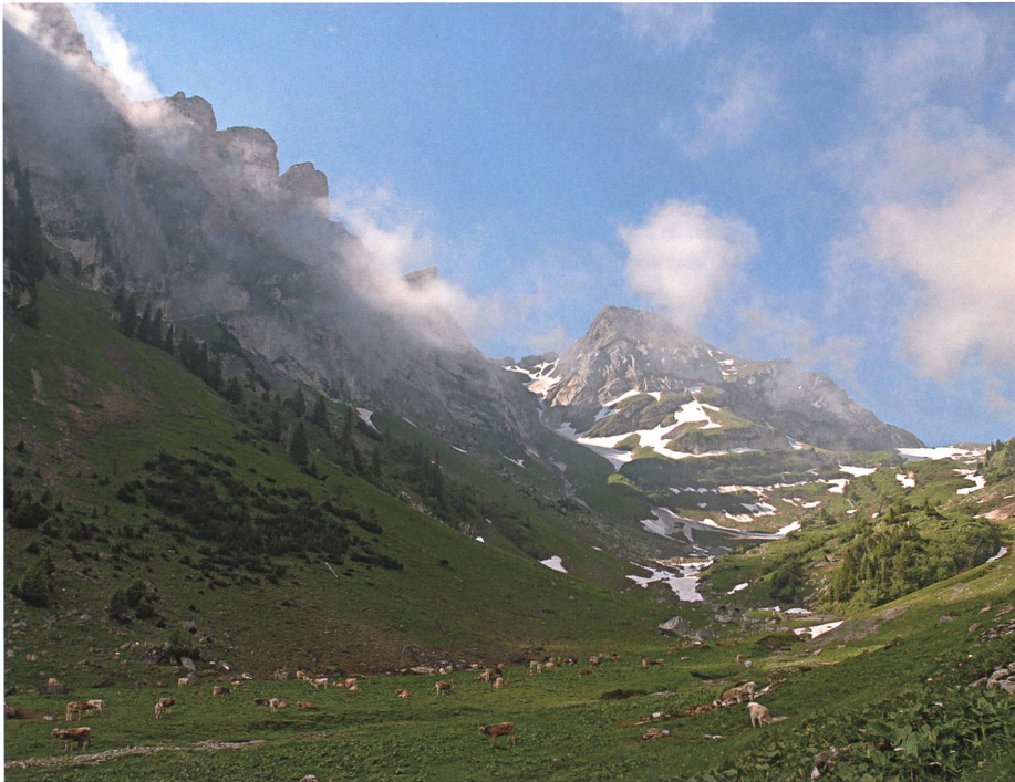
Auf Alp Naus entbrannte der fürchterliche Kampf zwischen dem Drachen und dem von den Grabsern gemästeten Stier.

alles steht; der Eichwald mitsamt dem Gut Mumpertjöris schiesst als ungeheure Rufe talwärts, hinab auf das Dorf! Das stolze Azmoos – ein Grab!