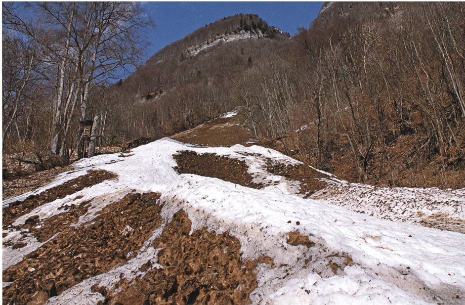
Neben Wildbächen verkörperten für unsere Vorfahren vielerorts auch gefährliche Lawinenzüge wie der Bonaloch-Chengel am Frümsner Berg den Drachen.