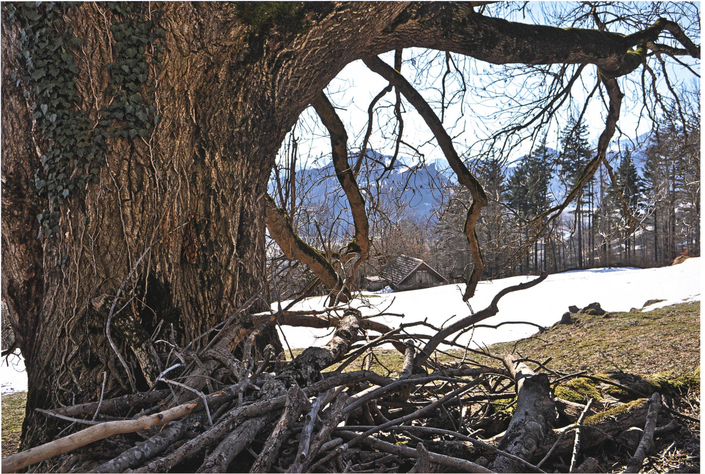
Beim Pöschenthal oberhalb Runggalu n schläft der Drache; bewegt er seinen Schweif, gerät das Dorf Azmoos in Gefahr.