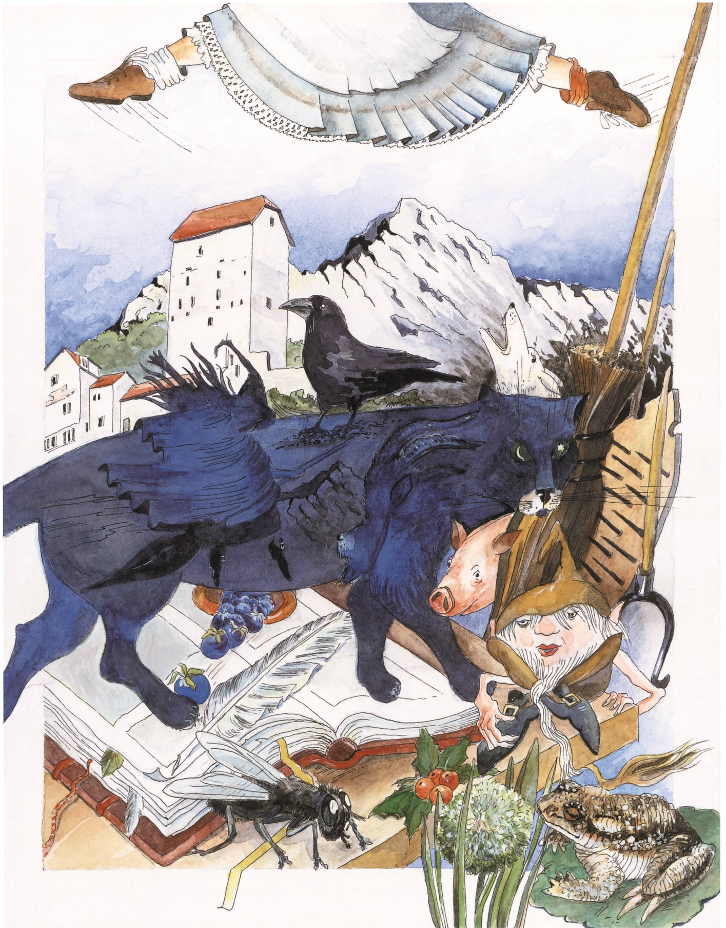
Illustration Constanza Filii Villiger, Buchs