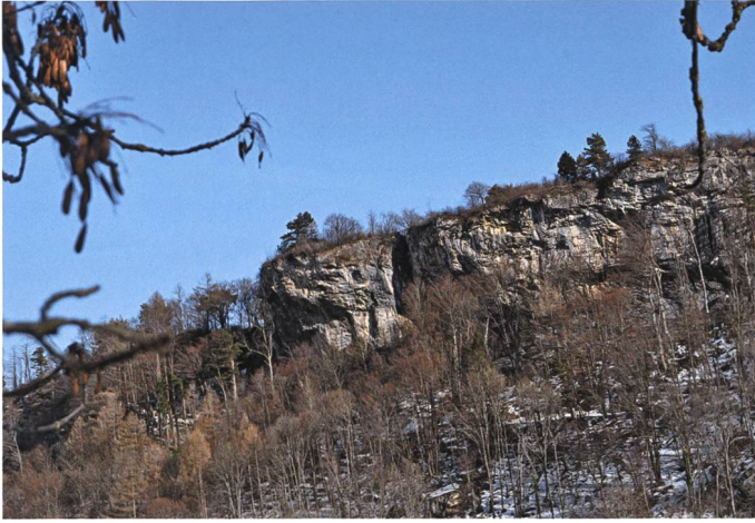
Von Gatin über Matlinis: Links an der Magletschwand zeigt sich gut erkennbar der Drachenkopf, der sich im einstigen Luggazu 3 nersee spiegelte.