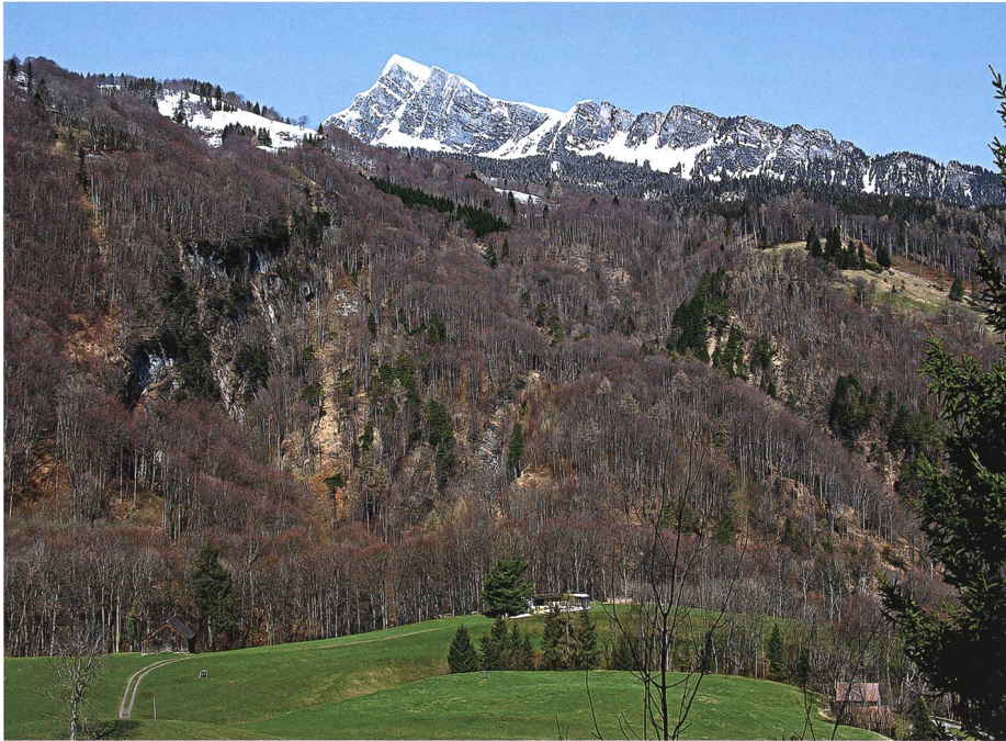
Chopfhalde bei Matug: Rechts das tiefe Tobel des einst ungezähmten «Ungeheuers» Trüebbach, links die Fluewand, gegen Gauschla und Flidachöpf.

Berg verschüttet. Das ist der Trüebbach, wirklich ein bössartiger Drache.