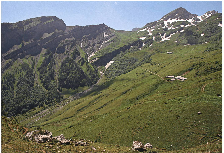
Von Altsess gegen Imalschüel: Bei den Roten Platten (Bildmitte oben) liess ein Venediger das helle Gold des Berges heraustropfen.

Das seit dem 15. Jahrhundert in weiten Teilen Europas verbreitete Volk der Zigeuner 3 , das keinen festen Wohnsitz kennt und als «Fahrendes Volk» oder «Heiden» von Ort zu Ort zieht, hat seinen Ursprung im fernen Indien. Das fremdländische Aussehen – schwarzäugig, braunhäutig und tiefschwarzes Haar – und ihre für Sesshafte nur teilweise verständliche Sprache trugen dazu bei, dass sie von der Bevölkerung mit einer gewissen Angst und Abnei-