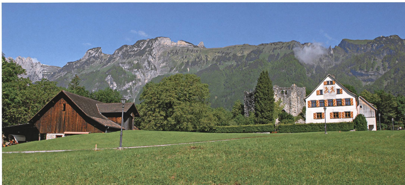
Auch vom Schloss Forstegg bis hinauf zu den Gipfeln der Berge gewannen die Venediger ihr Gold.

verhiess ihm keine Gunst. Was sollte das bedeuten? Erwartete ihn nicht seine Gemahlin daheim auf seiner Burg Forstegg?