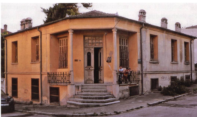
Nach der Vertreibung aus Trabzon liess sich die Familie Pelagidis in Drama nieder. Das stattliche Haus steht für die kaufmännische Seite Griechenlands.