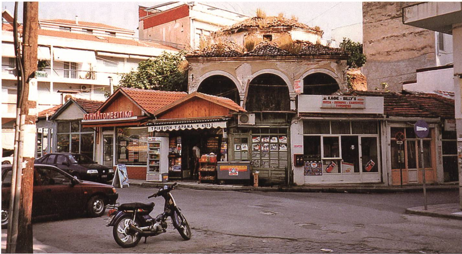
Bis 1913 gehörte die Provinzhauptstadt Drama zum osmanischen Reich. Heute erinnert daran noch die Moschee in der Altstadt.

zehn Kilometer ausserhalb der Provinzstadt Drama im Norden Griechenlands geboren. Er war das zweite Kind einer siebenköpfigen Familie.