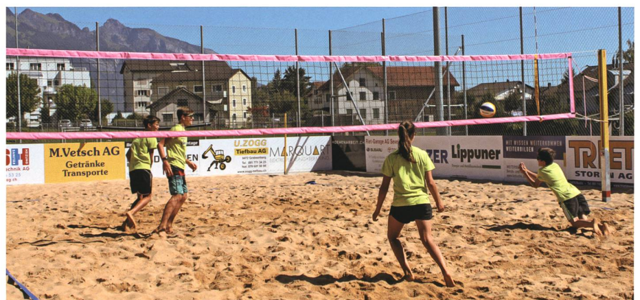
3.–7. August: Die Sportwoche bietet Hunderten von Kindern in der Region Betätigung in verschiedensten Sportarten.

22. Die Ursache für den Brand im Clubhaus der Hells Angels am Werdenberger See in Buchs vom Mai ist geklärt: Die