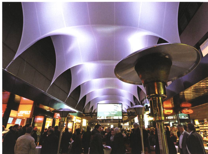
28. November: Die Metzgergasse in Buchs wird durch eine Membranüberdachung zur «Genuss- und Erlebnissgasse».