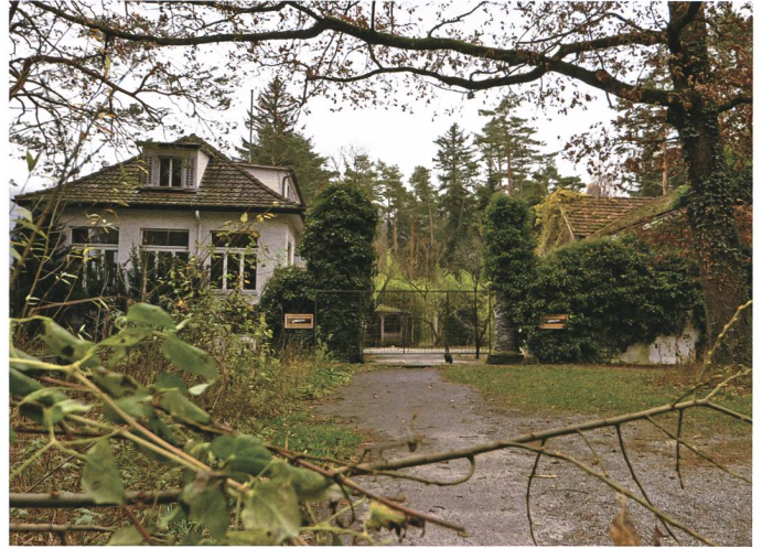
6. Dezember: Die Liegenschaft Heuwiese in Weite mit dem leerstehenden Restaurant kommt in öffentliche Hand.

zialetiketten, die Bedienung des Heimmarktes sowie Anwendungen für die Pharmaindustrie.