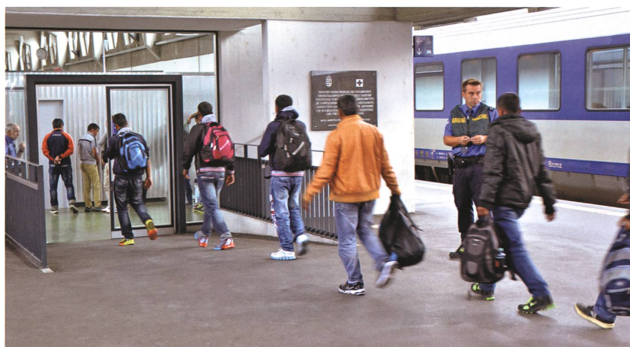
16. September: Im Bahnhof Buchs treffen in diesen Wochen täglich Flüchtlinge vor allem aus Syrien und Afghanistan ein.

18. Die Buchscher Schule feiert die Einweihung mehrerer Neu- und Erweiterungsbauten bei den Schulanlagen Hanfland und Grof . Die Bauten liegen im Budget von insgesamt 16,4 Millionen Franken. Tags darauf findet ein Tag der offenen Tür statt.