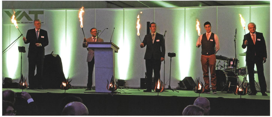
12. Juni: An der Feier zum 50-jährigen Bestehen der VAT AG in Haag zeigen sich drei VAT-Generationen ganz «Feuer und Flamme».

3. Am Ende der Junisession tritt der Buchser SVP-Politiker August Wehrli aus