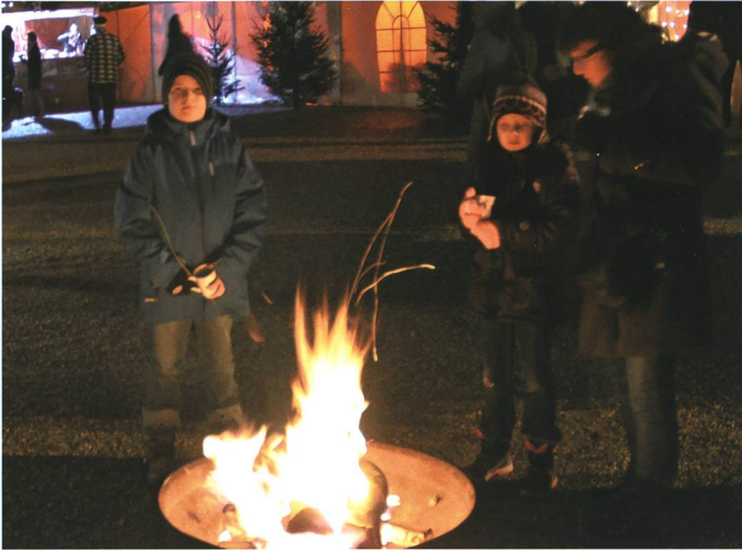
5.–7. Dezember: Am Chlausmarkt auf dem Buchser Marktplatz werden auch Feuerschalen zum Aufwärmen geschätzt.