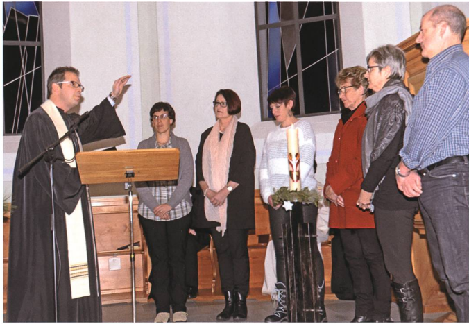
1. Januar: In Gretschins und Azmoos wird die «Geburt» der neuen Evangelisch-reformierten Kirchgemeinde Wartau gefeiert.