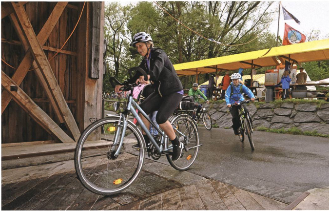
3. Mai: Trotz wenig einladendem Wetter wird der 10. slowUp Werdenberg-Liechtenstein zum Volksfest mit rund 13 000 aktiv Teilnehmenden.