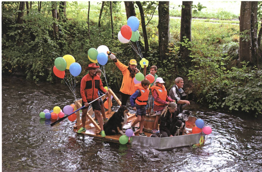
16. August: Die Chübelregatta der Buchser Pontoniere bringt kunterbuntes Leben auf den Binnenkanal.