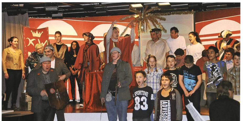
21. Dezember: Grabser Schüler und Bewohner und Mitarbeitende des Lukashauses bieten ein gemeinsames Weihnachtsspiel.

20. Es wird bekannt, was die Detailplanung für den Neubau des Werkhofs Sennwald in Salez ergeben hat: Die Baukosten laufen aus dem Ruder . Laut aktuellem Stand würde der neue Werkhof – inklusive Land – 6,6 Millionen Franken kosten. Der auf Basis des Vorprojekts mit Kostenberechnungen von den Stimmbürgern am 17. Juni 2012 genehmigte Kredit beträgt aber lediglich 4,6