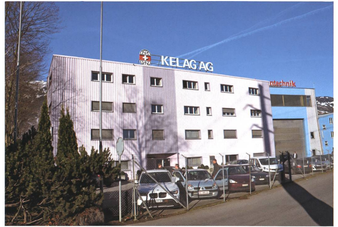
6. Januar: Schweizer Privatinvestoren übernehmen Teile der Kelag-Gruppe in Sennwald. Es gibt 44 Kündigungen.

Millionen Franken. Der Gemeinderat hat darauf einen « Marschhalt » beschlossen. Die Situation werde mit den Planern genau analysiert, heisst es von seiten des Gemeinderates.