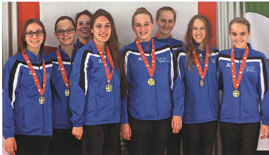
18./19. April: Vier Gold-, eine Silber- und eine Bronzemedaille ist die Ausbeute der Synchronschwimmerinnen des SC Flös an den Schweizer Meisterschaften.