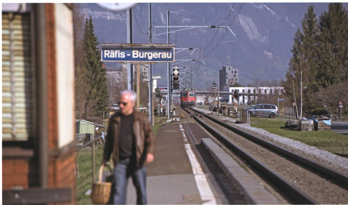
27. Oktober: Die Bahnstation Räfis-Burgerau bleibt aus «fahrplantechnischen Gründen» definitiv geschlossen.