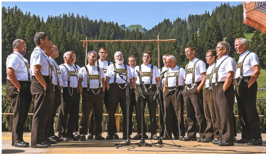
5. Juli: Der Jodlerklub Bergfinkli Grabs bietet an der Älplerchilbi auf Gamperfin einmal mehr ein abwechslungsreiches Programm.

4. Der rutschige Belag des Kreisels Dornau in Trübbach hat immer wieder für