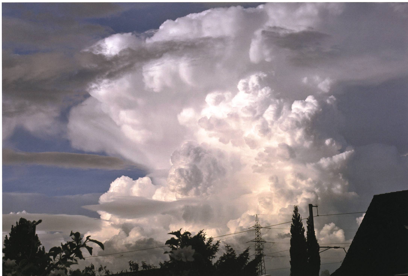
Aufbau einer Gewitterzelle über dem Liechtensteiner Unterland am 28. April 2015.