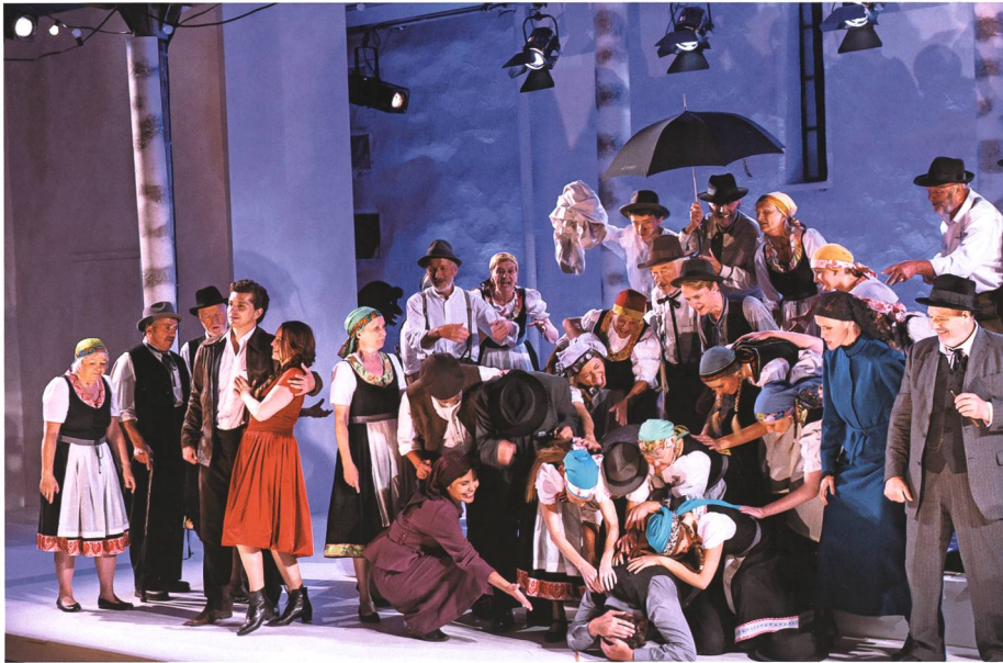
7. August: Mit Smetanas «Die verkaufte Braut» feiern die Werdenberger Schloss-Festspiele eine begeisternde Premiere.

Kantonspolizei geht von Brandstiftung aus. Die Täterschaft ist unbekannt.