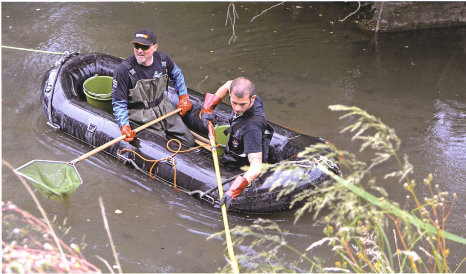
17. Juli: Trockenheit und Hitze veranlassen den Fischereiverein Werdenberg in manchen Gewässern zu Rettungsaktionen.