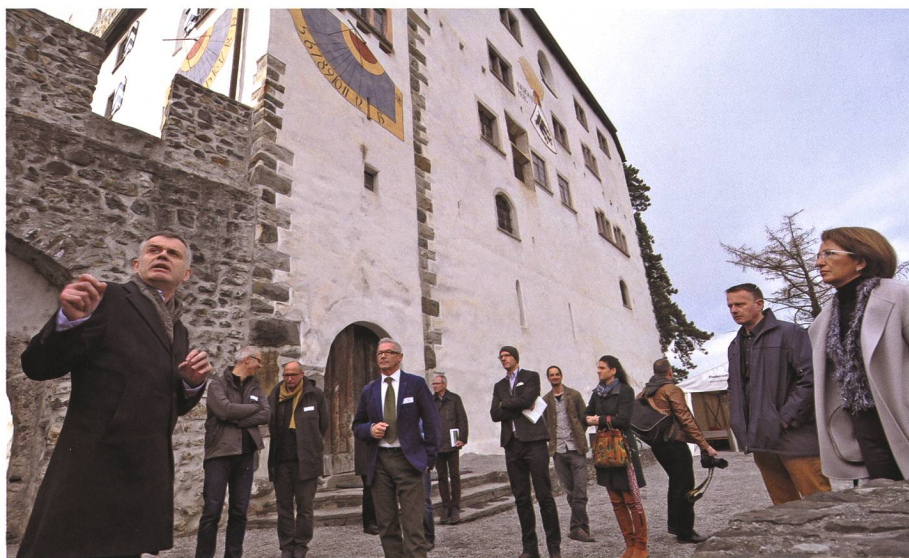
27. März: Nach Einsatz von 4,7 Millionen Franken wird das Schloss Werdenberg mit Bistro und neuem Museum eröffnet.