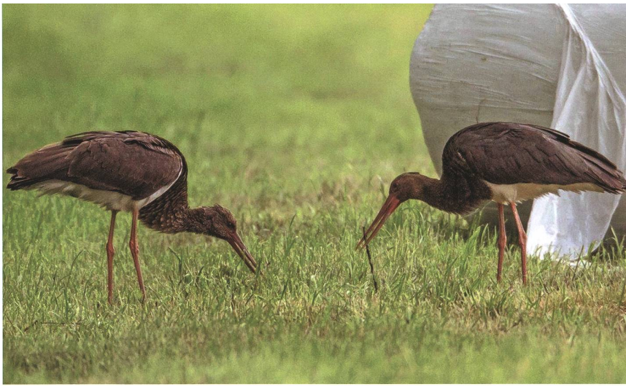
Ein Schwarzstorchpaar hielt sich Mitte Mai 2015 im Ruggeller Riet auf.