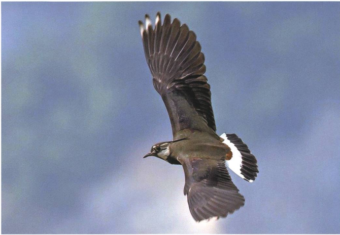
Erfreulich war die erfolgreiche Brut eines Kiebitzpaars im Ruggeller Riet.