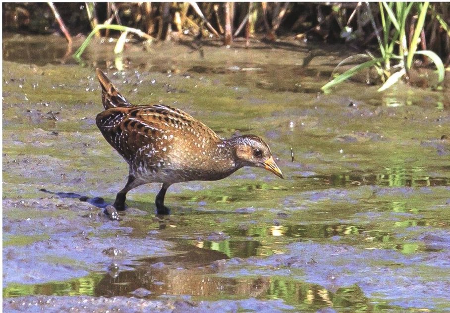
Auf dem Herbstzug konnten am Egelsee bei Mauren verschiedene, auch aussergewöhnliche Vogelarten beobachtet werden, so auch das Tüpfelsumpfhuhn.

ren zuvor wurde so intensiv gearbeitet, dass bereits jetzt über 80 Prozent aller Kilometerquadrate bearbeitet sind. Auch gab es wieder erstaunliche Brutnachweise, so vom Grünlaubsänger, einer in Nordosteuropa beheimateten Art, vom Schlangennadler im Wallis, von Brutten oder Brutversuchen von Krickente, Mornellregenpfeifer, Küstenseeschwalbe, Cistensänger, Seidensänger und Schilfrohrsänger.