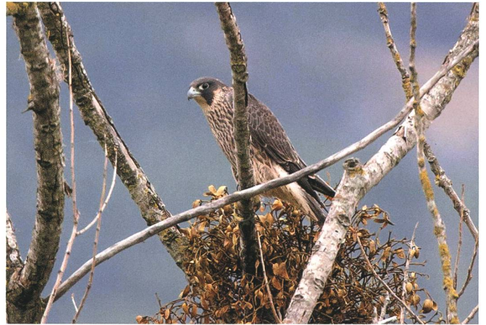
In den letzten Jahren sind verschiedene Vergiftungsfälle von Wanderfalken bekannt geworden.