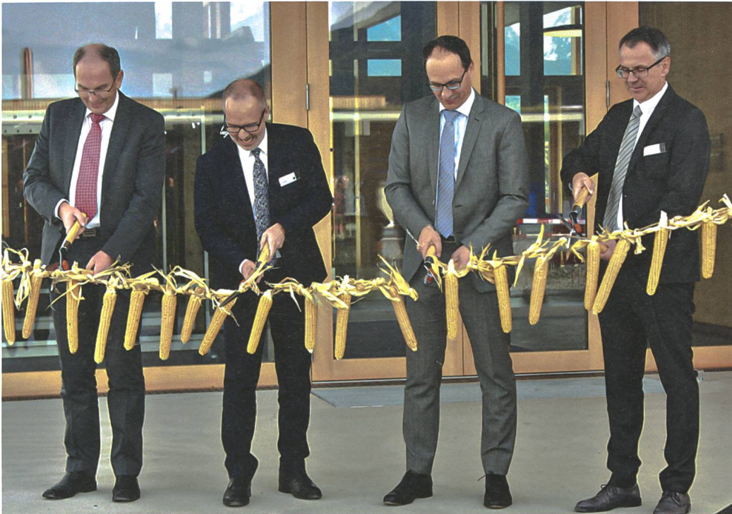
17.5.2019: Der Erneuerungsbau des Landwirtschaftlichen Zentrums LZSG Rheinhof, Salez, wurde – zweieinhalb Jahre nach der Grundsteinlegung – offiziell eingeweiht.

und Erweiterung Altersheim Möösli» mit Kosten von 2.54 Millionen Franken grünes Licht. Die Stimmbeteiligung betrug 46.2 Prozent. 20.5.2019