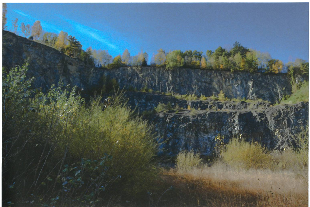
28.7.2018: Der Zugang zum Steinbruch Campiun musste aus Sicherheitsgründen verboten werden.