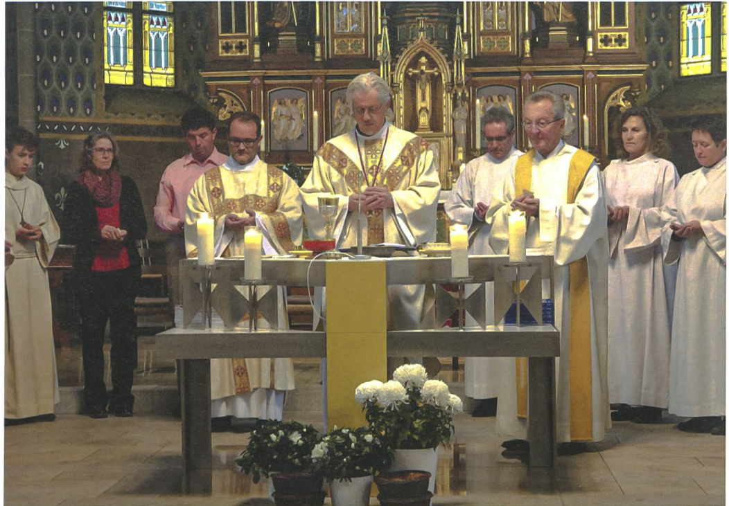
18.11.2018: Das 150-Jahr-Jubiläum der St. Michaelskirche wurde bei einem Festgottesdienst gebührend gefeiert.