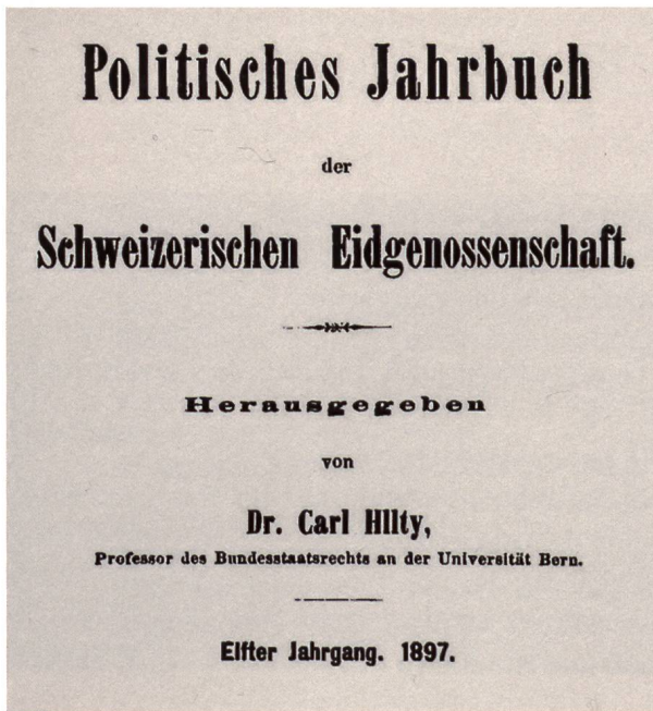
1897 veröffentlichte Carl Hilty im Politisches Jahrbuch der Schweizerischen Eidgenossenschaft seine Abhandlung über die Notwendigkeit des vollen Frauenstimmrechts.

begründen sollten; auch eine physiologische Inferiorität der Frauen schliesst er aus, denn «der Besitz eines Rechtes erzieht und befähigt auch zum Gebrauch desselben, und niemand kann als in dieser Hinsicht unbefähigt erklärt werden, bei welchem man den Versuch noch nicht gemacht, vielmehr sehr sorgfältig ausgeschlossen hat. Es ist das die ungerechte Argumentation, welche die sogenannten herrschenden Völker seit jeher gegen die von ihnen Unterdrückten angewendet haben. [...] Wir halten dafür, es komme bei jedem Menschen, heisse er Mann oder Weib, auf die individuelle Begabung seitens Gottes, und in höchster Stufe auf die Möglichkeit der Einwohnung eines Geistes an, der nicht in jedem Sinne der unserige ist.» 16