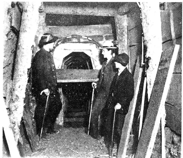
Das Alvierwerk. Abbildung 10. Stollen mit Leerbögen.

Wir hoffen für unser gemeinnütziges Werk auf die tatkräftige Unterstützung aus allen Kreisen, denen an einer