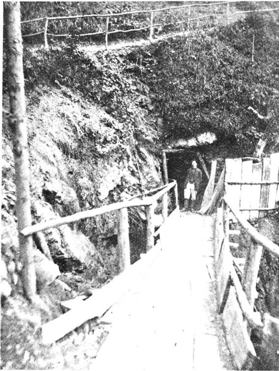
Das Alvierwerk. Abbildung 9. Das Fenster 6.