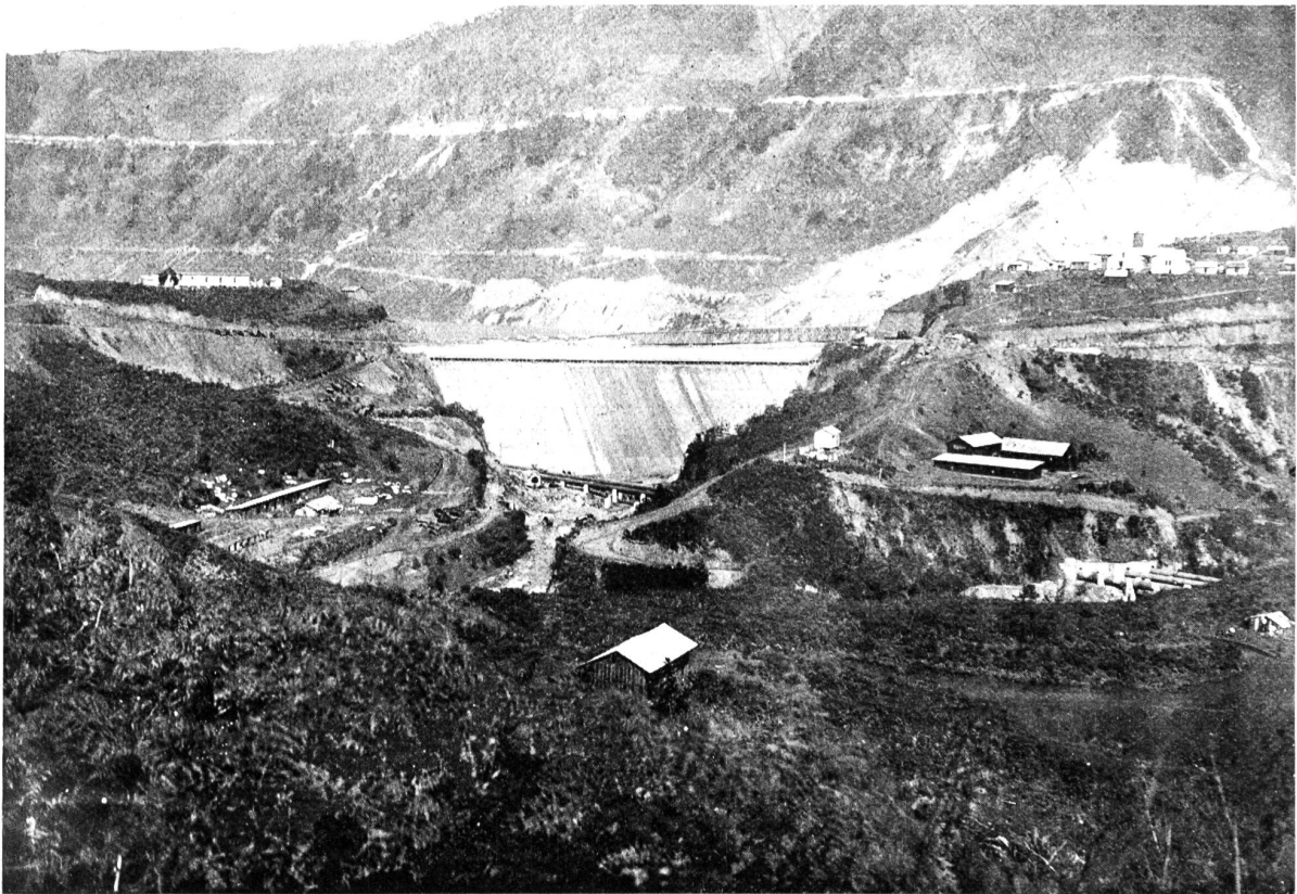
Der Necaxa-Damm. Figur 3. Der Necaxa-Damm von unten gesehen.

Diese letzte Bedingung ist es, welche eigentlich allein die Art des Baues bestimmt. Da alles Ma-