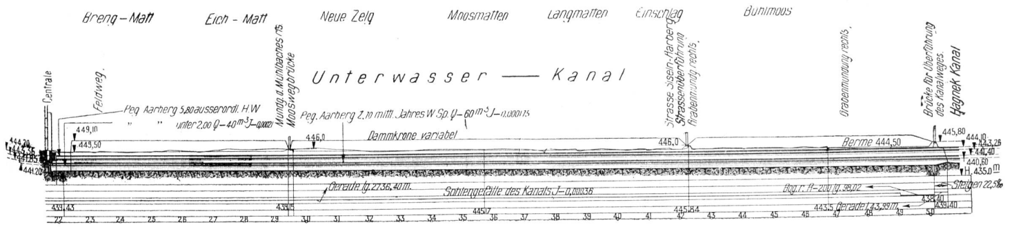
vom Wehr bis zum Ende des Unterwasserkanals. für die Höhen 1 : 1600.

derung von Konvektionströmen und damit einer ausgeprägten Sprungschicht weniger förderlich ist.