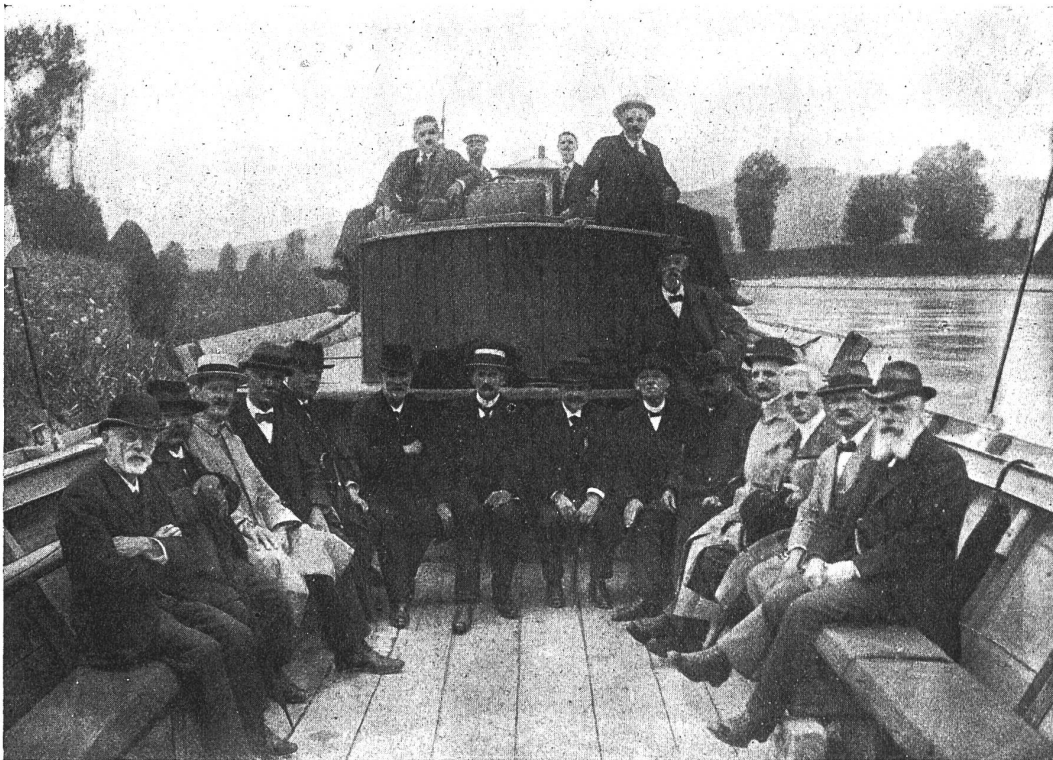
Namen der Teilnehmer: