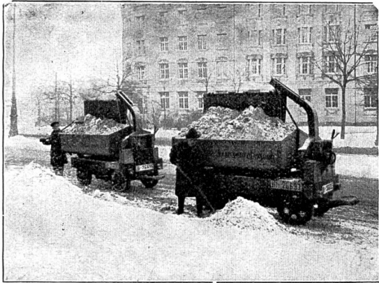
Abb. 22 Elektrokarren von 1\frac{1}{2} m^3 Fassungsvermögen beim Abtransport von Schnee.

Auf Seite 38 des laufenden Jahrgangs der Schweizer Elektro-Rundschau brachten wir einen Aufsatz über obiges Thema. Die nachfolgenden Abbildungen illustrieren und ergänzen die erwähnten Ausführungen.