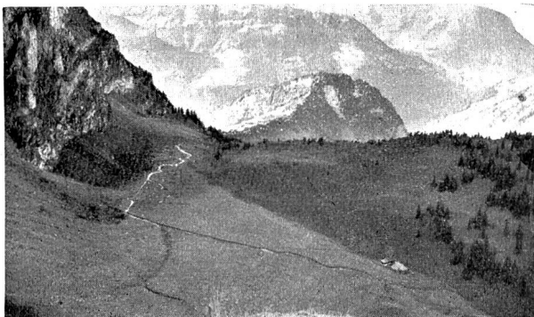
Abb. 1. Kraftwerk Bannalp. Talboden der Bannalp.

Zu diesem Zwecke eignet sich der Talboden