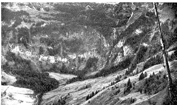
Abb. 3. Kraftwerk Bannalp. Gelände der Druckleitung.

Die mit den Turbinen direkt gekuppelten Drehstromgeneratoren sind berechnet für eine Leistungsabgabe von je 3000 kVA bei einer Maschinenspannung von 11,000 V, die infolge des räumlich eng begrenzten Absatzgebietes für die