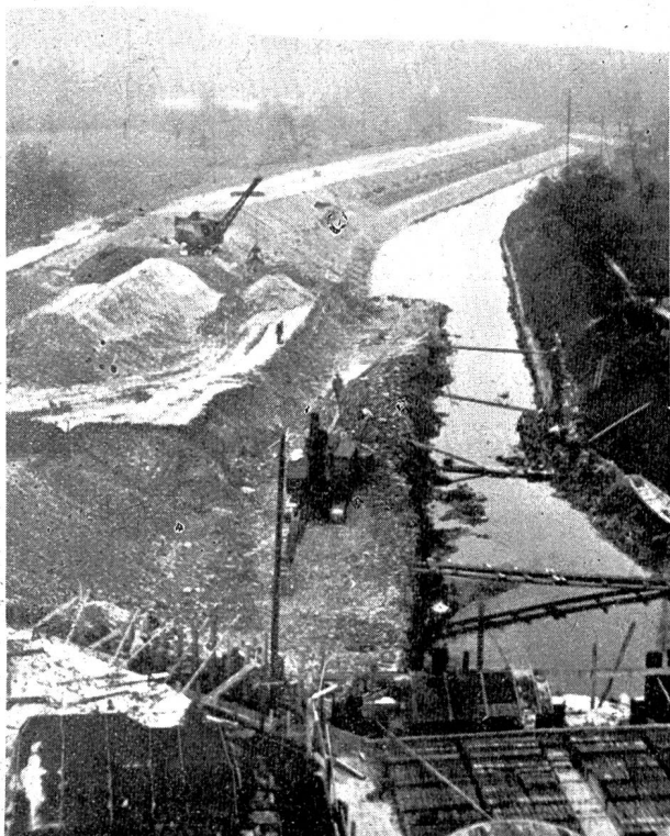
Abb. 6. Kraftwerk Bronzwarenfabrik A. G., Turgi. Unterwasserkanal im Bau, Ansicht von oben.

In unserem Artikel über das Kraftwerk Dixence in der vorigen Nummer dieser Zeitschrift haben wir auf die Schwierigkeiten bei der restlichen Finanzierung dieses Werkes hingewiesen, die auf den Umstand zurückzuführen sind, daß es der S. A. l'Energie de l'Ouest-Suisse (EOS) in Lausanne nicht möglich war, die vorgesehenen Erhöhungen des Aktien- und Obligationenkapitals vorzunehmen. Da die damals erwähnten Verhandlungen mit den Banken über die Eröffnung eines Baukredites von 20 Mill. Fr. an