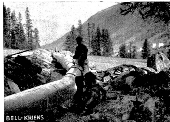
Abb. 59 Elektrizitätswerk Samaden Montage der Druckleitung zwischen Pontresina und Alp Prüma.

Die durchschnittliche Leistung der Kraftanlage beträgt 136 kW. Der überschüssige Strom der neuen Kraftanlage wird dem Netz der Bündner Kraftwerke zugeleitet, die ihn kostenlos erhalten; dadurch erleichtert sich der Betrieb des Gemeinde-Kraftwerkes, weil die dauernde Wartung und Einstellung der Maschinen entfällt. Die Gemeinde hat nur streng zu beachten, dass die fremde Stromspitze niemals überschritten wird. Sie kann sie tief halten