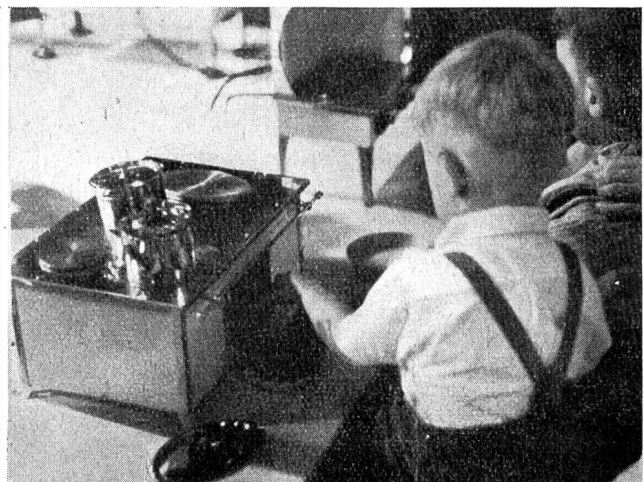
Fig. 5 Bereits im Jahre 1935 fand in Essen, im Rahmen einer Elektrowärme-Tagung des R. W. E., vom 22. bis 29. Mai eine «Elektrowoche» statt, die einen recht guten Erfolg verzeichnete. Bild links: Werbewagen der Essener Strassenbahn für die «Elektrowoche». Bild rechts: Elektrische Kinderküche an der Elektrowärmeausstellung. «Semaine de l'électricité», organisée en 1935, à Essen, dans le cadre d'un Congrès d'électrothermie du R. W. E. A gauche: une voiture de propagande des tramways municipaux. A droite: une cuisinière électrique pour enfants à l'exposition des applications électrothermiques.