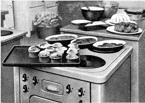
Fig. 19 Einige wohlgelungene Leckerbissen aus dem elektrischen Haushaltsbackofen. Appétissants gâteaux, cuits au four électrique.

L'industrie électrotechnique occupait cette année, à la Foire de Bâle, un nombre respectable de stands bien garnis. Nous publierons dans le prochain numéro de cette revue un rapport sur les nouveautés qui y furent présentées. Cette 21 e Foire suisse fut, à